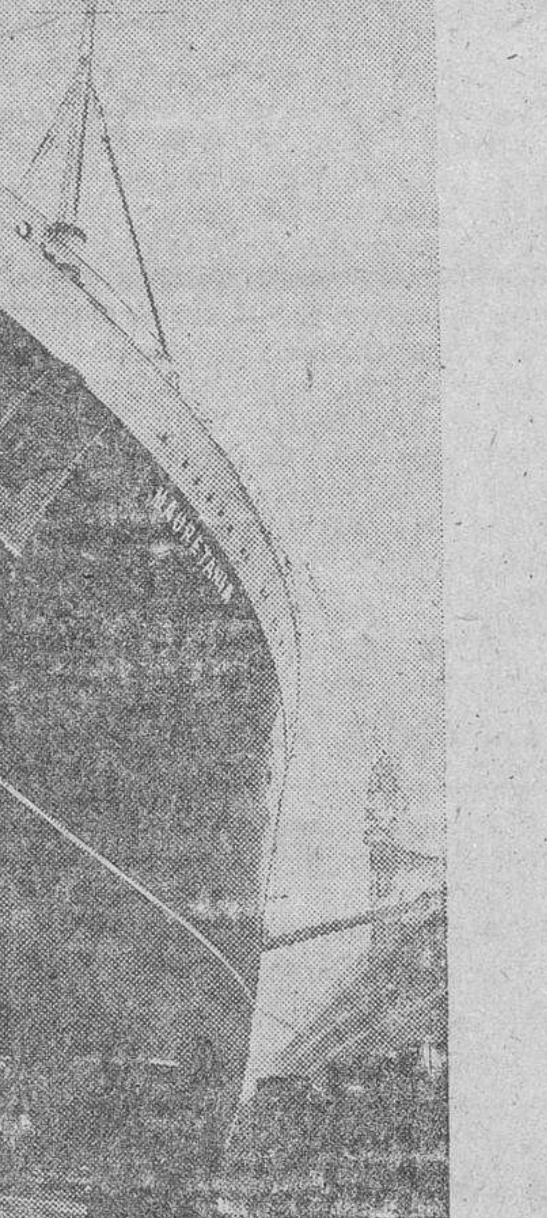
El "Mauretania", de 35.677 toneladas, empleado durante la guerra para el transporte de tropas entre los diversos frentes de batalla, está ahora dispuesto para volver a ocupar su puesto, como uno de los trasatlánticos de lujo de la Gran Bretaña.