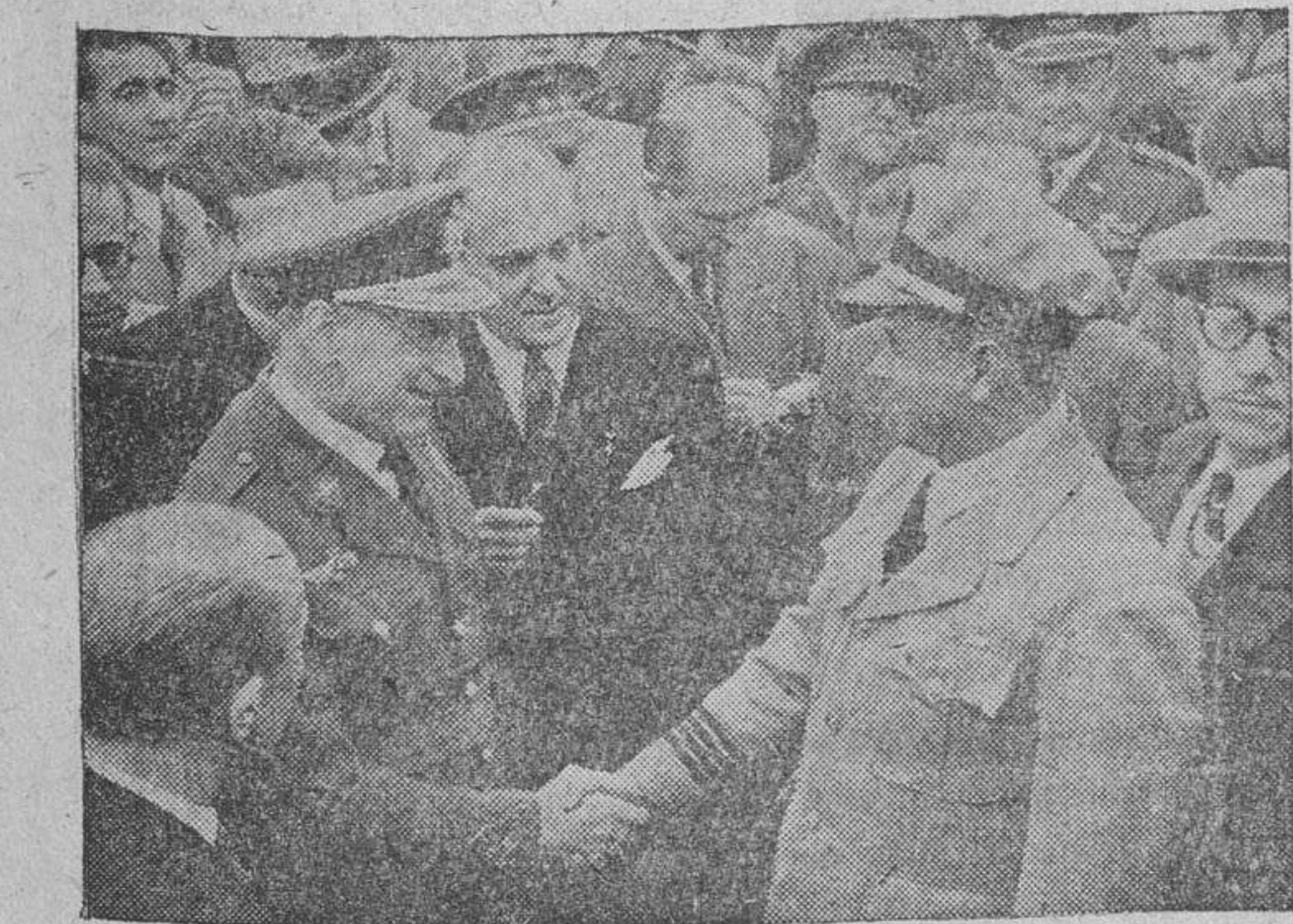
A bordo de este avión venían 41 personas, entre ellas, el coronel Arnáiz, héroe del famoso vuelo «raid» Manila-Madrid, verificado en 1936. El coronel Arnáiz, a su llegada al aeropuerto de Barajas, es saludado por el subsecretario del Aire, general Sáez de Buruaga, que ha acudido a recibir en representación del ministro, que se halla ausente.