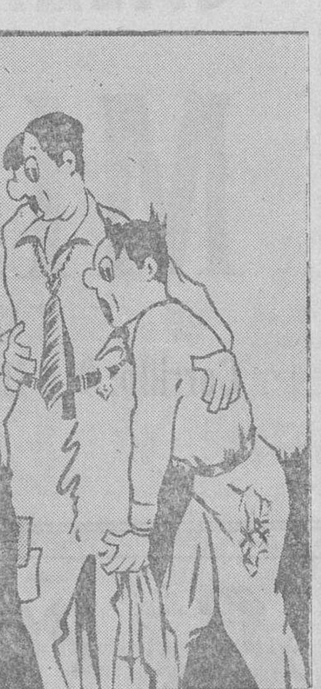
—¡Mi malicia ya se han arañado los terneros!