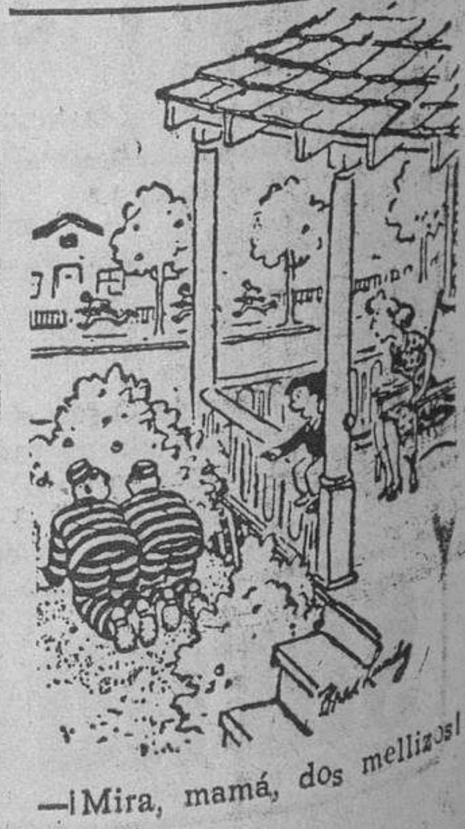
—Mira, mamá, dos mellizos!