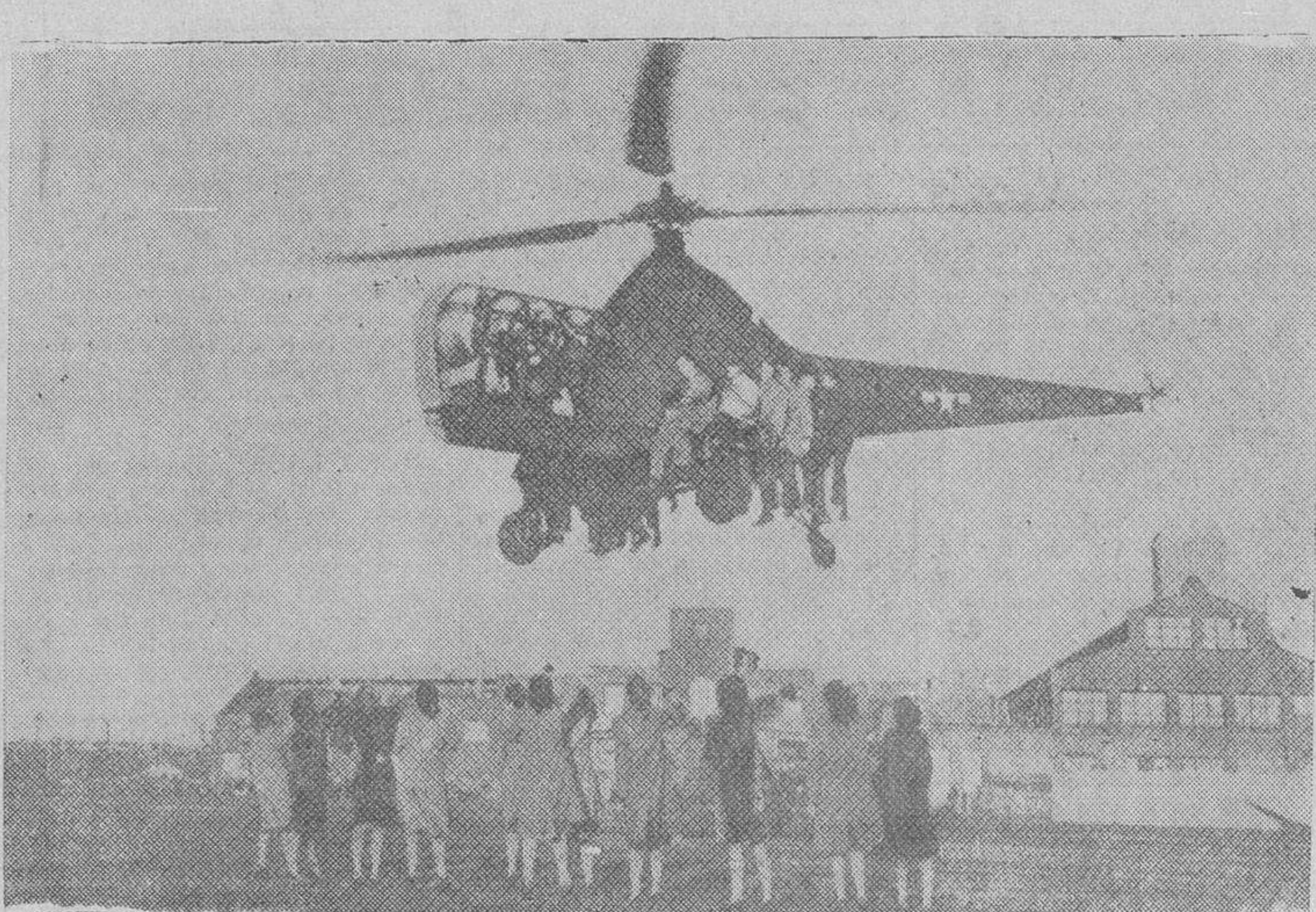
El nuevo helicóptero norteamericano «Sikorsky R-5» durante las pruebas realizadas en los Estados Unidos. El aparato lleva a bordo diecisiete personas