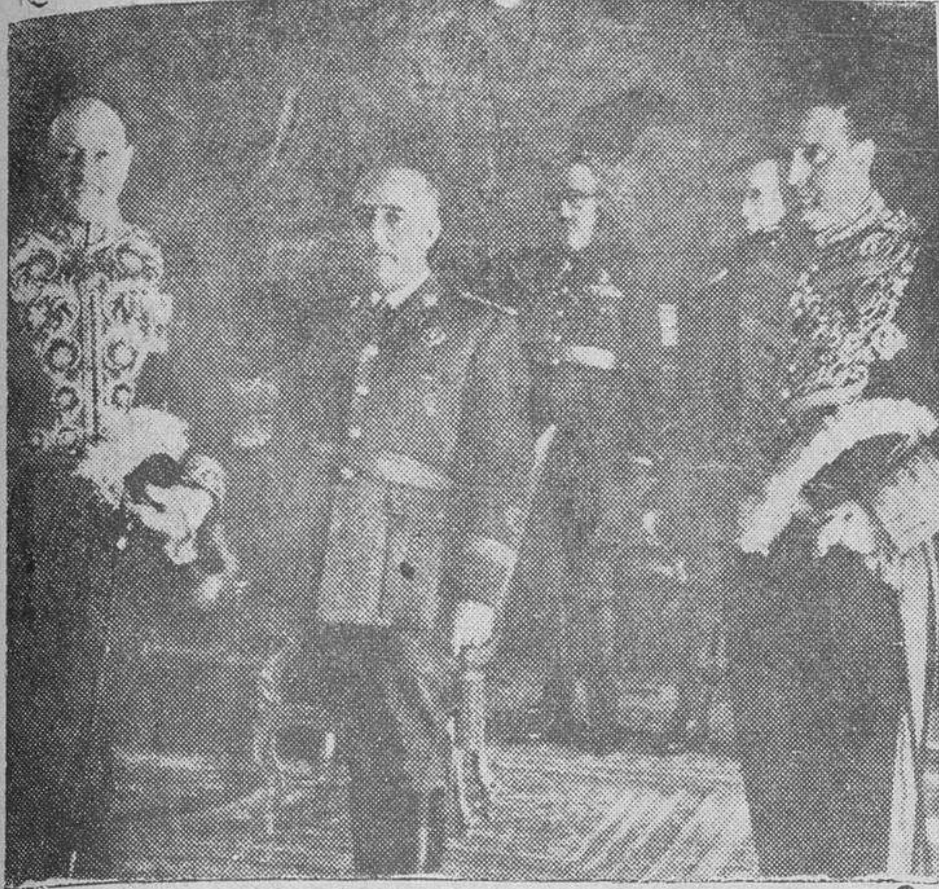
S. E. el Jefe del Estado, en el momento de recibir al nuevo ministro de Holanda en España, quien presentó al Caudillo sus cartas credenciales. En la fotografía figura también el ministro de Asuntos Exteriores, señor Martín Artajo