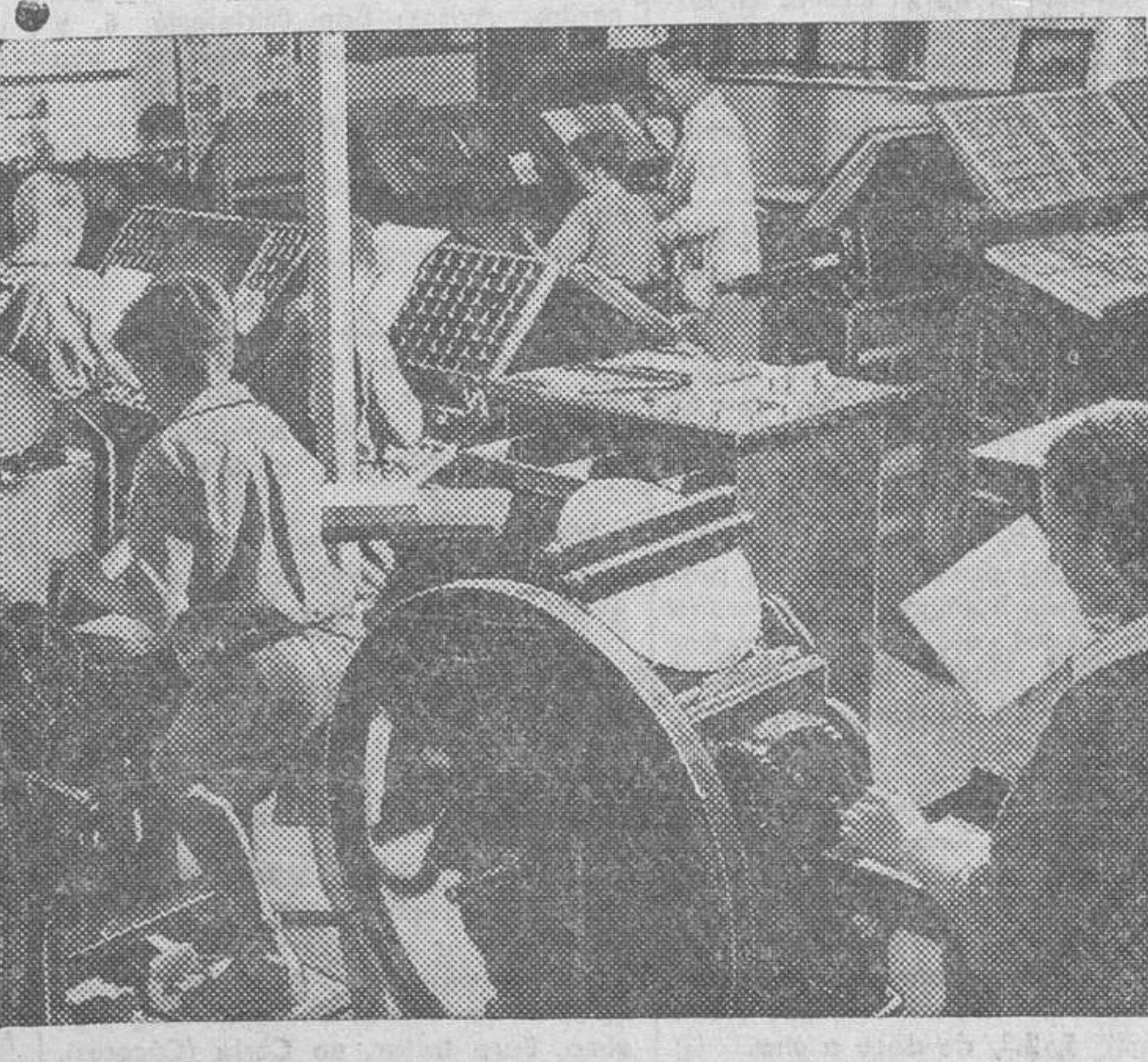
En la escuela para niños inválidos de Chailley, Sussex, se enseñan a los alumnos, además de las correspondientes asignaturas del curso, un oficio. La fotografía recoge un momento de las prácticas de imprenta. (Foto Calpe).