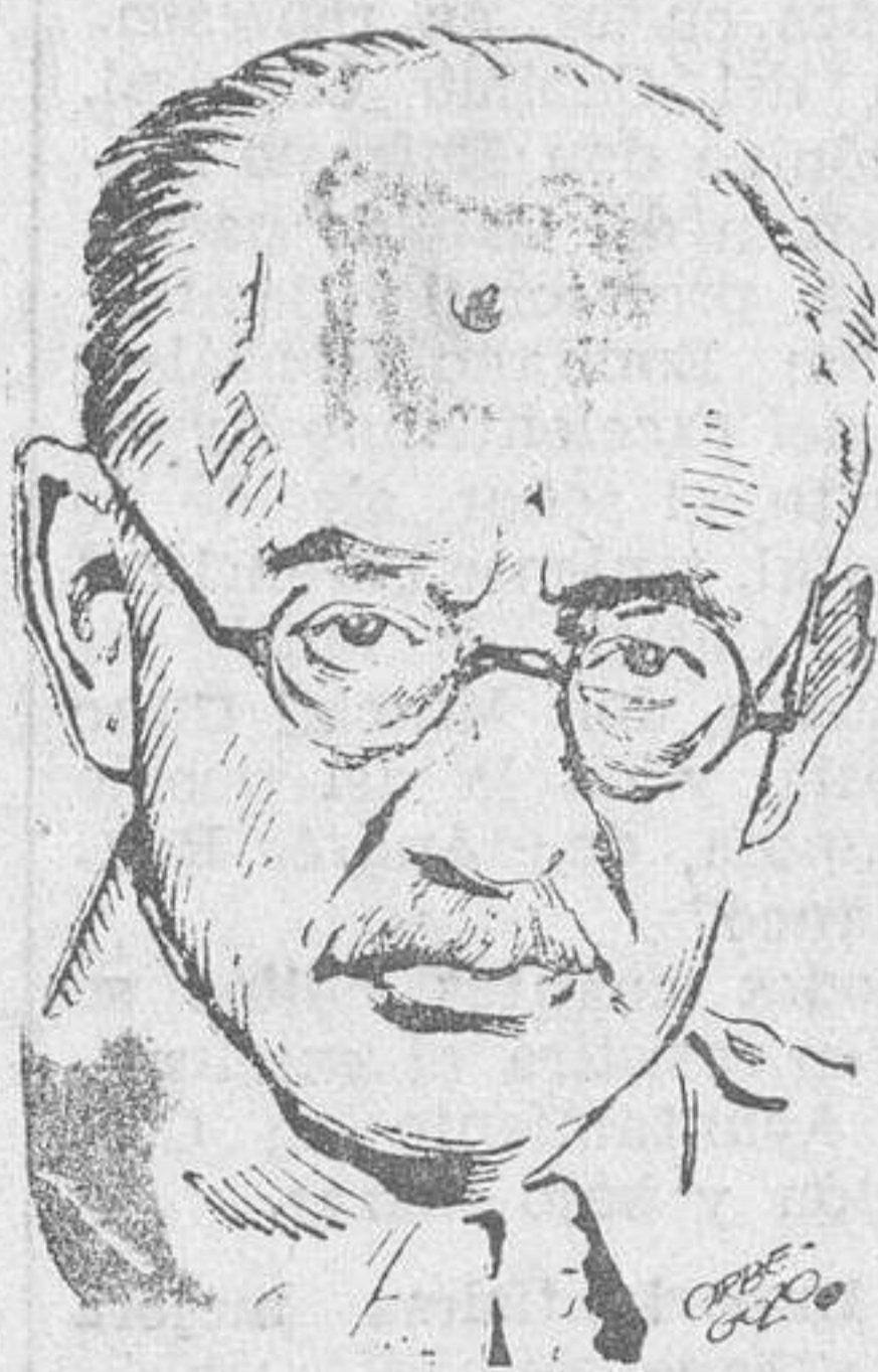
El general Vigón, nuevo jefe del Alto Estado Mayor

general jefe del Alto Estado Mayor la Dirección de la Escuela Superior del Ejército, por el que se promueve al empleo de teniente general al