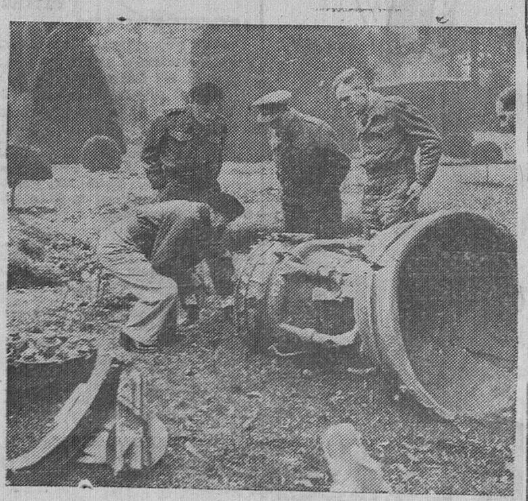
El mariscal Montgomery examina, en unión de otros oficiales ingleses, los restos de una "V-2", caída sobre Bélgica.