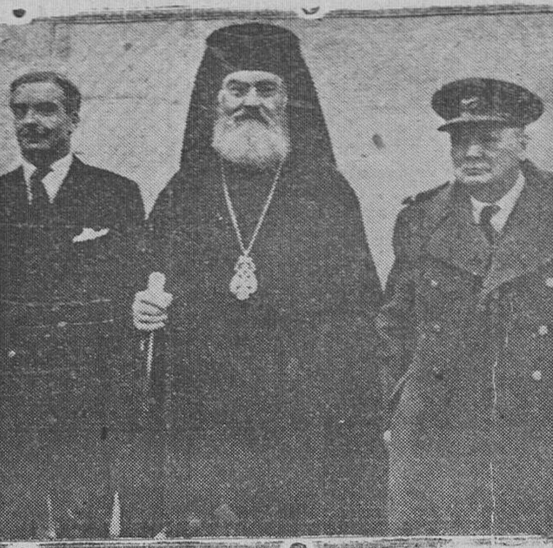
El primer ministro inglés, Winston Churchill, durante su estancia en Atenas, acompañado del arzobispo Damaskinos y de Mr. Eden