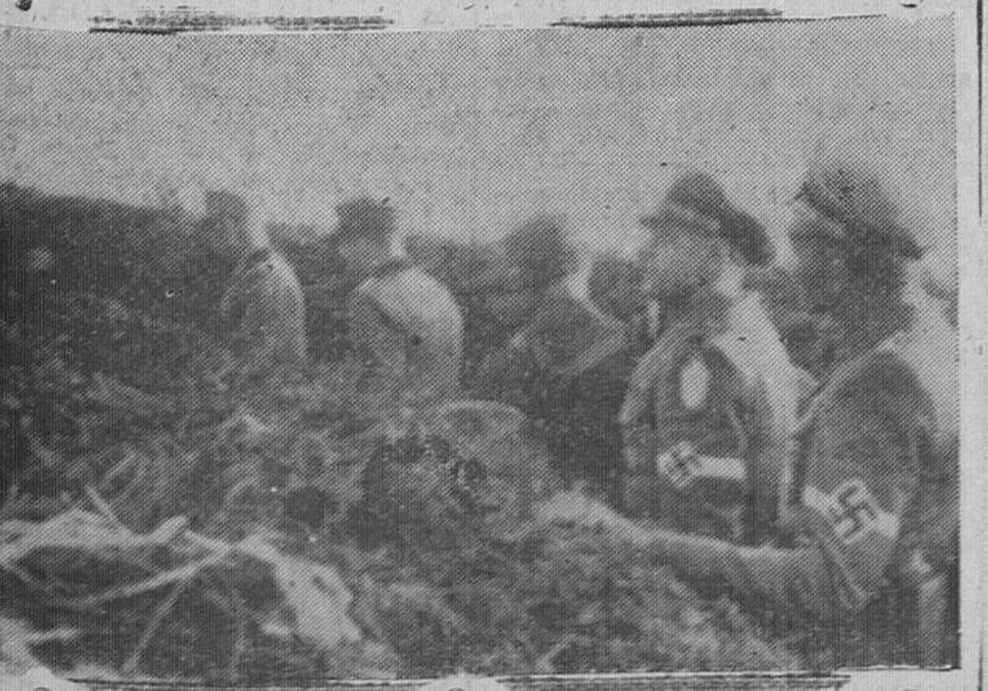
En visita de inspección a los muchachos de las Juventudes Hitlerianas, pertenecientes a los reemplazos últimamente movilizados en Alemania, una comisión de ocho jefes de aquella organización, ha recorrido las primeras líneas del frente del Este.