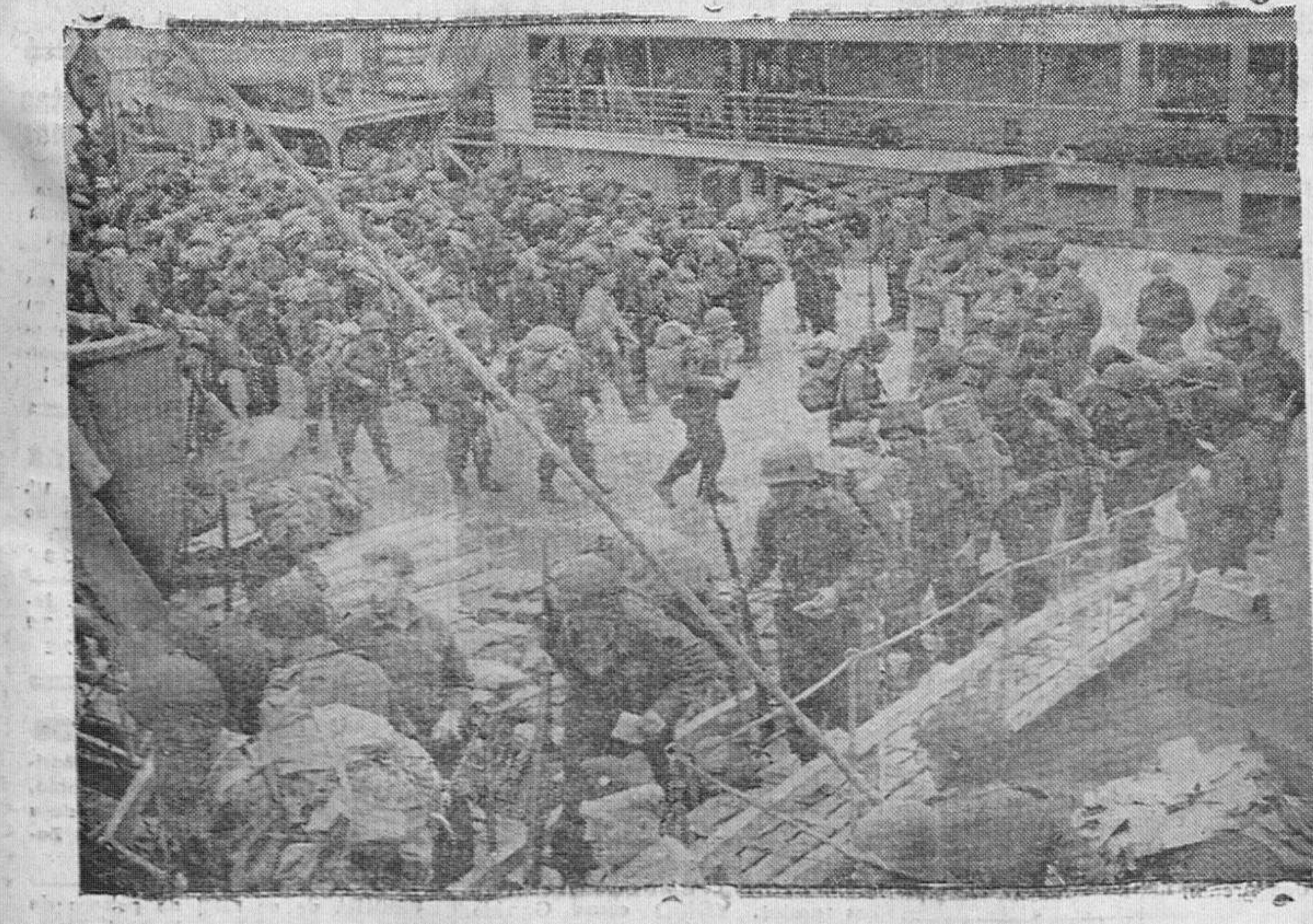
Un Ejército canadiense, embarcando para el frente europeo