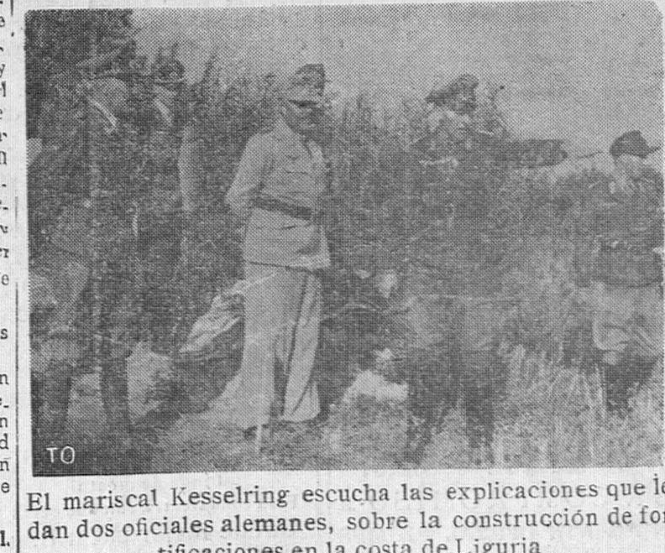
El mariscal Kesselring escucha las explicaciones que le dan dos oficiales alemanes, sobre la construcción de fortificaciones en la costa de Liguria