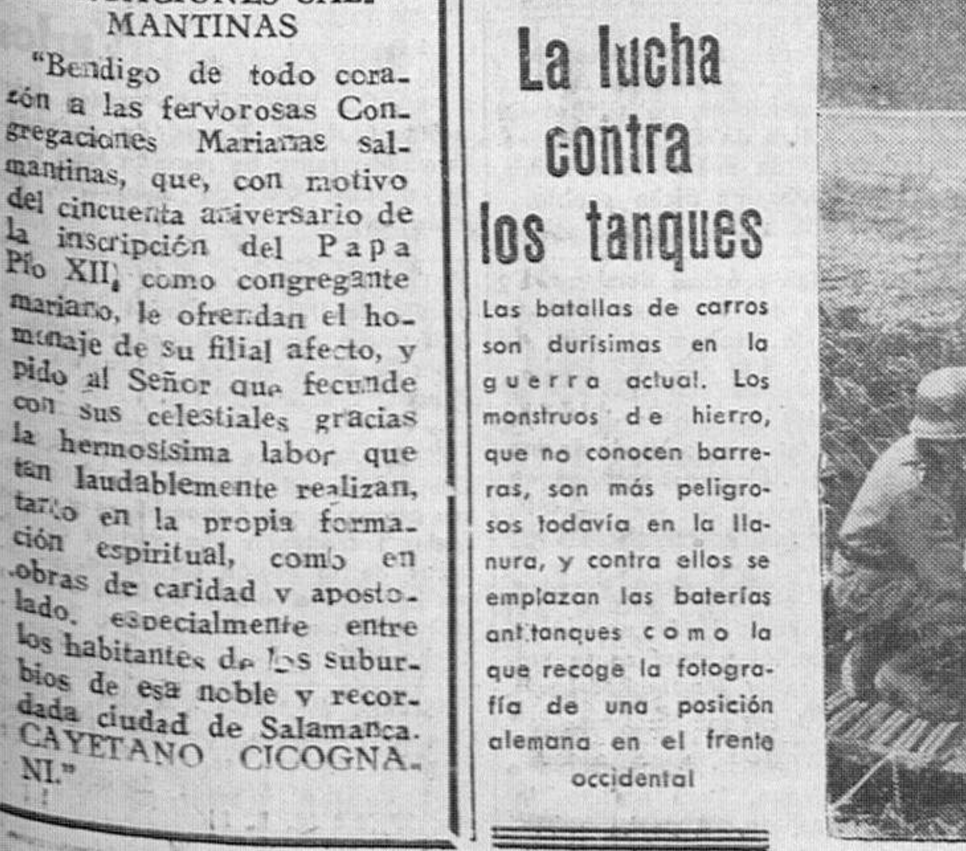
Los batallas de carros son durísimas en la guerra actual. Los monstruos de hierro, que no conocen barreras, son más peligrosos todavía en la llanura, y contra ellos se emplean las baterías antitanques como la que recoge la fotografía de una posición alemana en el frente occidental.