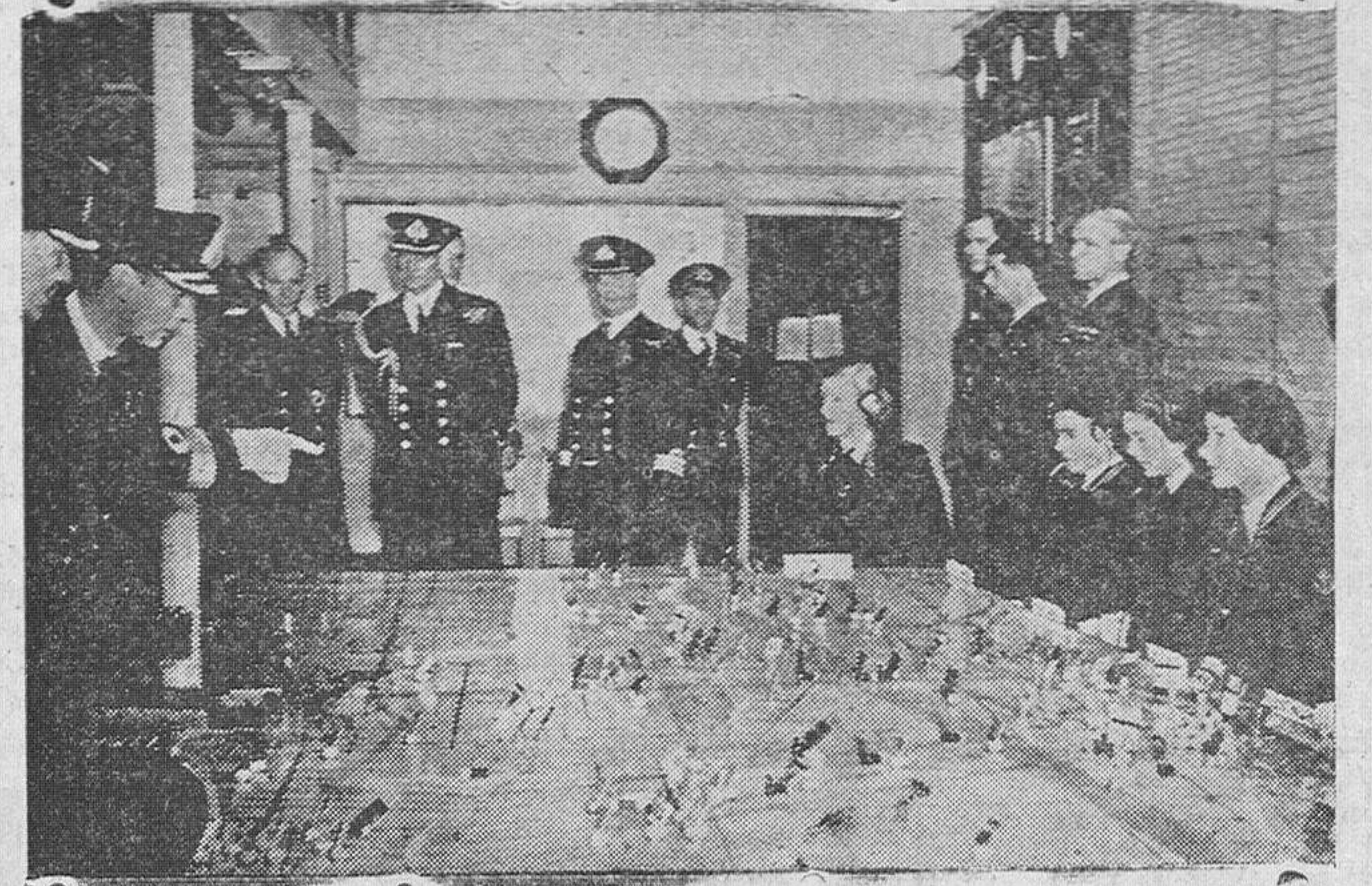
En el departamento del Alto Estado Mayor al lado en Londres, el rey Jorge VI examina los dispositivos de las operaciones en un sector del frente Occidental, reproducidos en maquetas, según las noticias recibidas a medida que se desarrolla la batalla.