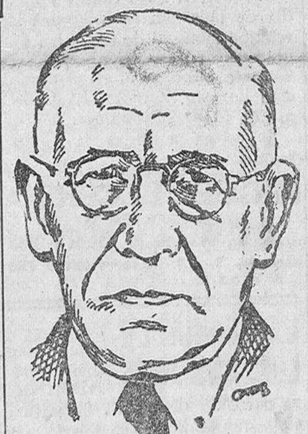
El embajador de los Estados Unidos en España.

de negociaciones que se han llevado entre ambos países durante más de un año, en un espíritu de mutua comprensión y respeto. Por el éxito alcanzado, debo expresar mi especial aprecio de la cooperación entusiasta y eficaz del llorado ministro de Asuntos Exteriores de España, conde de Jordana; de su capz sucesor, señor Lequerica; del señor Navascués y de mi propio primer secretario, señor Haehling, y, finalmente, por la interesante labor del Ministerio español del Aire. Este acuerdo es recíproco, afecta claramente al interés tanto de los Estados Unidos como de España. Crea un nuevo lazo entre España y América. Así como fué España el país que ayudó el viaje primero de las carabelas de Colón a través del Atlántico, así España ayuda ahora a realizar el viaje aéreo, más moderno y más rápido, a través del Océano. Esto será bien recibido por mi país. En tiempos pasados muchos de los norteamericanos más distinguidos visitaban Europa vía España. Más adelante, el período de las líneas de lujosos vapores, durante la última parte del siglo XIX y la primera parte del