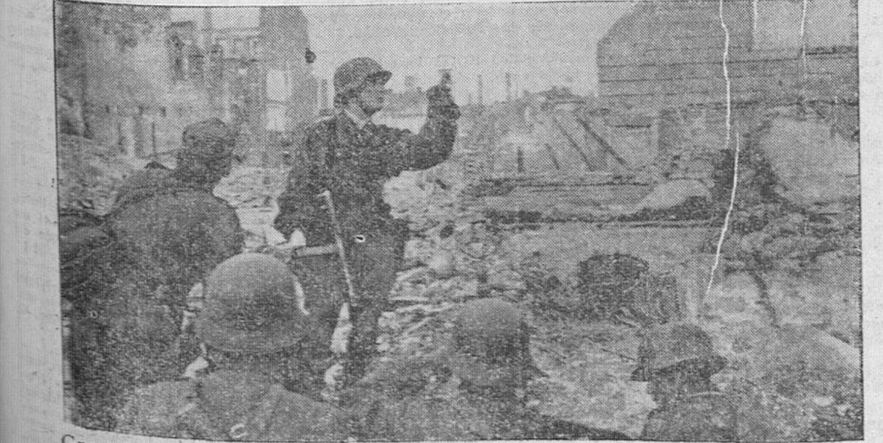
Granaderos alemanes en una ciudad belga batida por la artillería aliada, que después fué ocupada. (Orbis foto).