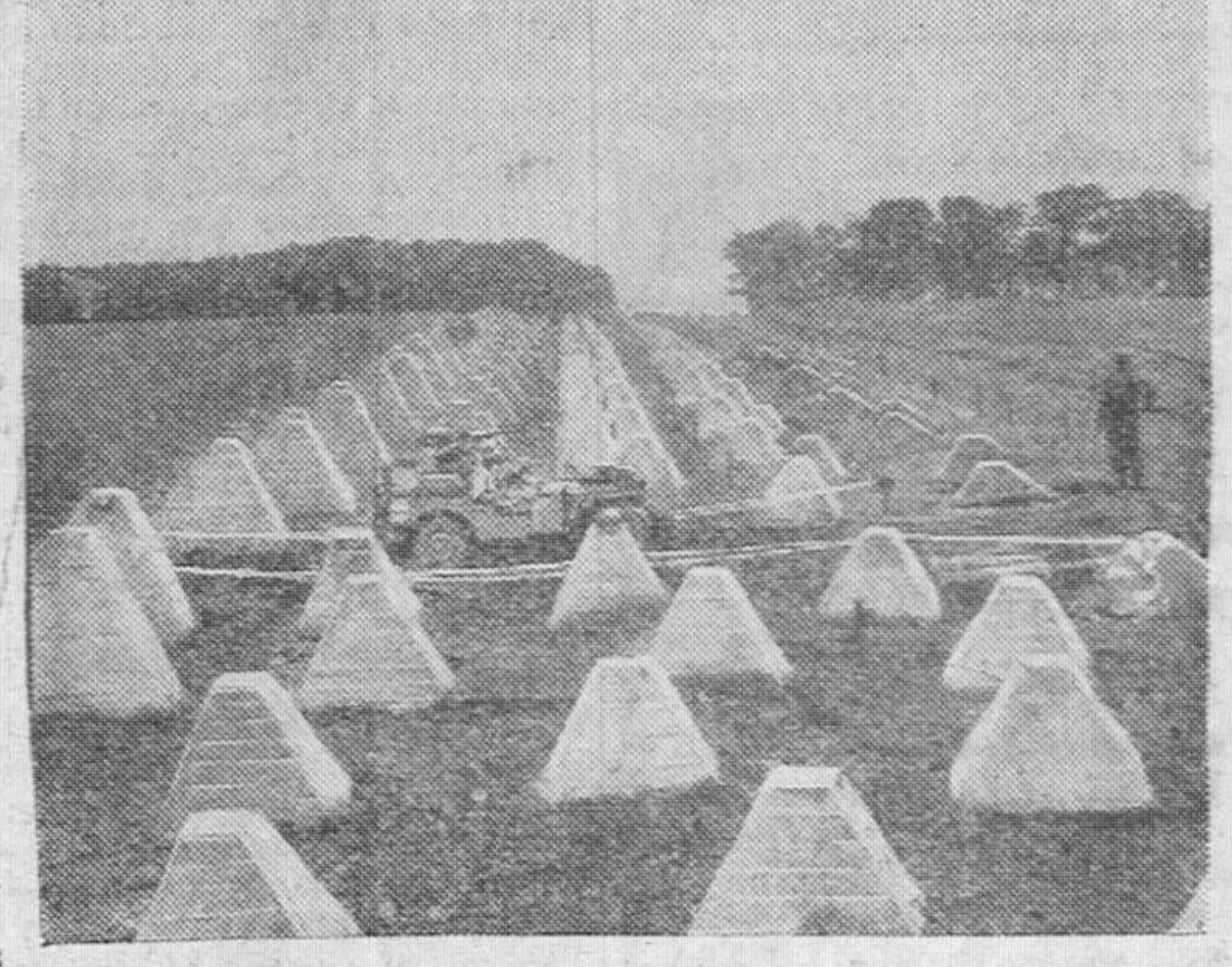
Un "Jeep" aliado pasa por los obstáculos antitanques alemanes de la Línea Sigfrido, durante el reciente avance de las tropas aliadas en territorio alemán.