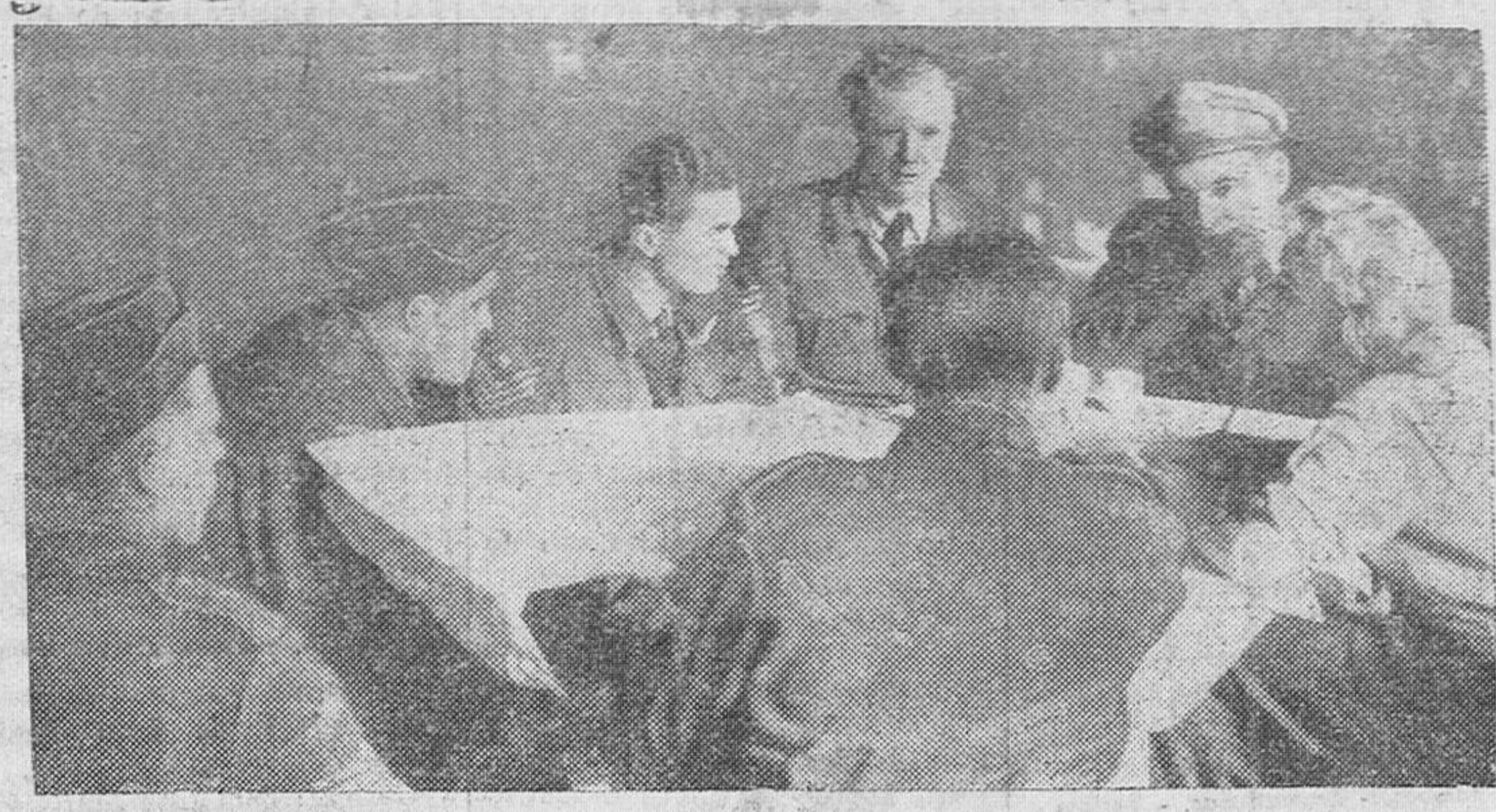
Pilotos ingleses informan a un auxiliar femenino los resultados de un raid contra los objetivos alemanes