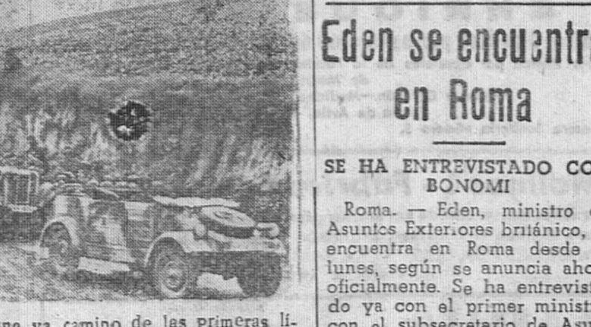
Las columnas motorizadas alemanas van camino de las primeras líneas de la frontera germano-bélgica. El desfiladero ofrece una buena protección contra la visibilidad y en previsión de un posible ataque de los aviones aliados...