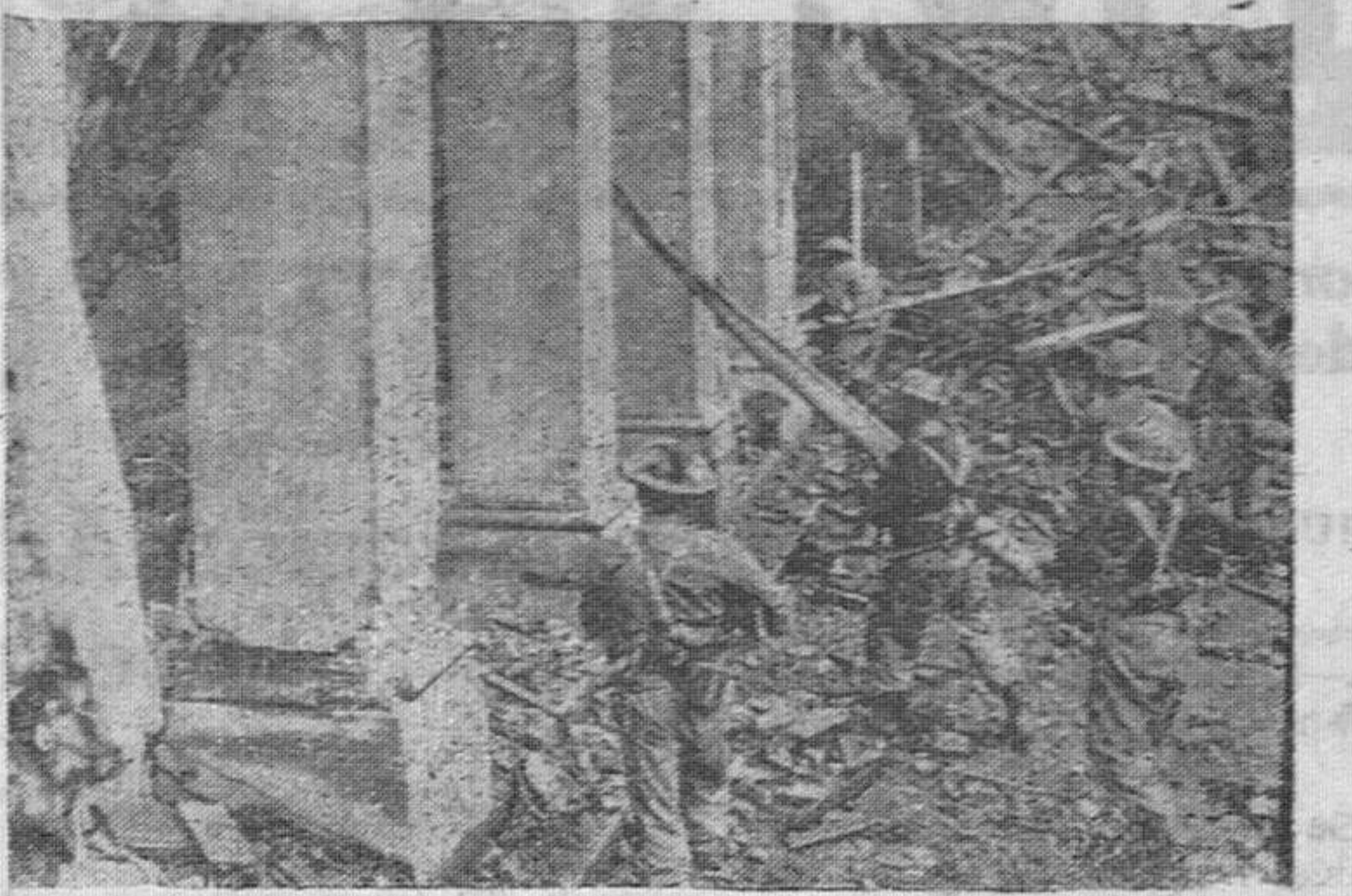
En las ruinas de la ciudad que experimentó la devastación de la guerra, entran los primeros soldados pertenecientes a un Cuerpo de Ejército británico que la conquistó