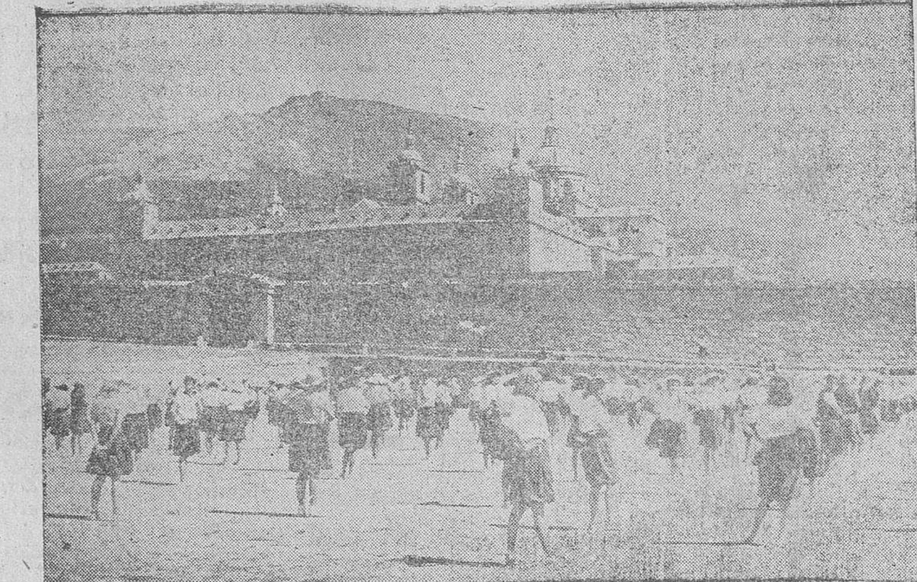
Las camaradas de la Sección Femenina que se encuentran en El Escorial, en un alto durante los ejercicios diarios de gimnasia, que realizan a la sombra del Monasterio