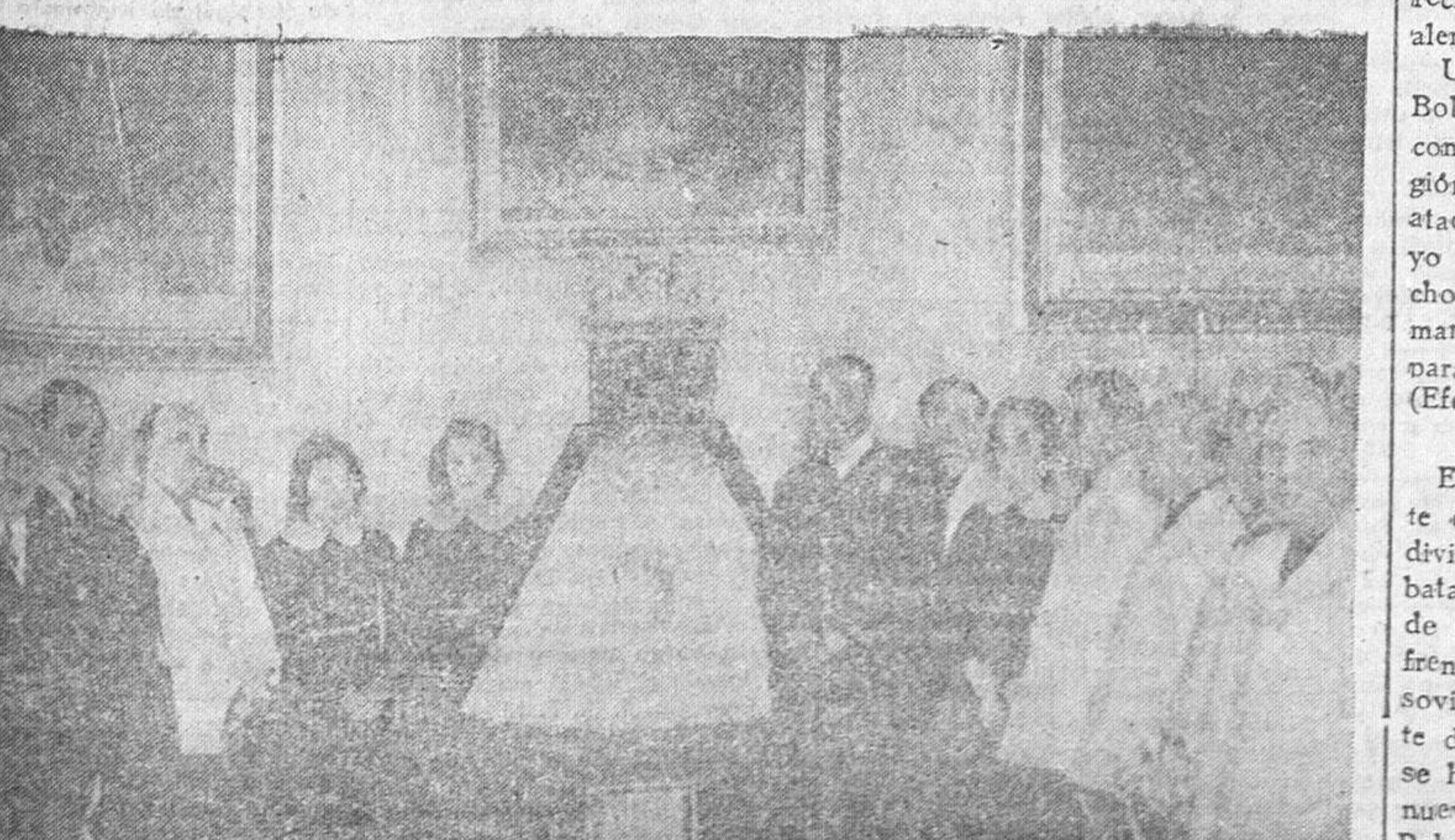
Durante la permanencia del ministro de la Gobernación en Zaragoza, las alumnas del Hogar Pignatelli, le ofrecieron un manto misional, destinado a la Virgen del Pilar, acto que recoge la fotografía