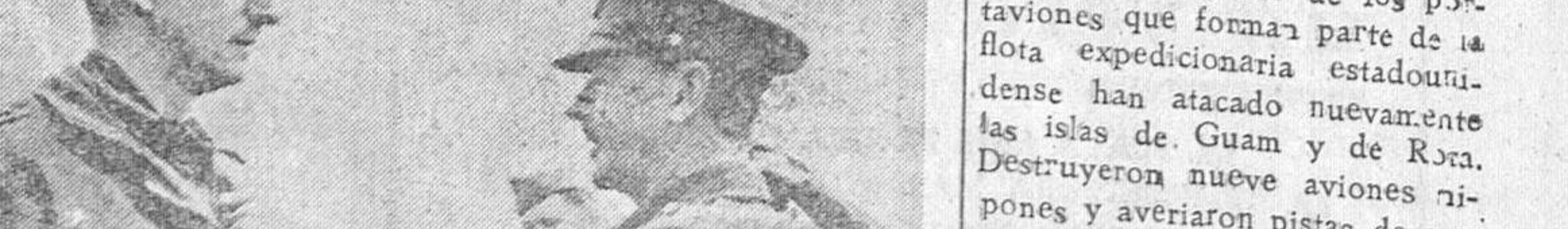
El general Alexander, jefe de las fuerzas aliadas en Italia, condecorando al general Clark, jefe del Cuerpo expedicionario norteamericano, que lucha también en el frente italiano