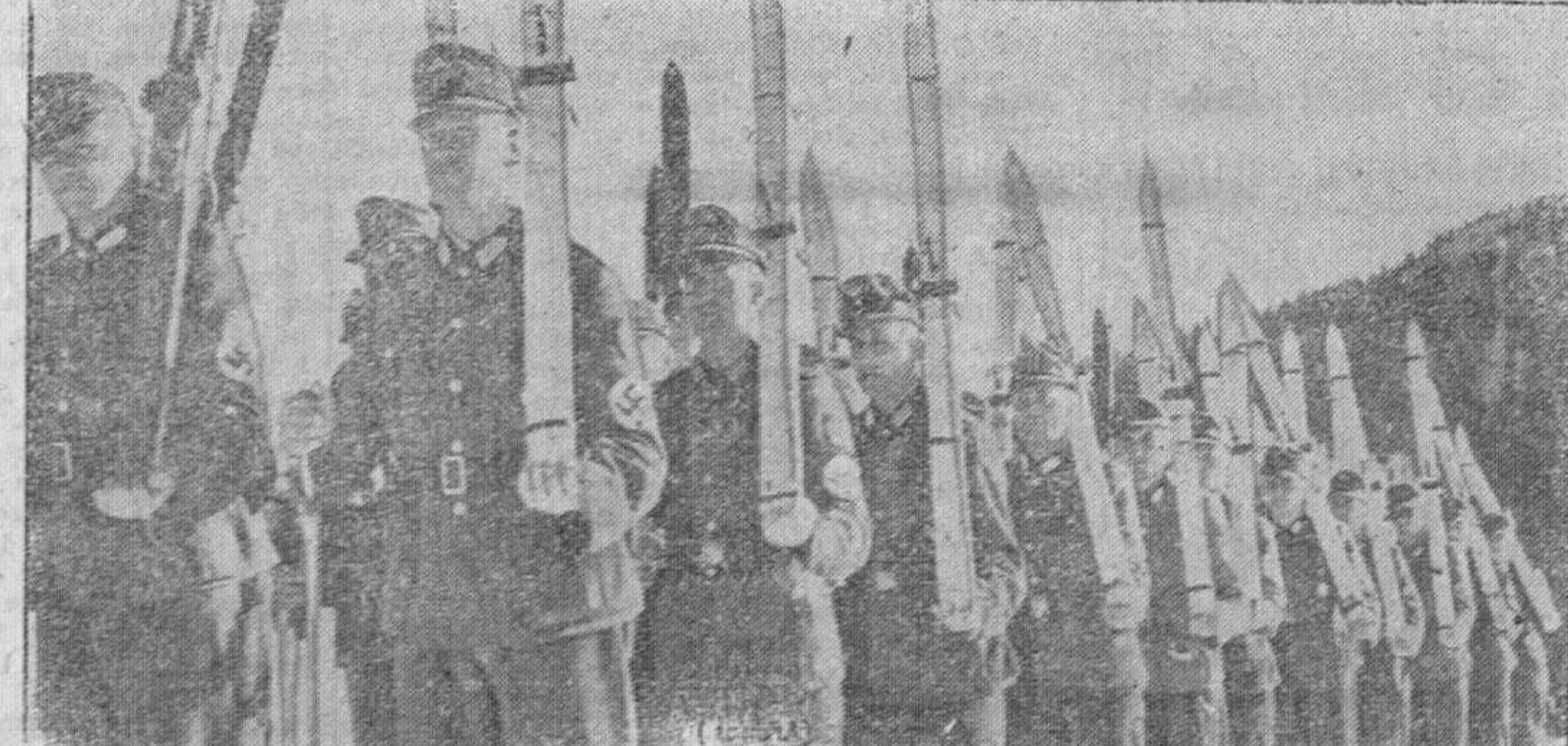
Entre todos los métodos de la instrucción premilitar de las juventudes alemanas figura con gran intensidad la práctica del esquí. He aquí los muchachos del Servicio de Trabajo en uno de los ejercicios