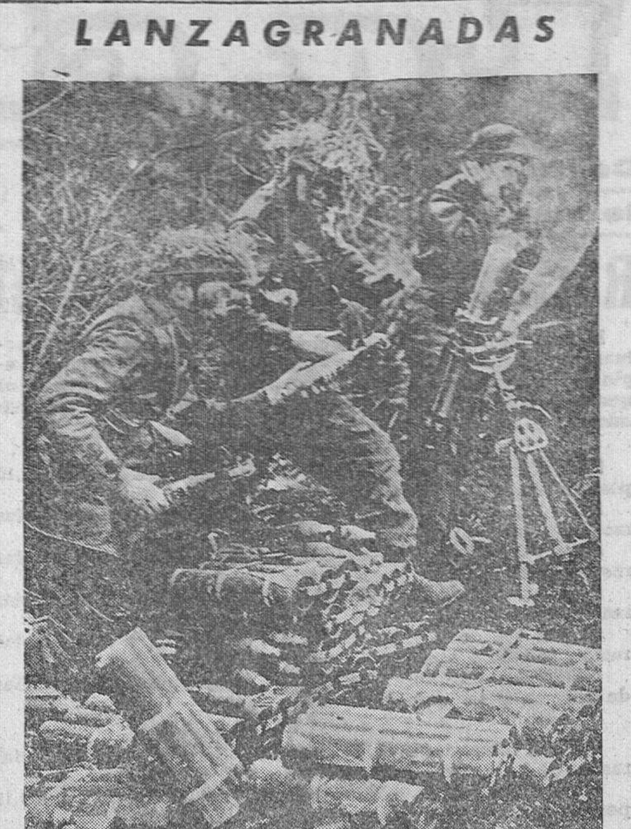
Un grupo de soldados canadienses disparando un lanzagranadas, en una de las posiciones del frente italiano