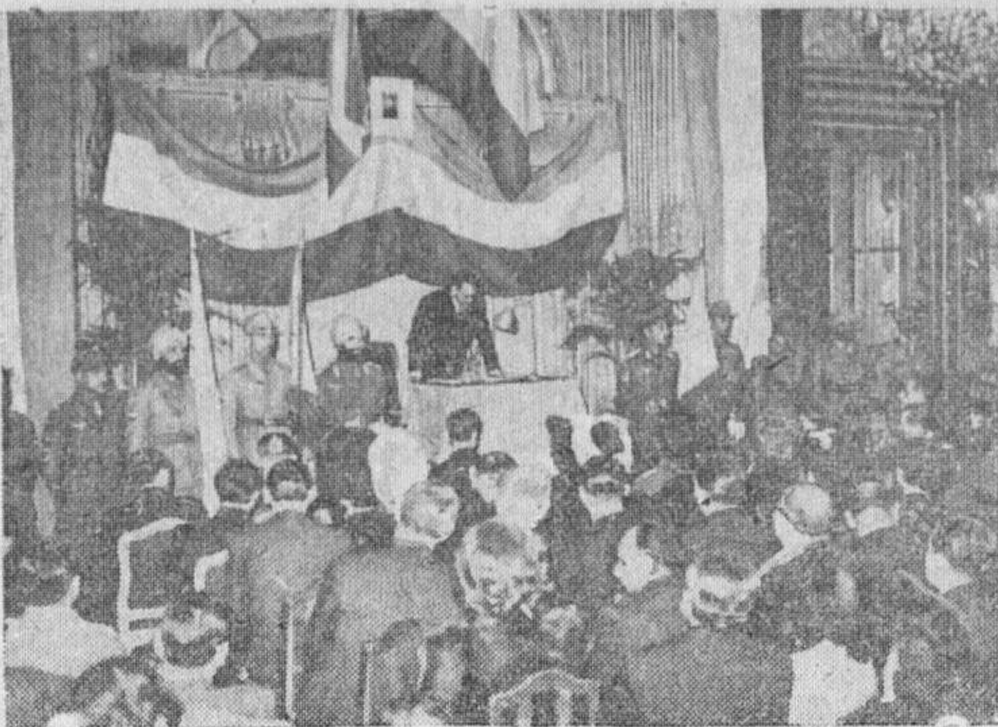
En uno de los principales hoteles de los Campos Eliseos, ha tenido lugar, recientemente, un acto "Pro India Libre", durante el cual fué leída una alocución de Chandra Bose.

Los primeros FIGURINES para la próxima temporada VEALOS EN LA LIBRERIA DE NUÑEZ RUA MAYOR, 13