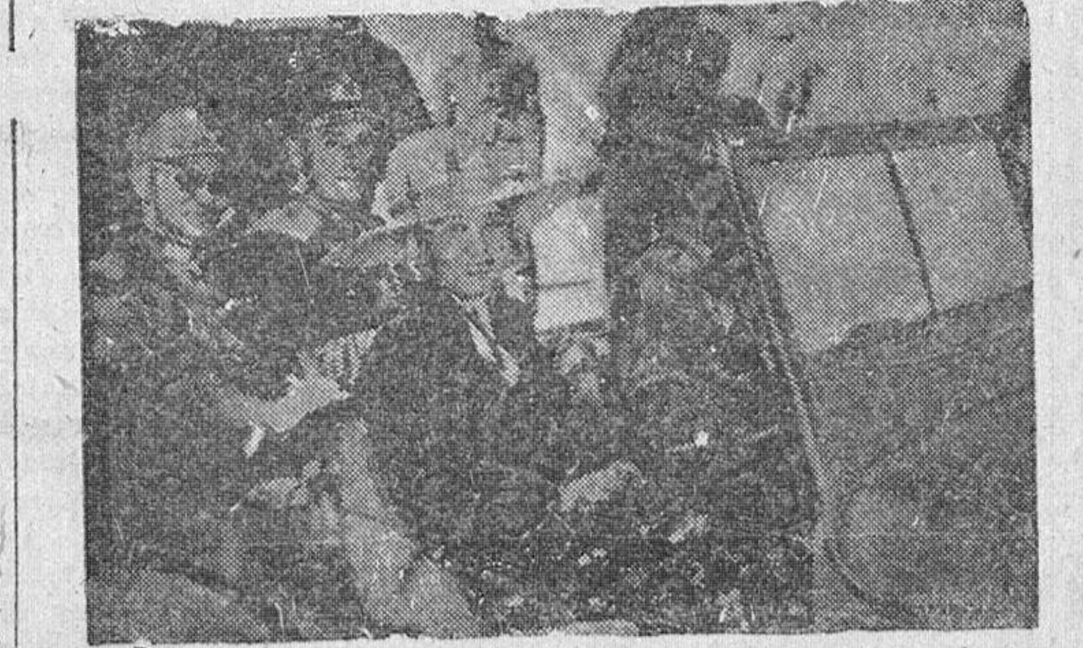
El mariscal Chiang Kai-Shek, con lord Louis Mombatten, y la esposa del Generalísimo chino, recorriendo algunas zonas del frente.

DURANTE EL MES DE FEBRERO HAN TENIDO 4.927 MUERTOS Y 2.888 PRISIONEROS Berlín.—La Oficina Internacional de Información declara que las operaciones en Yugoslavia han alcanzado buenos resultados durante el mes de febrero. Las bandas de Tito han perdido, durante el mes, 4.927 muertos comprobados y 2.888 prisioneros. Fueron capturados ocho cañones y treinta y siete vehículos motorizados. Fueron puestos en seguridad varios parques de municiones y viveres. Los contingentes de Tito han perdido, por tanto, desde el primer día de diciembre, un total de 25.615 muertos y 14.621 prisioneros. (Efe.)