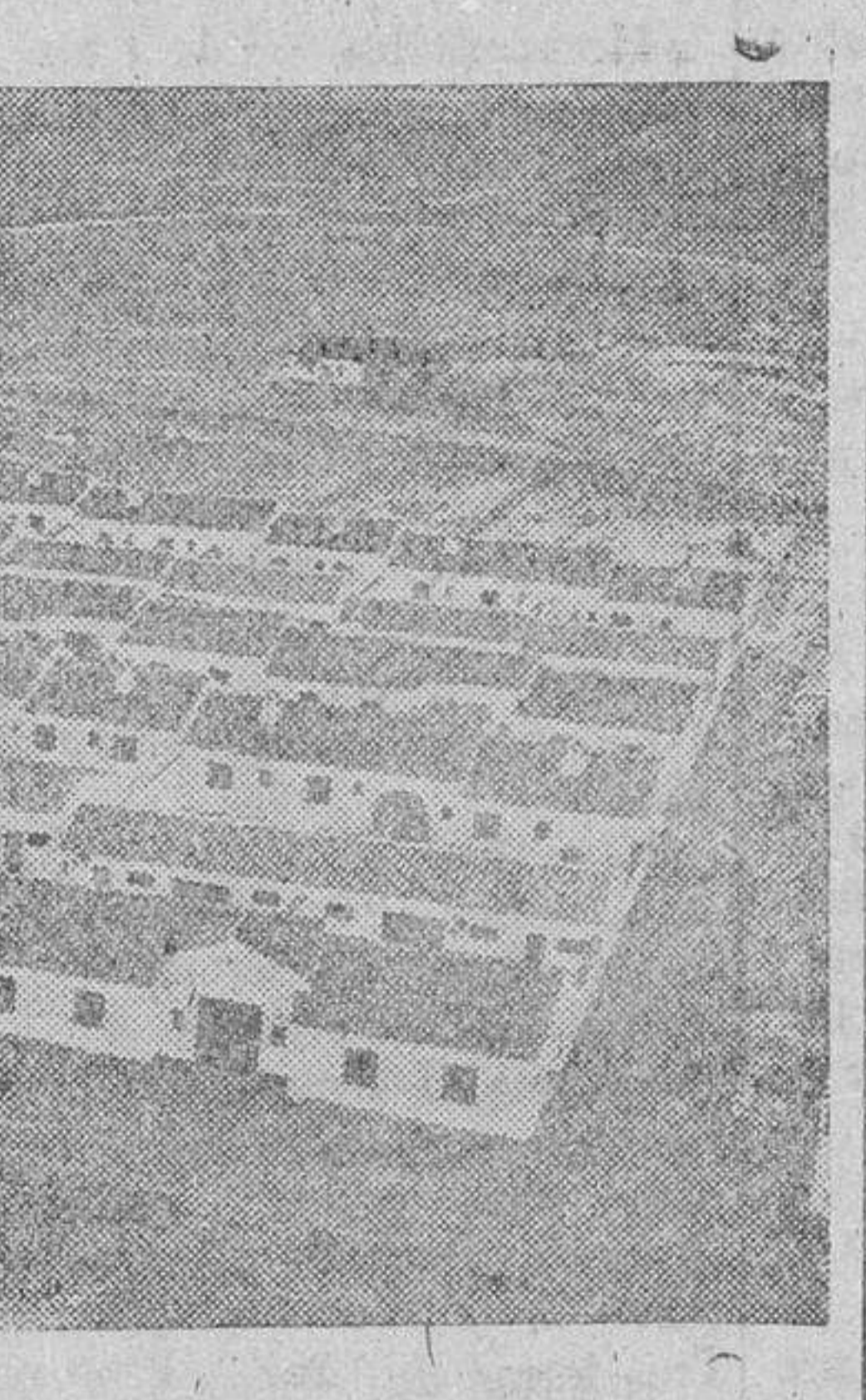
Grupo de viviendas de nueva planta construidas por la Obra Sindical del Hogar en el pueblo de Las Rozas

ciento defectuosas. Sólo, pues, había en aquella época un veinticinco por ciento del total de los hogares españoles, en perfectas condiciones de habitabilidad. A la vista de esos datos se dispuso la creación del Instituto Nacional de la Vivienda, que ha realizado ya, en colaboración estrecha con aljures y dependencias tanto del Estado como del Partido, una labor inmensa, no obstante las enormes dificultades propias de la actual situación mundial.