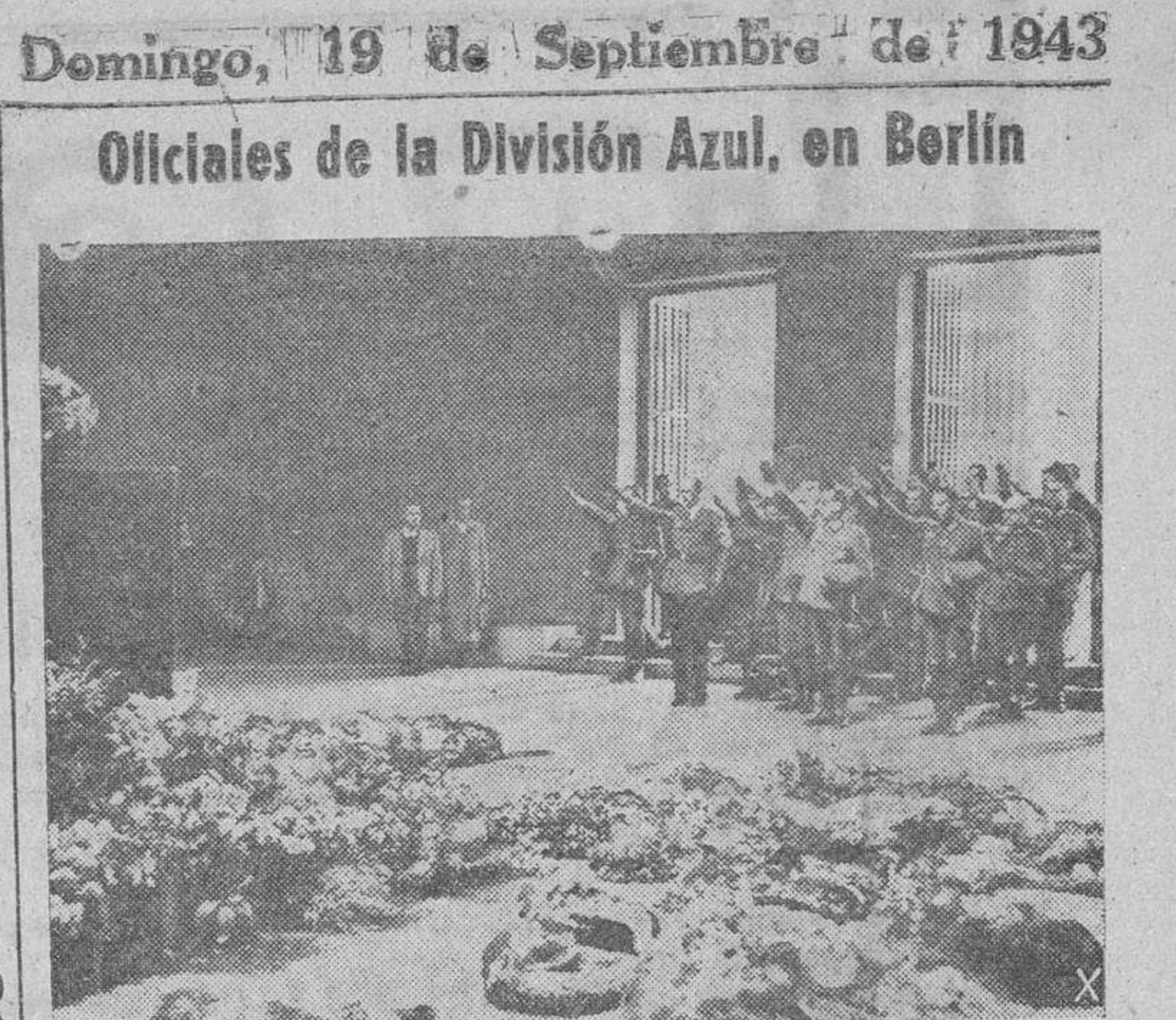
Organizado por el Partido alemán, un grupo de oficiales de la División Azul realiza un viaje de turismo por diversas ciudades alemanas. En la foto les vemos guardando un minuto de silencio ante la tumba del soldado desconocido