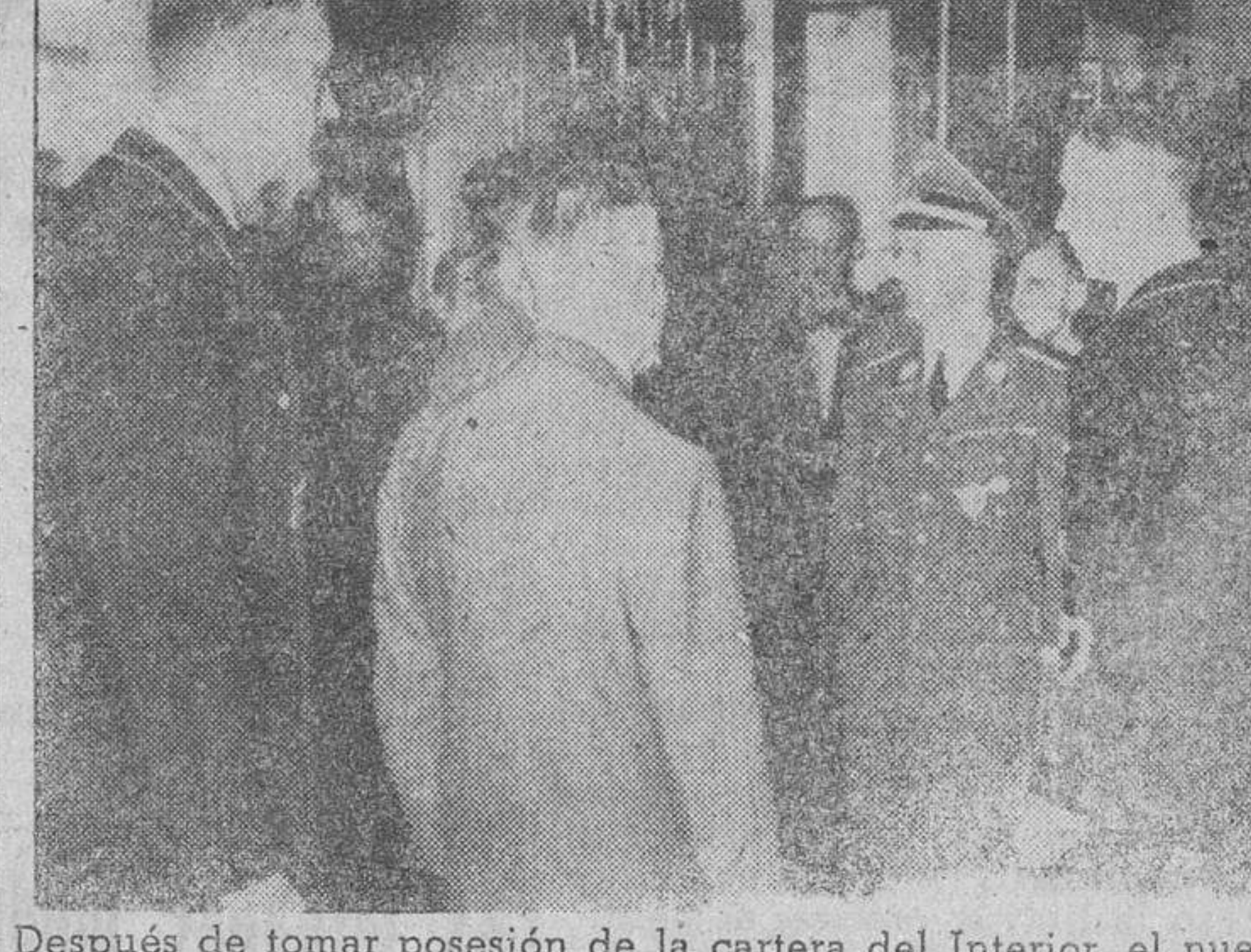
Después de tomar posesión de la cartera del Interior, el nuevo ministro, Himmler, se entrevista con sus colaboradores