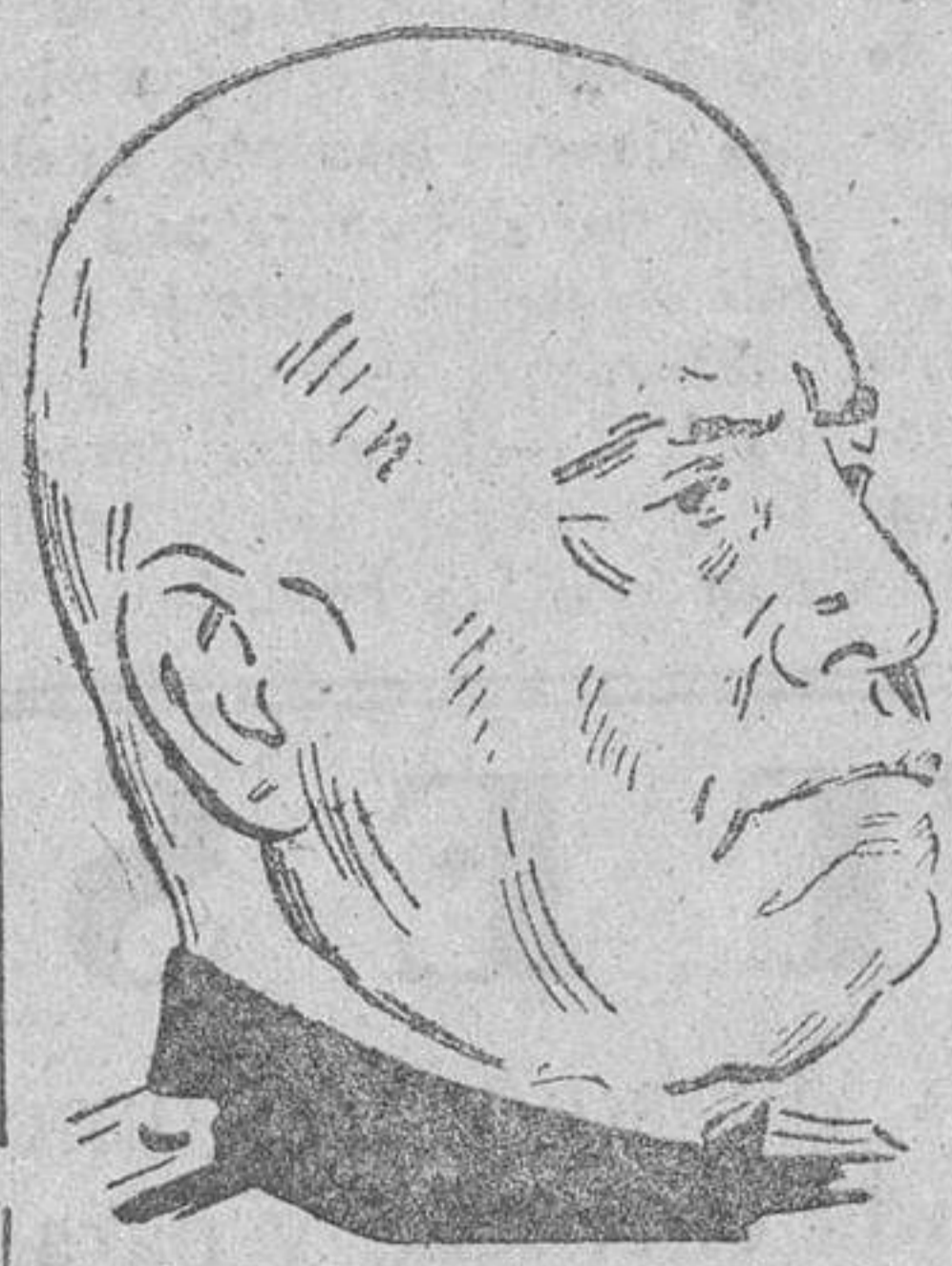
Roma.—Mussolini ha dirigido esta tarde al pueblo italiano un discurso, en el que dijo: ¡Camisetas negras! Italianos! Después de un prolongado silencio, hoy vo véis a escuchar mi voz. Estoy seguro de que la reconoceréis. Es la voz que os convocó tantas veces en los mo-

ADMINISTRACION: TELEFONO 1018 RUA MAYOR, 13.—APARTADO 10