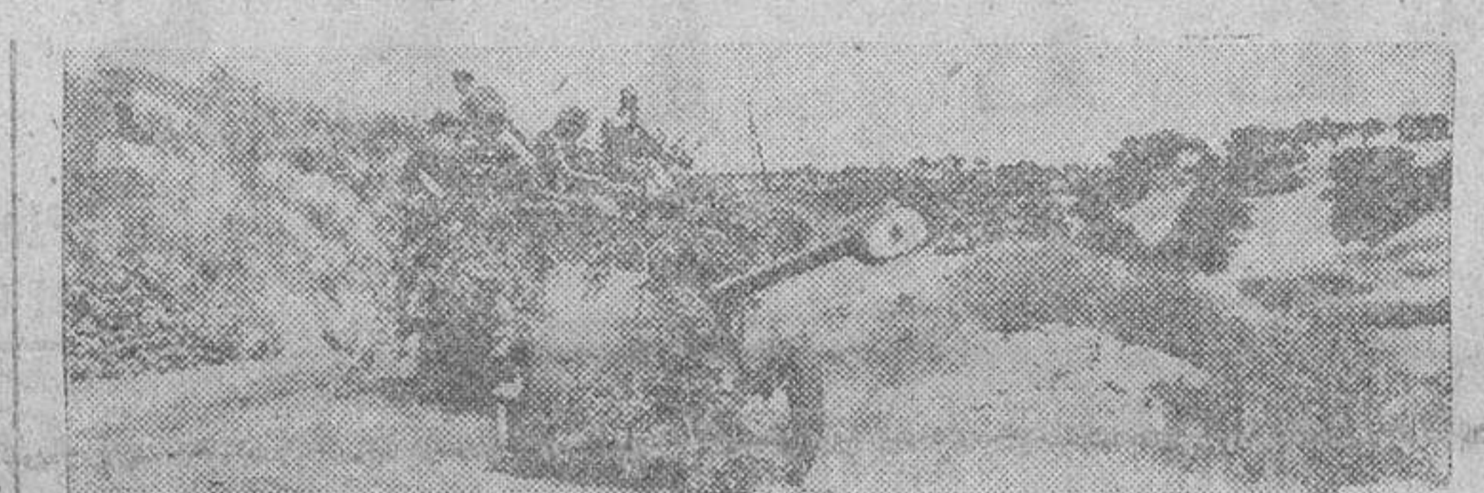
Cañón antiaéreo alemán trasladado rápidamente a nuevo emplazamiento del frente ruso.

En el sector de Udai, donde los bolcheviques lanzaron potentes fuerzas durante la jornada, los alemanes contraatacaron vio-