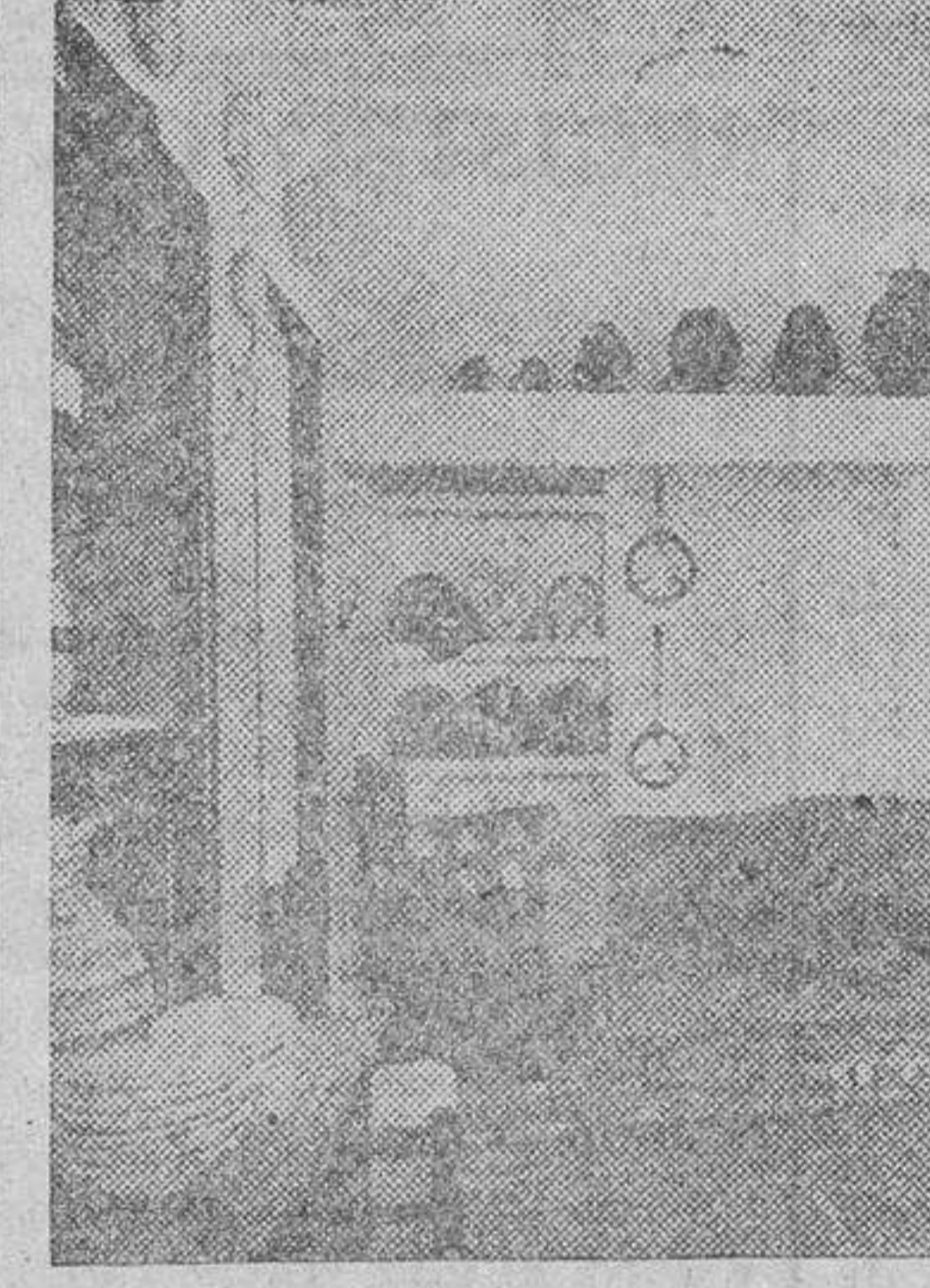
Interior de las viviendas protegidas para familias modestas, con los enseres adquiridos y cedidos por la Obra Sindical del Aljures

otorgarles directamente aquellos beneficios a que nos referimos. Es decir, que con una aportación inicial mínima de un diez por ciento, el Instituto les concede en cada caso un anticipo, sin