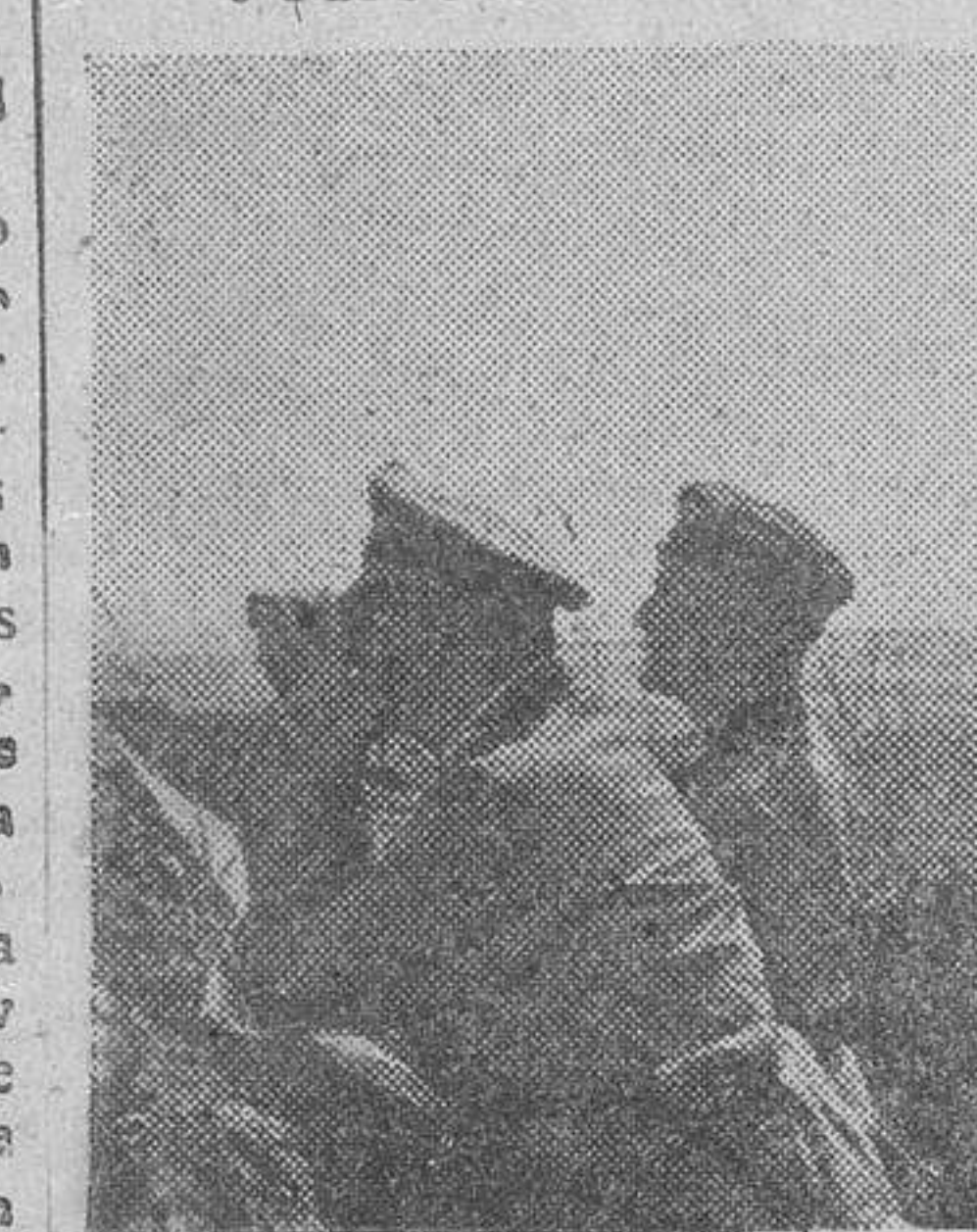
El jefe de un sector alemán, en el frente ruso, presenciando las operaciones.