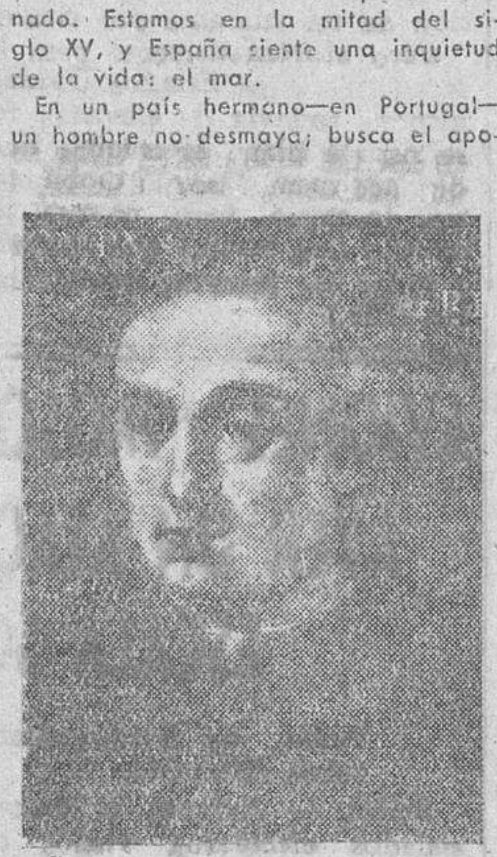
La Historia marca un tiempo determinado. Estamos en la mitad del siglo XV, y España siente una inquietud de la vida: el mar.

La mejor lección de nuestro más glorioso pasado Por ALBATROS