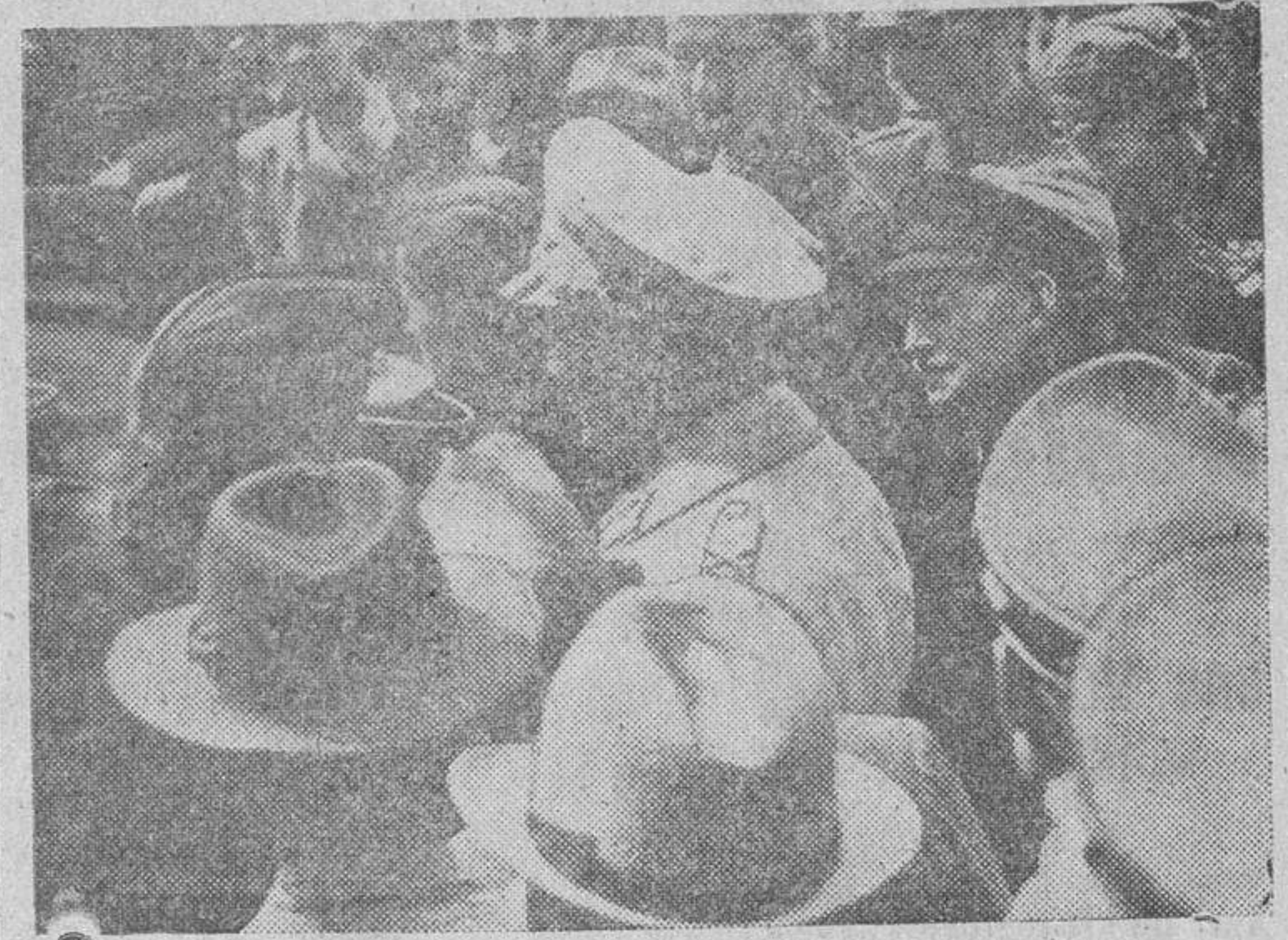
Después de haber visitado los lugares damnificados por la aviación anglo-americana sobre la bella ciudad alemana, el mariscal Goering asiste al reparto de alimentos a las personas que quedaron sin hogar