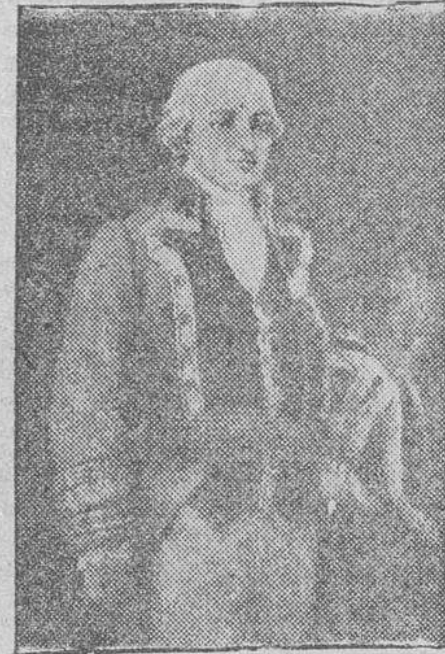
SANTIAGO DE LINIERS Y DE BREMOND