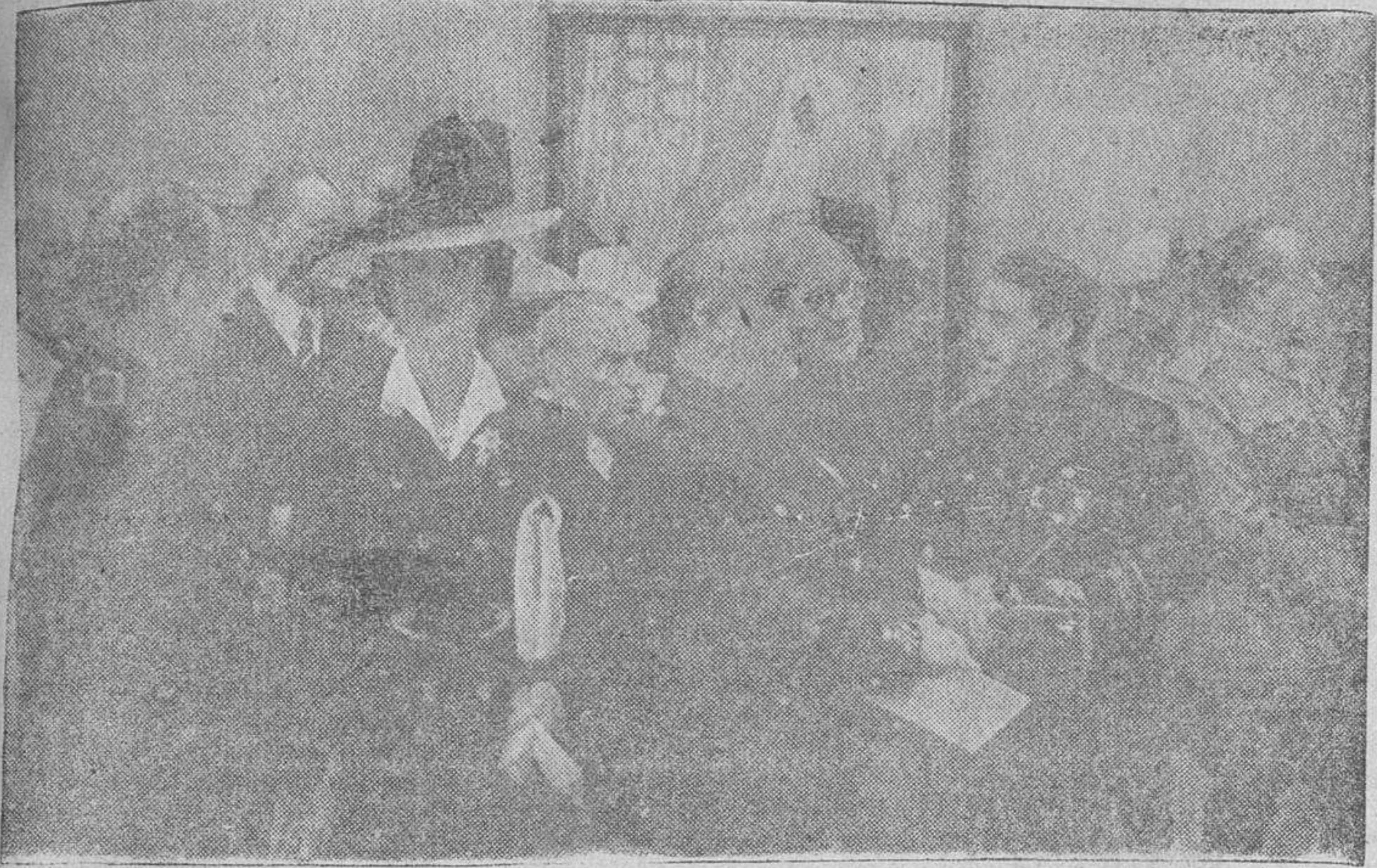
S. E. el jefe del Estado visitando, en unión de su esposa, de los ministros secretario y de Educación Nacional y del marqués de Lozoya, la Exposición Nacional de Bellas Artes.