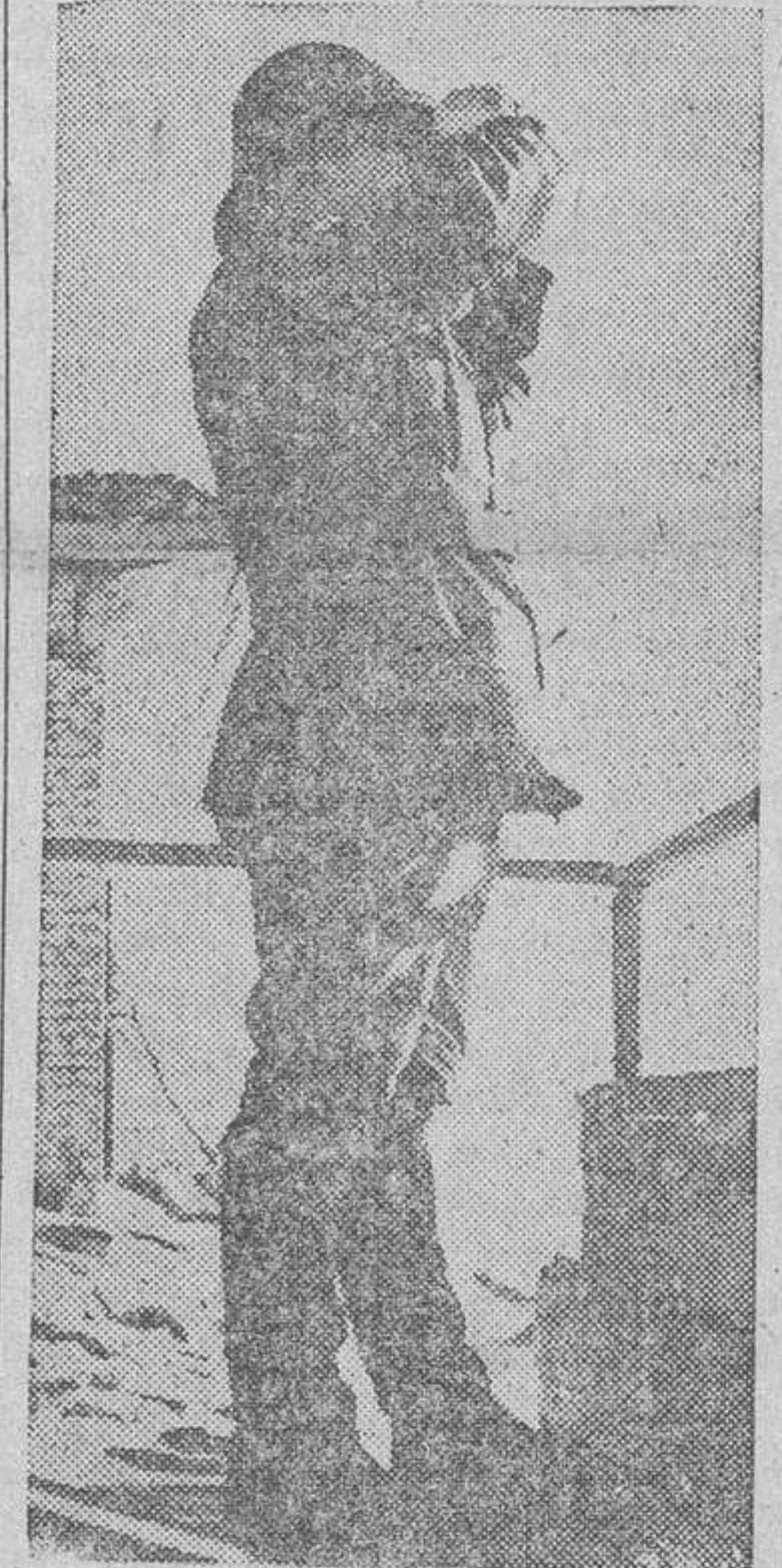
Centinela rumano examina minuciosamente el horizonte.