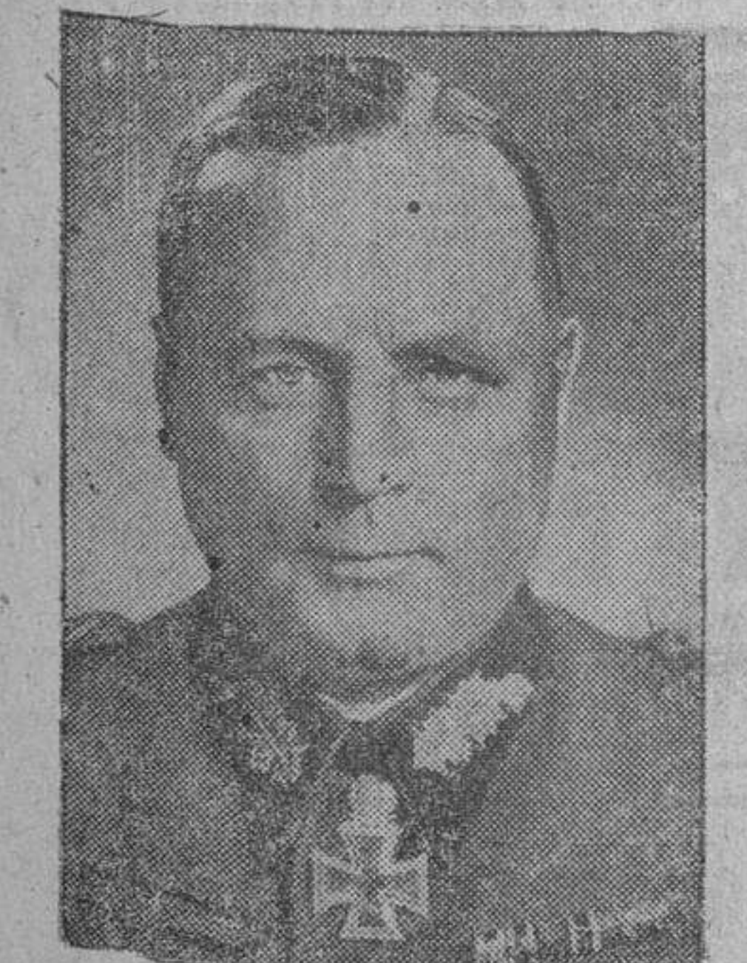
El general alemán Hans Huba, que ha sido decorado por el Führer con las Hojas de Roble con Espadas para la Cruz de Caballero de la Cruz de Honor.

Desprevenidos por el ataque Berlín.—El ataque de los aviones rápidos alemanes contra Londres efectuado al mediodía de ayer—declara la Agencia DNB—sorprendió de tal manera a la defensa británica, que todos los aparatos lograron lanzar su carga sin encontrar oposición. En el momento del bombardeo solamente una batería entró en acción, en tanto que los cazas ingleses, no hacían su aparición sino cuando los bombarderos del Reich emprendían el vuelo de regreso.