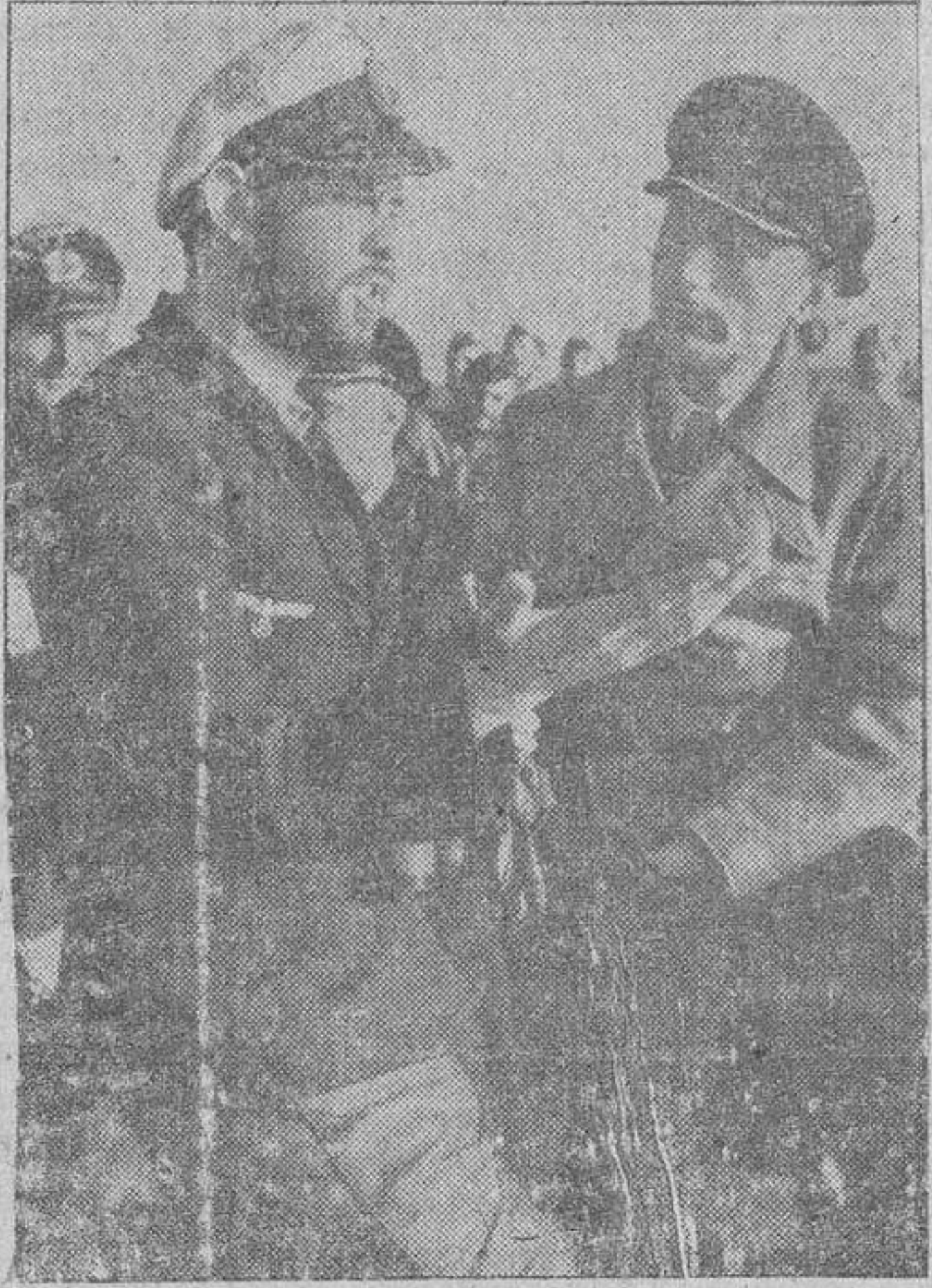
A la vuelta del victorioso cruceiro, el comandante de un submarino alemán cuenta a un camarada las principales peripecias de la travesía

En varios puntos han sido destruidas y rechazadas las fuerzas soviéticas. Al sur del frente y en el Don central, poderosas formaciones aéreas alemanas y aviones rumanos intervinieron con éxito el 20 de enero en los combates por el río. A pesar de las desfavorables condiciones atmosféricas, fueron dispersadas y destruidas grandes concentraciones de tropas soviéticas e incendiados grandes depósitos. Las bombas destruyeron, además, trece vagones blindados bolcheviques. (Efe.)