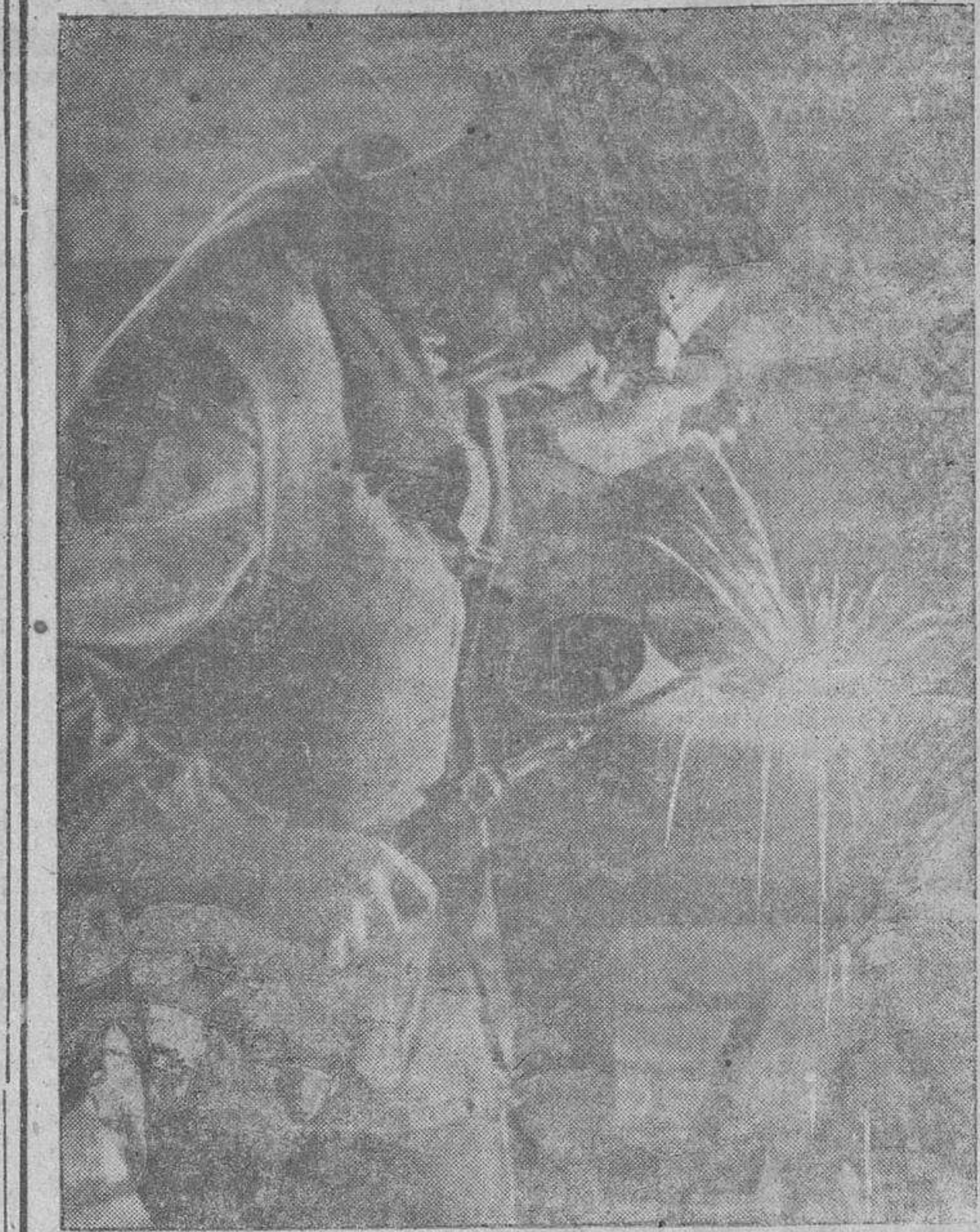
He aquí un soldado especialista de una fábrica de guerra del Reich, durante su trabajo