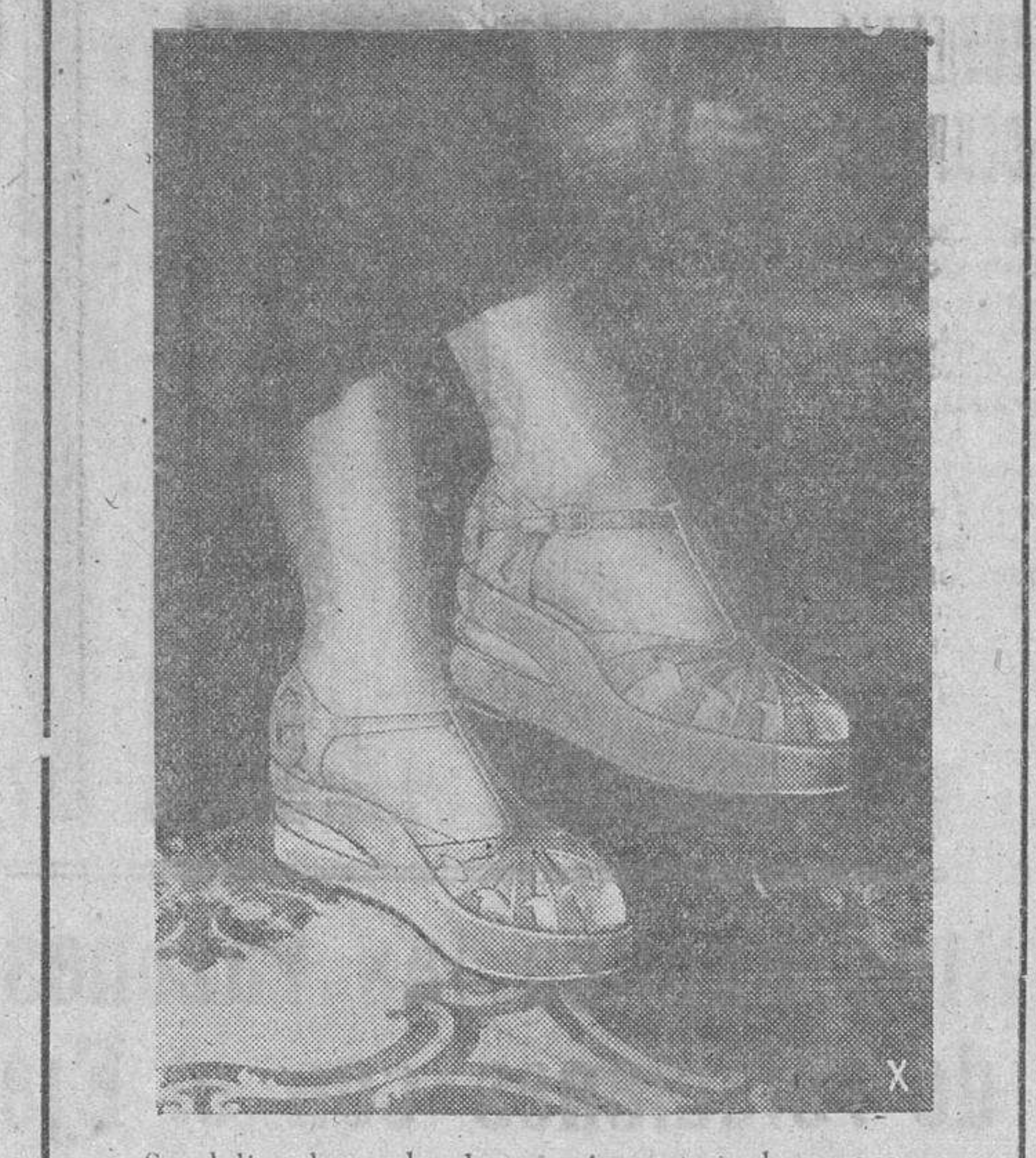
Sandalias de noche de créspon mate, color negro, con adornos dorados