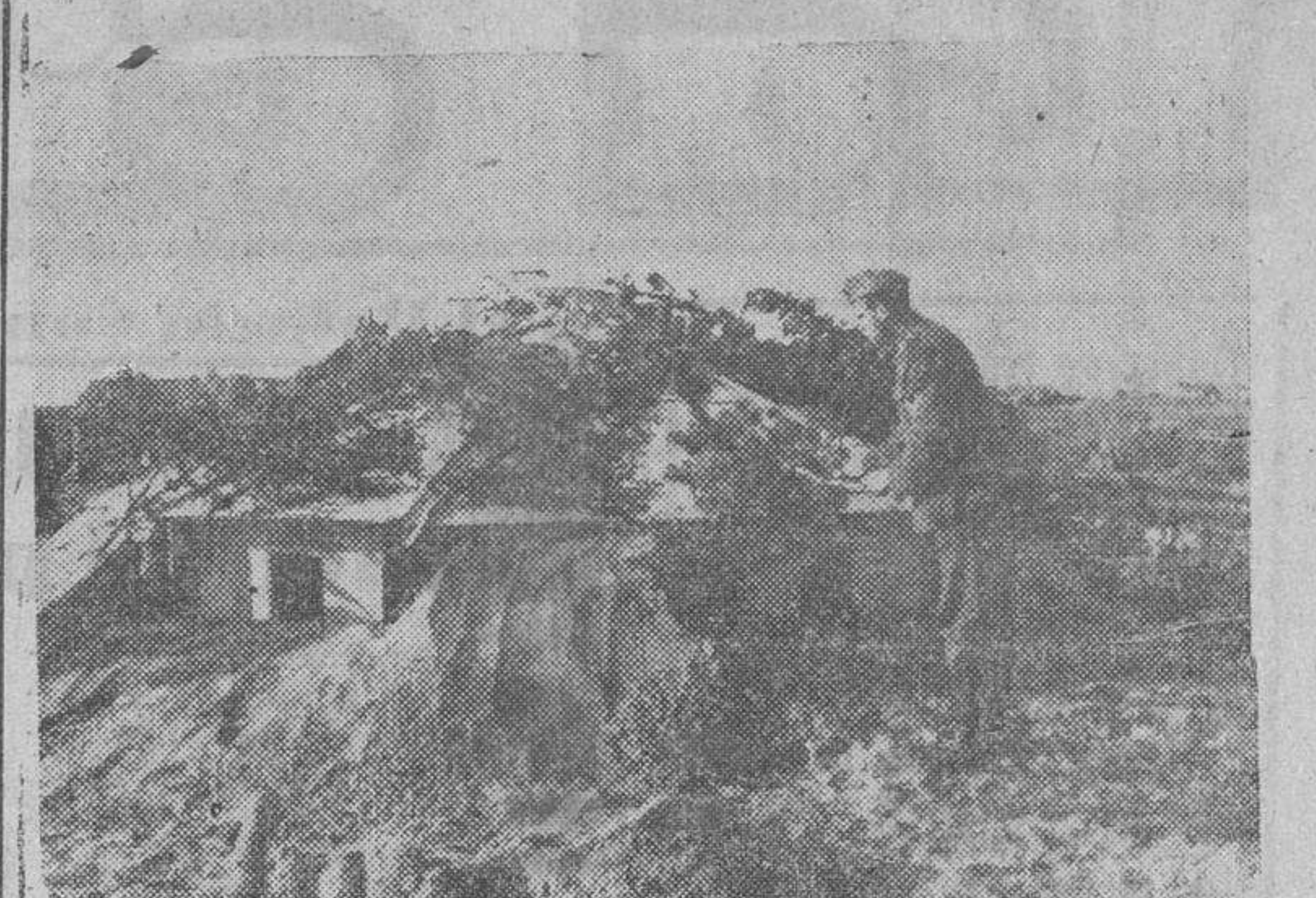
Los soldados finlandeses, en el frente del lago Ladoga, cuentan con refugios construidos en la tierra misma, a fin de despistar a los aviones.