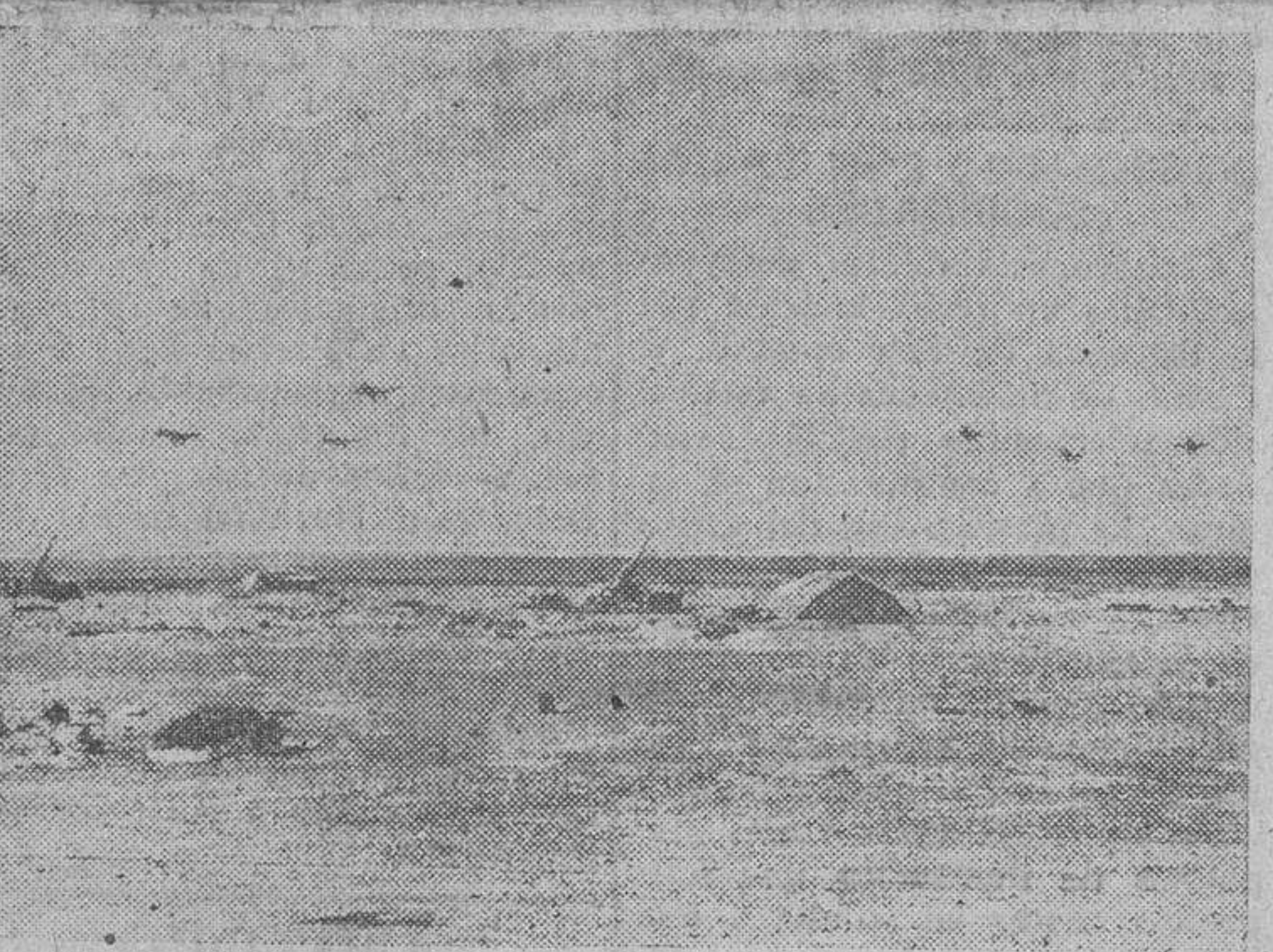
En pleno desierto de África del Norte se ha establecido un aeródromo, debidamente protegido por la DCA alemana.