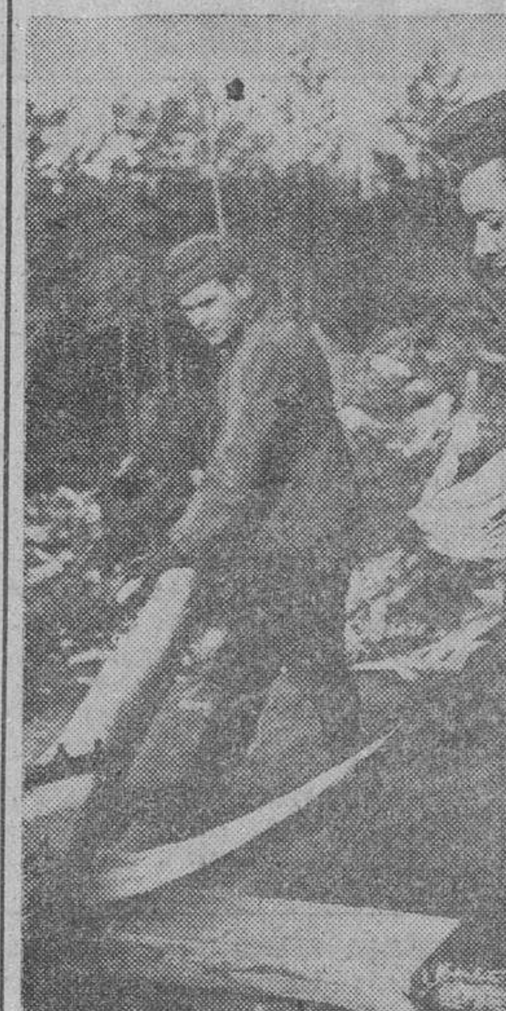
Soldados alemanes trabajando en la corta de viguería que ha de servir para la construcción de abrigos.