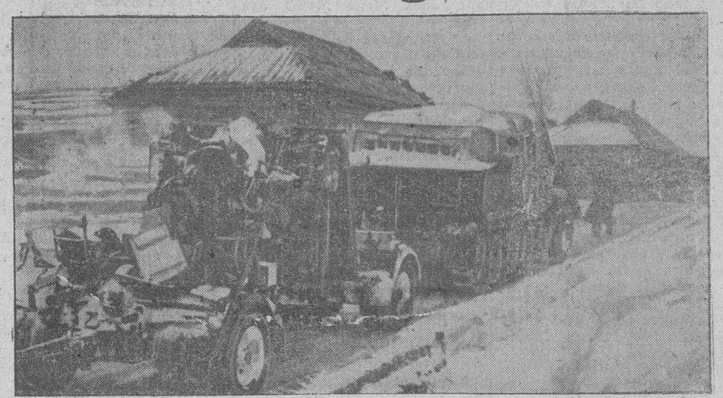
Material, unas veces utilizable y otras completamente destruido, como botín, capturado por las tropas alemanas a los ejércitos soviéticos.