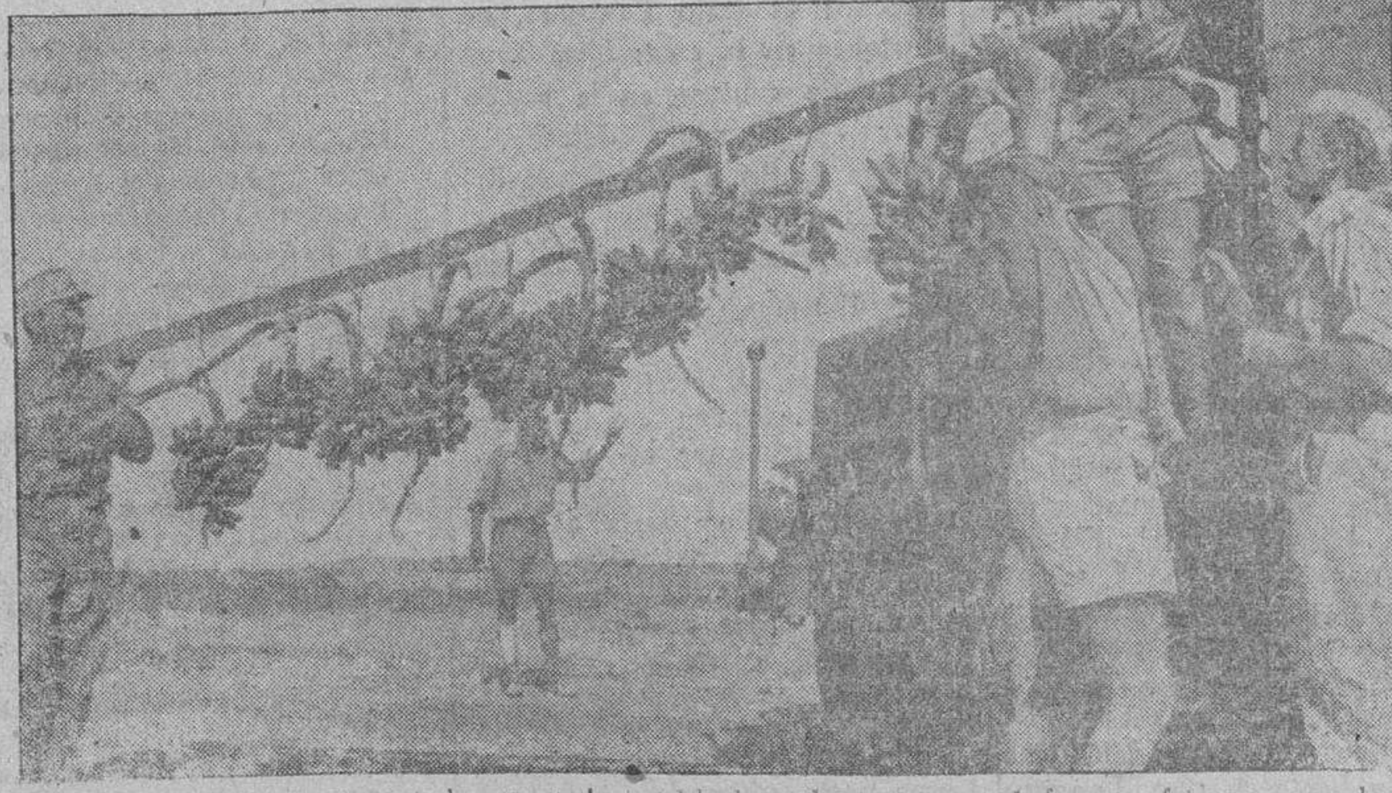
Los plátanos son transportados para los soldados alemanes en el frente africano, que luchan en primera línea, y que constituye un excelente alimento.