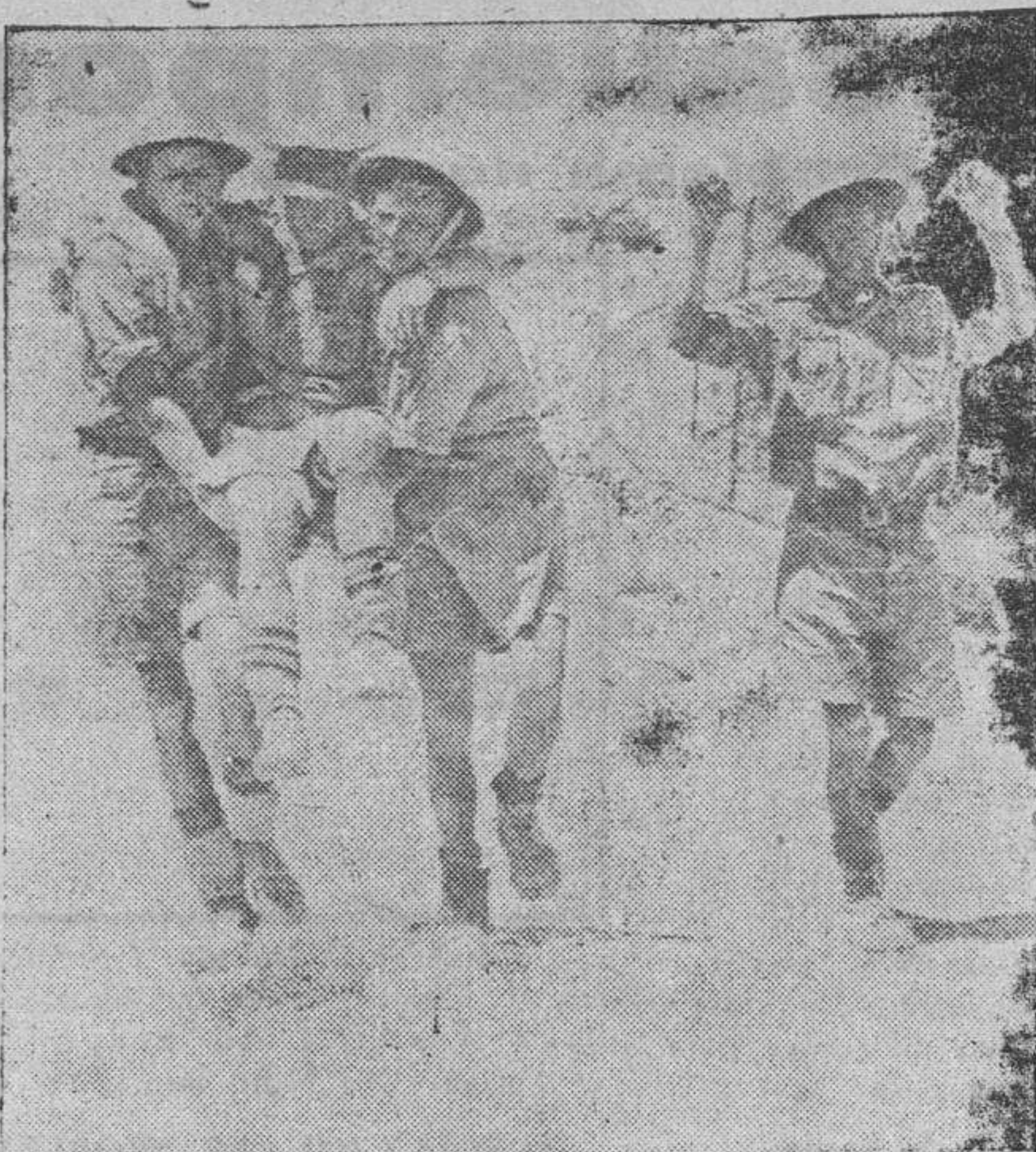
Las tripulaciones británicas abandonan los tanques ingleses y yanquis incendiados y se entregan a los alemanes. Este oficial es transportado por los Tommys a las líneas alemanas

Comunicación británica. El Cairo.—Comunicado del Cuartel General británico del Oriente Medio: "Durante la noche del 27 al 28 de agosto, nuestras patrullas..."