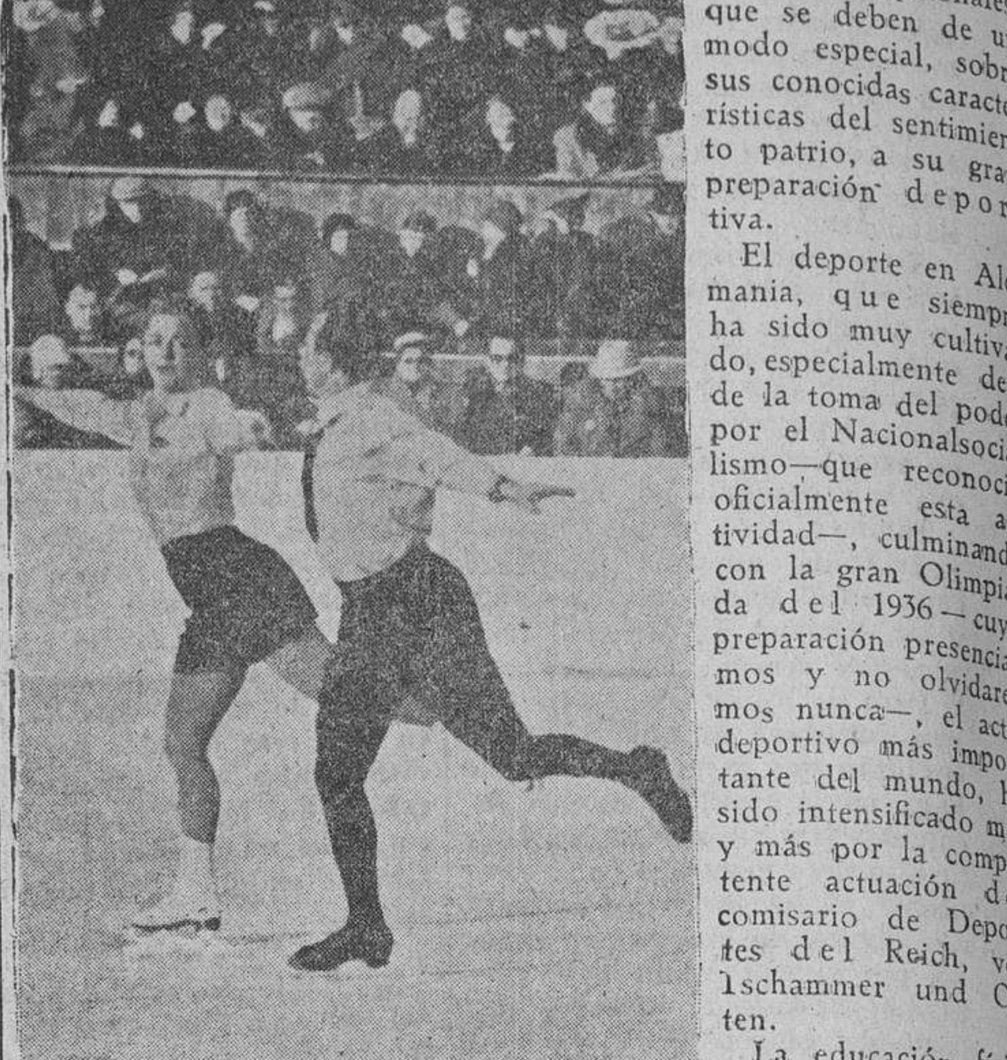
Los campeones mundiales de patín, Maxie y Ernest Bajer, en sus interesantes demostraciones sobre la pista de hielo.