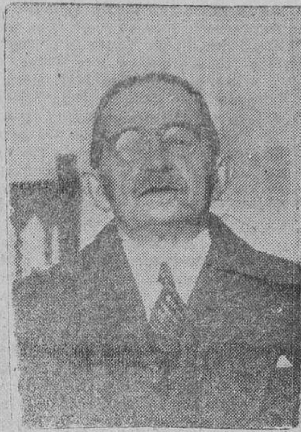
Cannes.—Ha fallecido en Cannes, durante la noche última, el exministro de Negocios Extranjeros de Grecia y exministro plenipotenciario en París, Nicolas Politis. El difunto político griego residió desde hacía tiempo en Francia, donde tenía numerosas amistades. (Efe.)