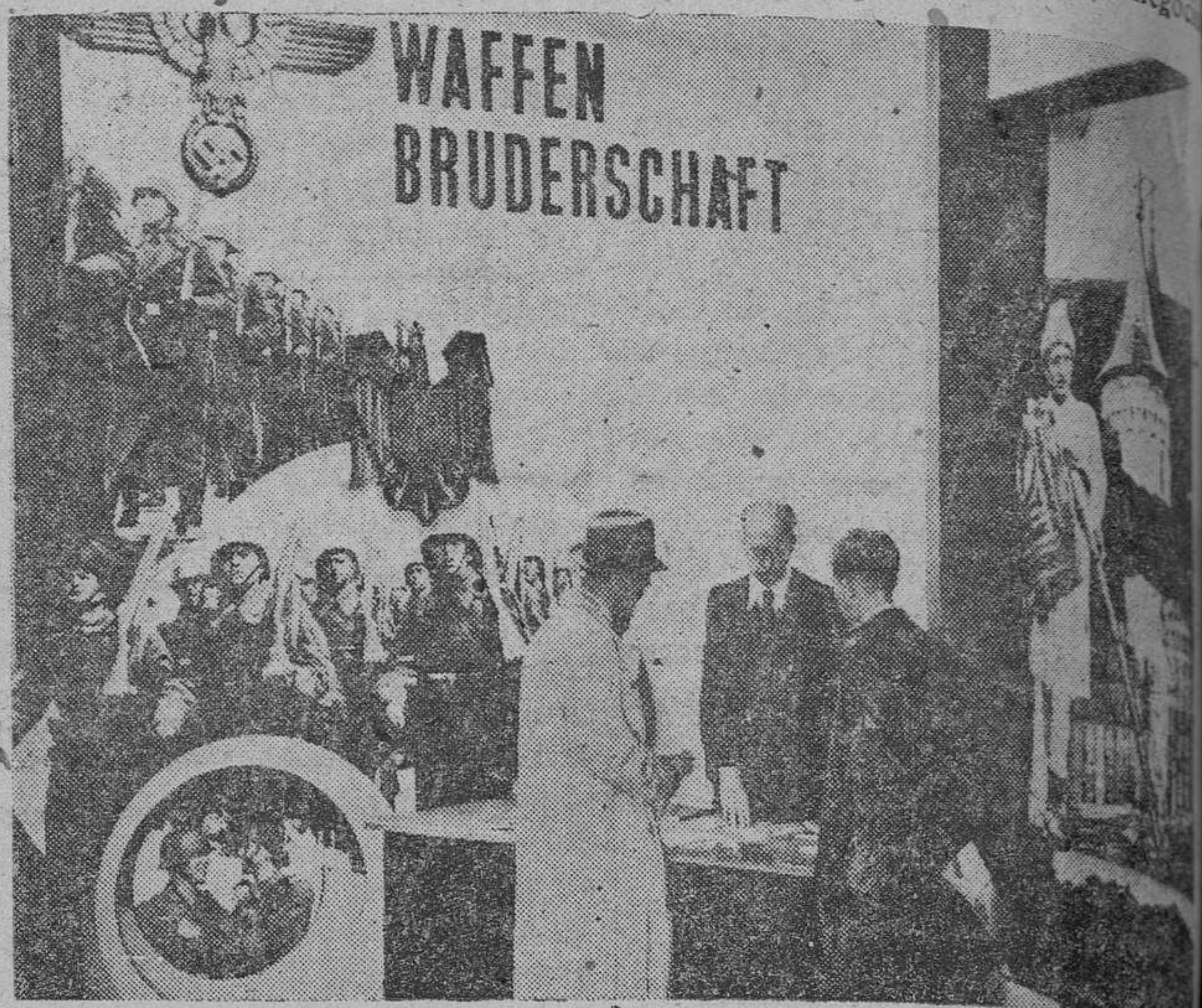
Rumania pone en su stand de la Feria de Leipzig en relieve la hermandad de armas de los dos países, Alemania y Rumania, en la presente guerra

No obstante, aún presenta algunas novedades y maravillas de industria, que hacen de los cuatro grandes edificios en que está instalada, un lugar inolvidable para los hombres de negocio.