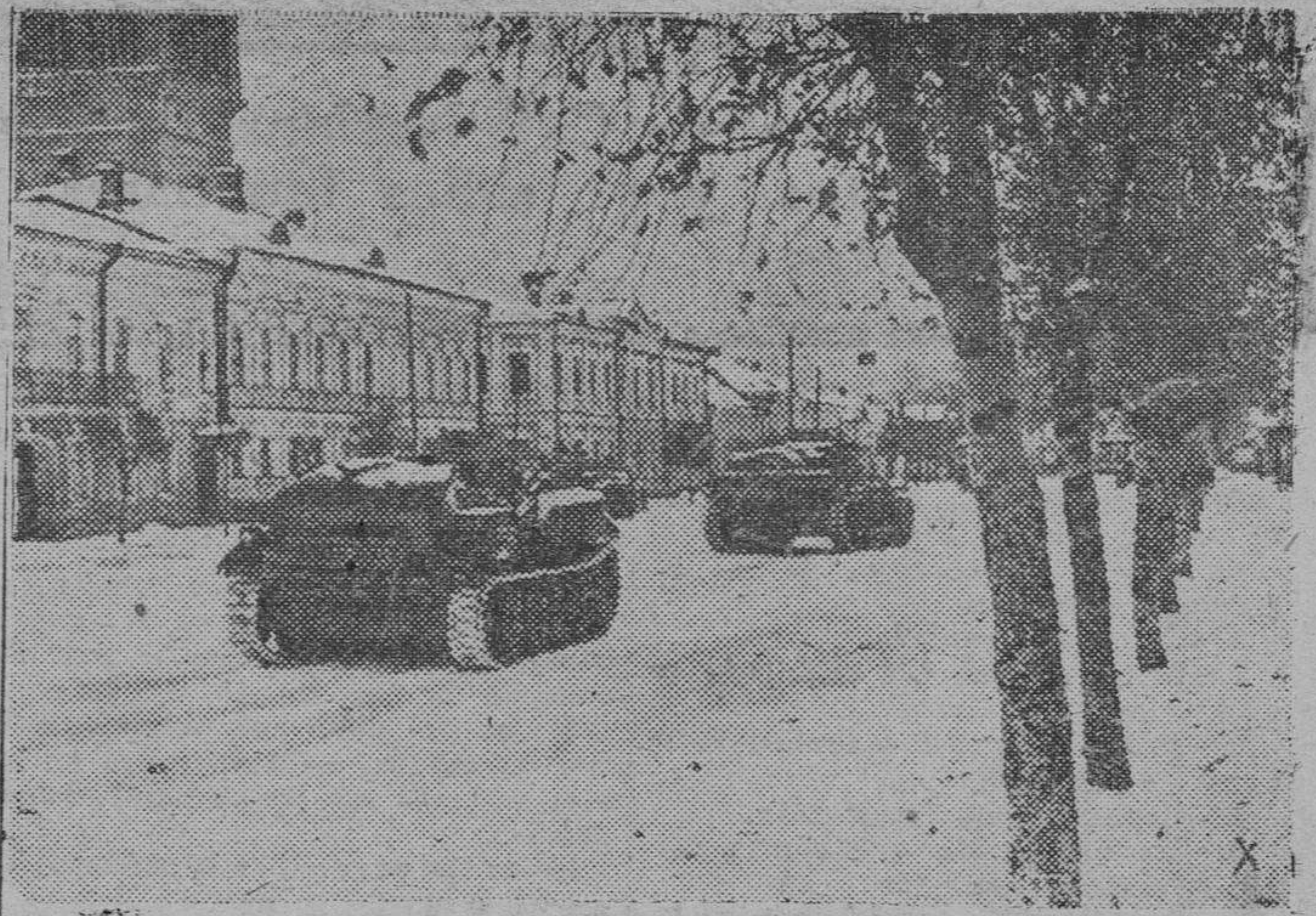
Tanques alemanes pasan por una calle de Kalinin, que ya ha sido dejada bastante atrás por las vanguardias alemanas

Londres.—Gran número de aviones enviados por los Estados Unidos, actúan ya en el Oriente Medio, según ha declarado el Mayor General Brett, jefe del Aéreo Norteamericano.