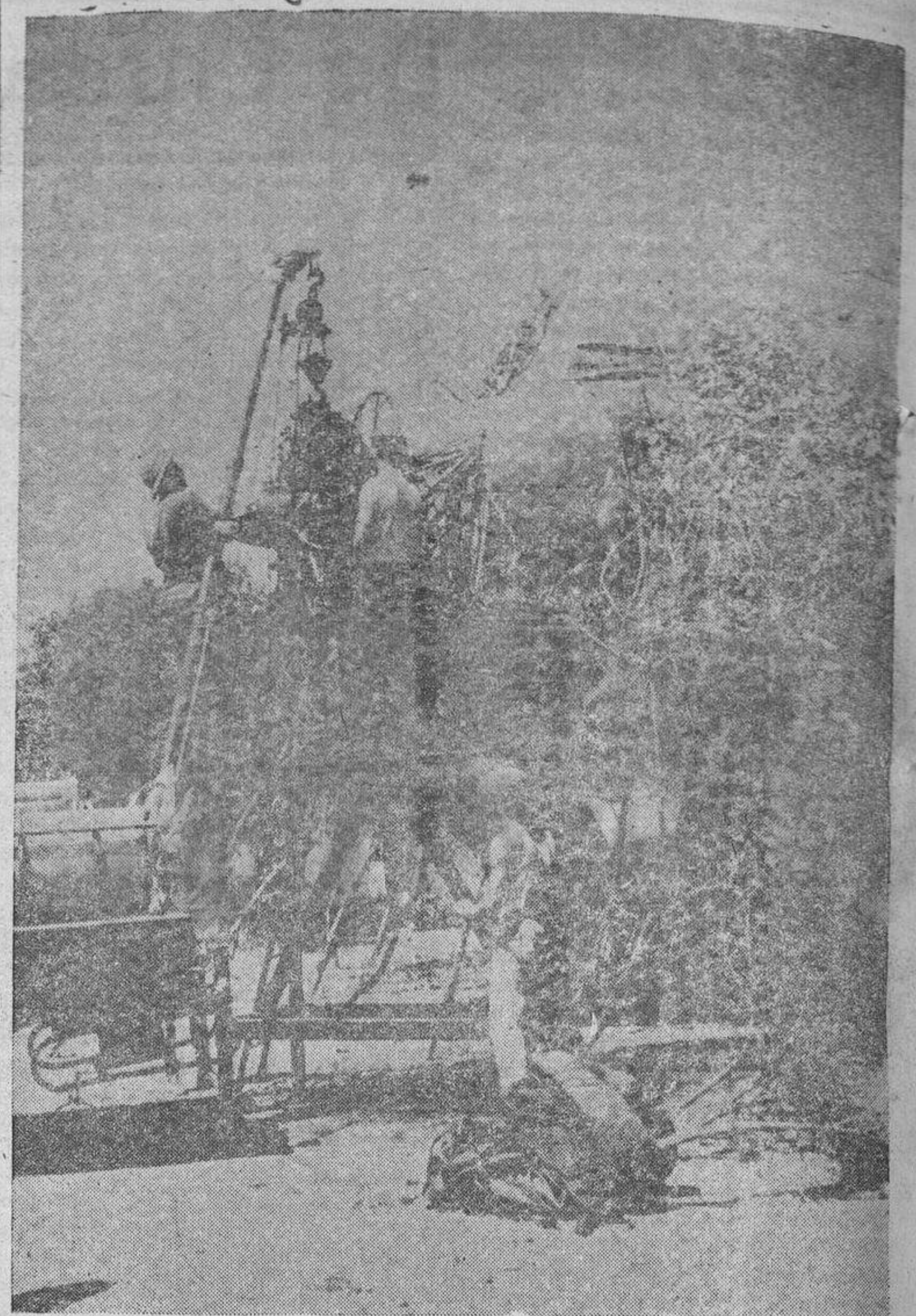
Una base aérea italiana en África Oriental: los aviones ocultos en el bosque. Se recambian los motores

Es de esperar que el público salmantino dé una prueba más de su entusiasmo por el arte musical, con una asistencia nutrida y unánime en bien del buen nombre de nuestra capital y para satisfacción del esfuerzo que realiza el Conservatorio Regional de Música.