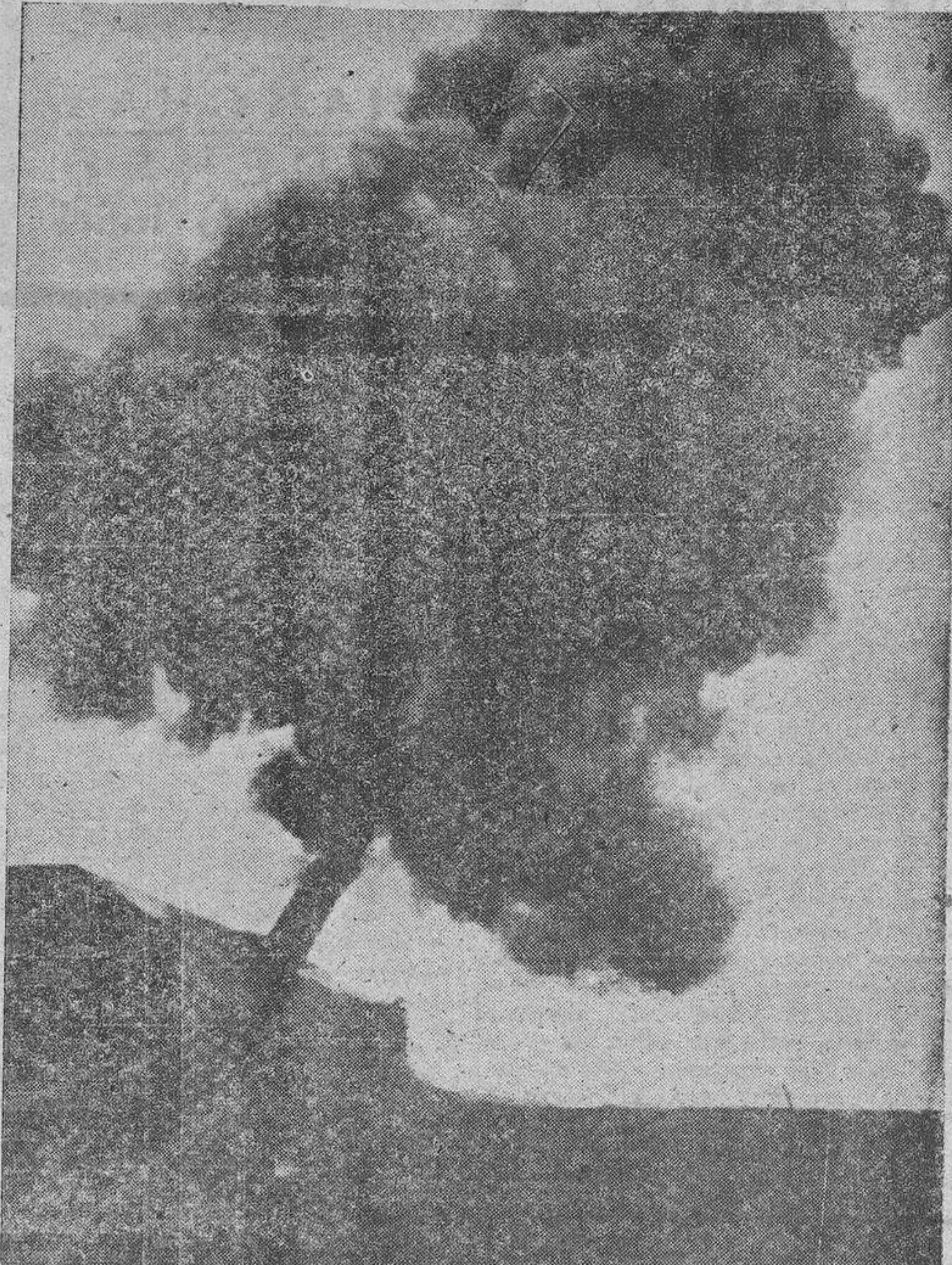
Cañones alemanes de la costa del Canal, disparan contra Dover

Varios buques de guerra italianos atacaron la isla de Samos, contra la que dispararon sin consecuencias." (Efe.)