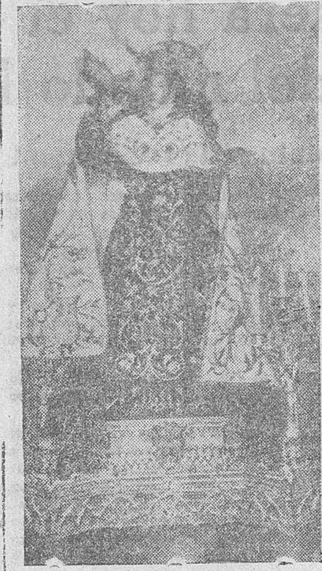
trarse ante los restos de la gran Santa Teresa de Jesús.