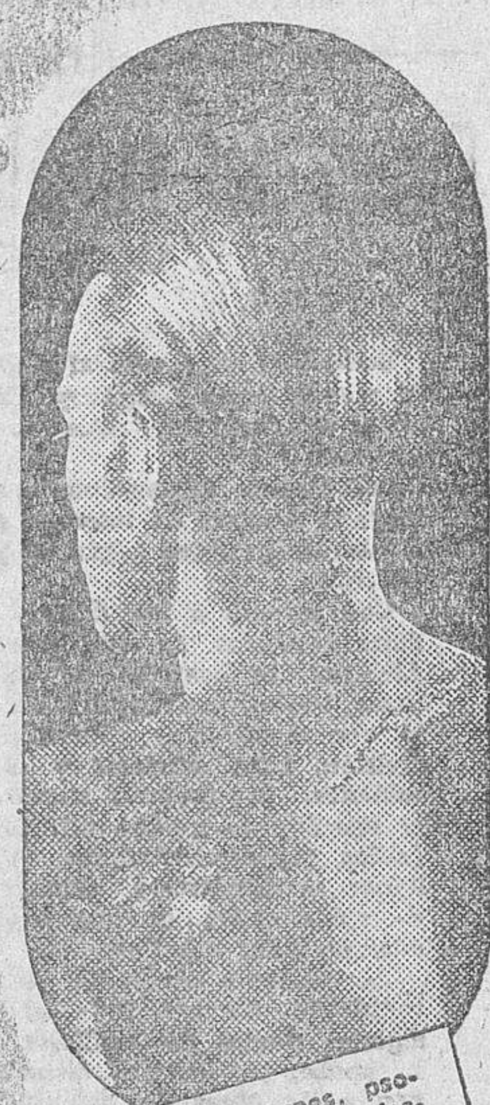
El eczema, herpes, psoriasis, etc., son manifestaciones de una sangre viciada que se debe purificar con el DEPURATIVO RICHELET

No hay mucho que hablar del Depurativo Richelet. Lo conoce ya todo el mundo y en todos los países y bajo todas las latitudes ha librado a muchísimos enfermos de la Piel y de la Sangre de una existencia de tristezas y dolores. El Depurativo Richelet, a cuya fórmula se han incorporado las sales halógenas de magnesio (preventivas contra el cancer) posee ahora nuevos elementos curativos, los cuales han reforzado su acción terapéutica, que de antes era ya muy activa. Este preparado se nos ha revelado como uno de los más poderosos medios puestos a nuestra disposición, para combatir y evitar las múltiples dolencias y trastornos que aquejan la edad madura, pérdida de la vitalidad, lastitud de todo el cuerpo, etc., etc. El Depurativo Richelet tonifica los músculos y los nervios, activa y regulariza las funciones vitales, rejuveneciendo de este modo todo el organismo de un modo asombroso. Todos los que usen este poderoso medicamento, una o varias veces al año, sentirán renacer en ellos una nueva vida, libre de dolencias, más activa y prolongada.