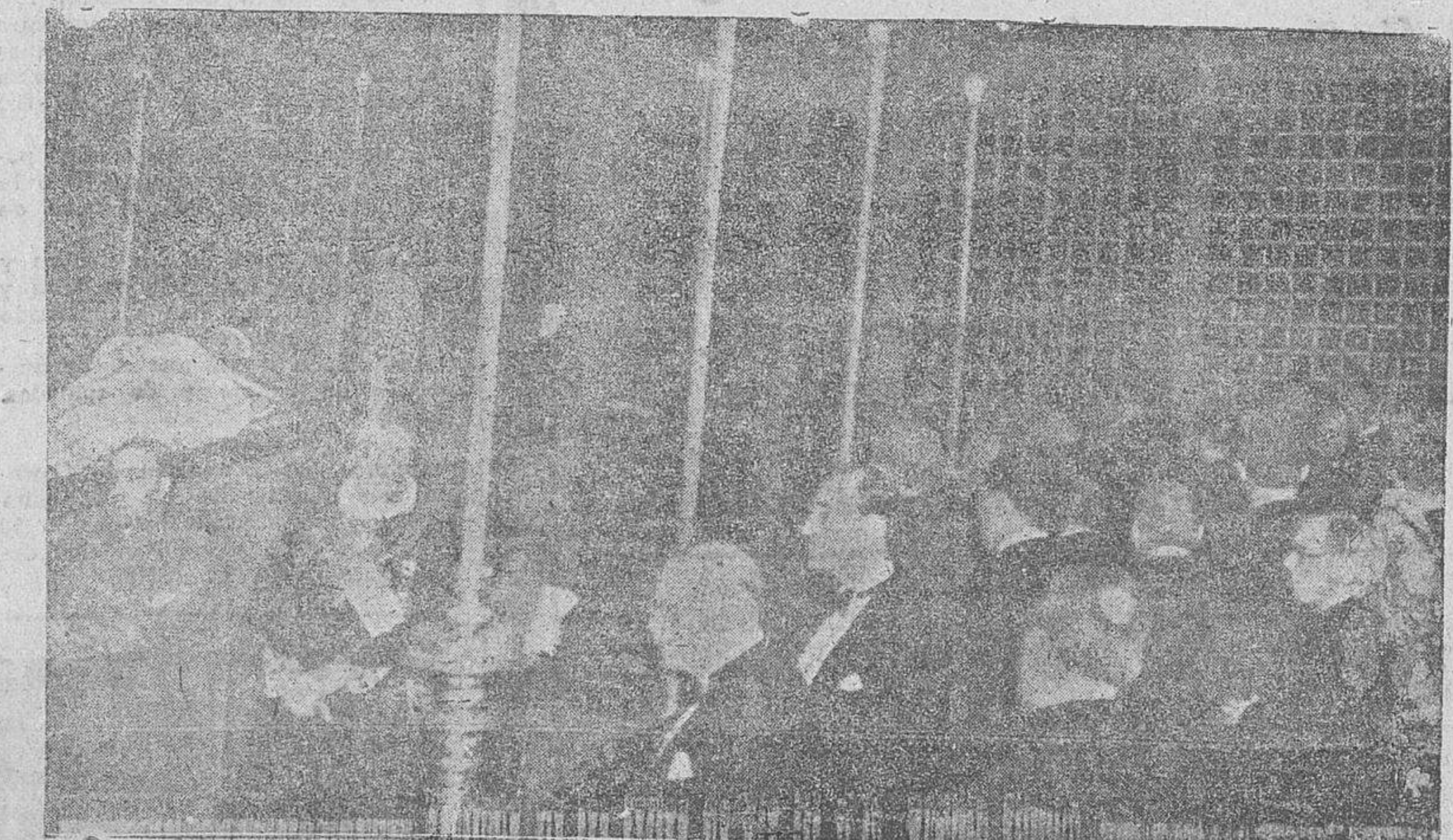
Traslado de los restos de Pío XI a la Capilla Sixtina