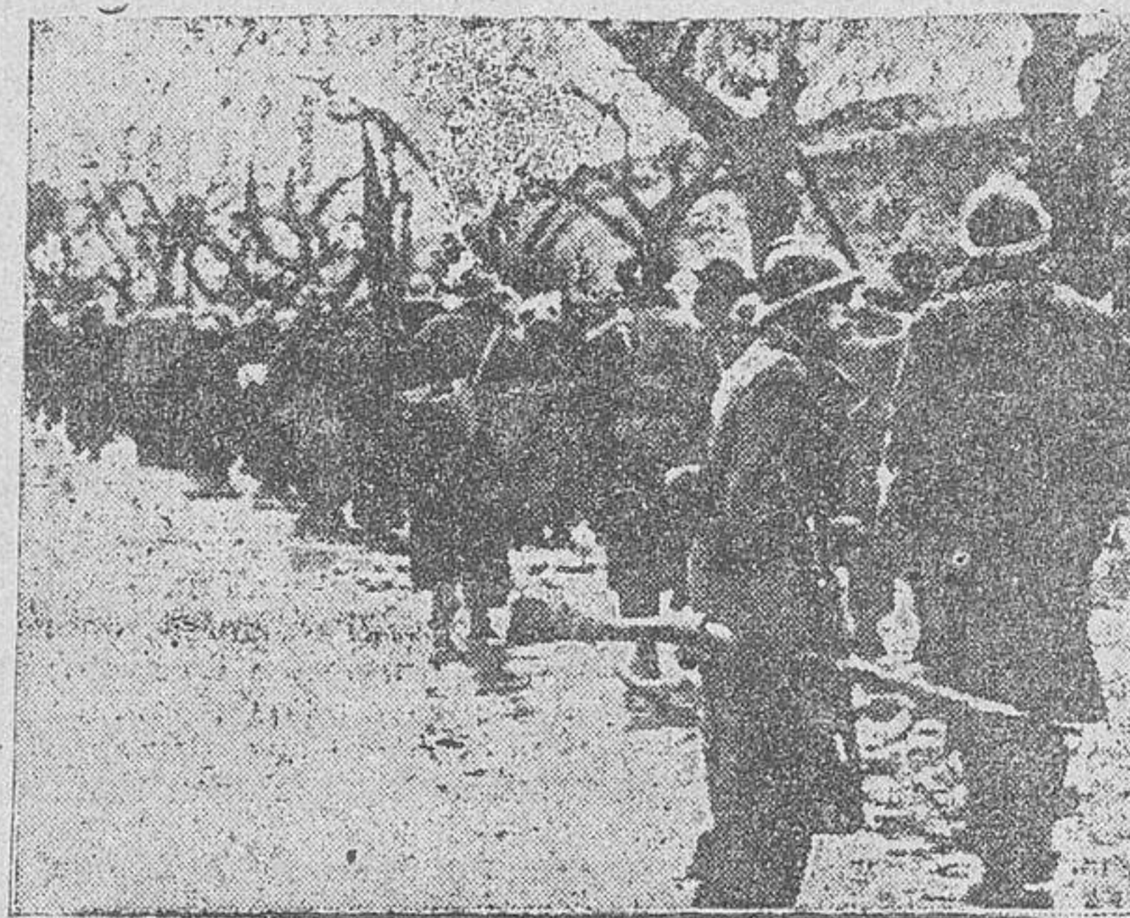
Una columna de soldados rojos fugitivos abandonando la ciudad de Barcelona a su llegada a Marsella a bordo del crucero inglés "Greyhound"

Perpiñán.—Noticias recibidas de fuente fidedigna dan cuenta de que Negrín se ha entrevistado con los dirigentes marxistas fran-