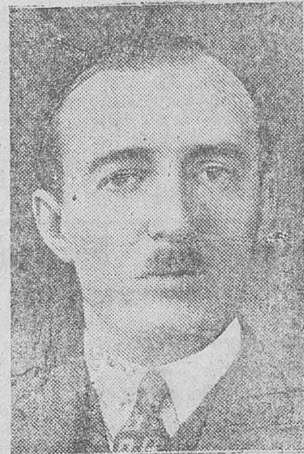
SU MAJESTAD ZOGU, REY DE ALBANIA

Albania tomó parte del prehistórico reino de Iliria, que tan en relación estuvo con el imperio macedónico. Hubo en la costa colonias griegas. Mas tarde, esta costa fue base militar del imperio romano. Los ilirios o dálias fueron buenos soldados en las legiones romanas. En la división del imperio romano, Albania pasó a depender de Bizancio. En el siglo VII sufrió las invasiones de servios y croatas, unida, su historia al imperio de Bizancio, tiene que resistir los ataques de los turcos, hasta que, como última nación balcánica, en su poder, Albania pasa a formar parte