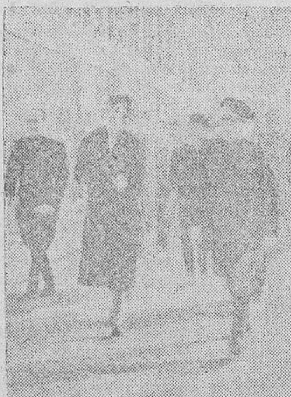
La Princesa del Piemonte visita la Feria Antártica del mineral italiano