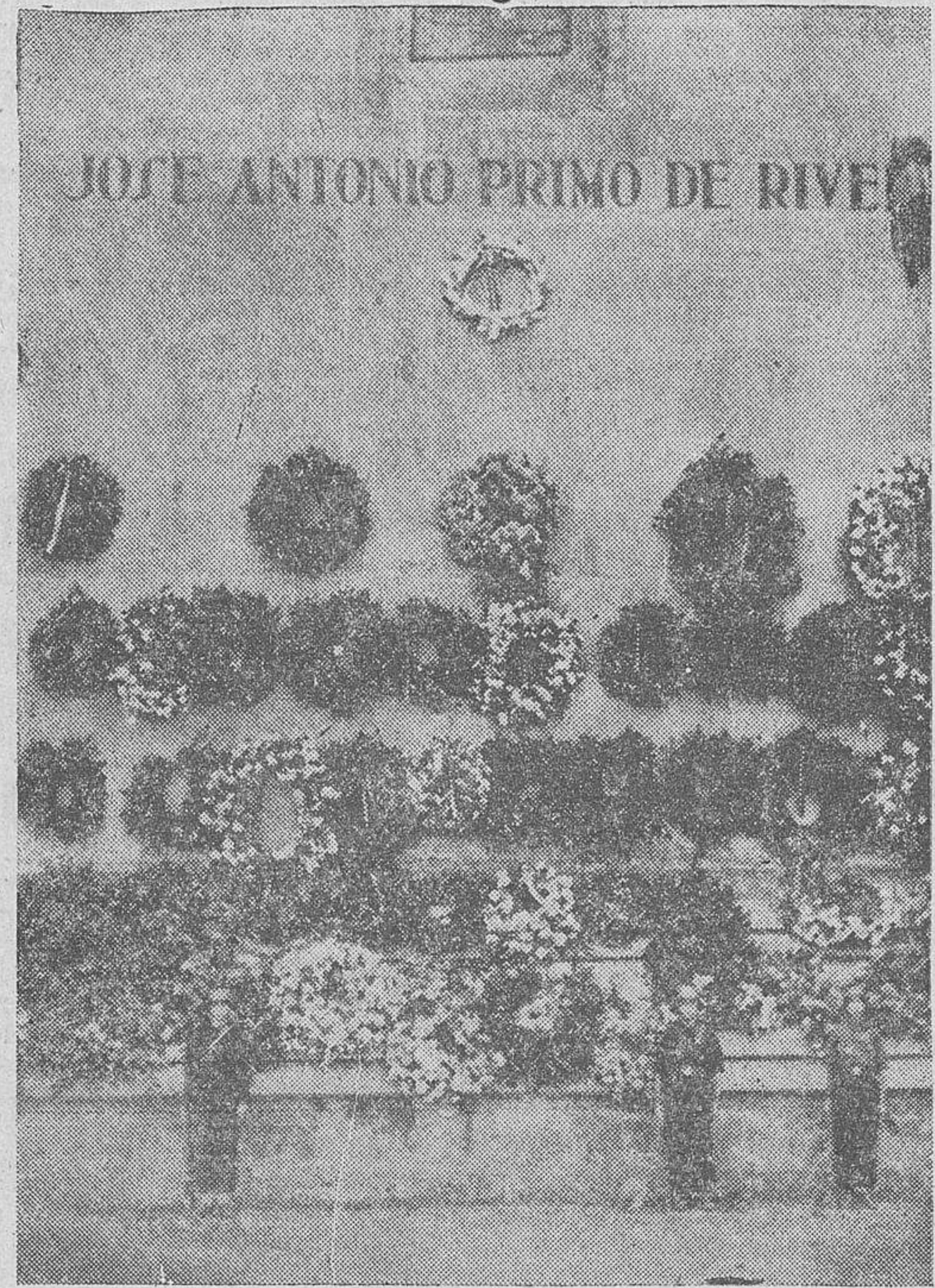
Bajo el nombre del fundador de la Falange, laureles y flores ornan la fachada de nuestro templo catedralicio

Yugo y las Flechas que de nuevo adoctrinen y eleven al mundo a la luz de tu Santa Palabra. Y a él dale tu Reino de eterno en tu bienaventurada vida, con jerarquía, con orden y esfuerzo, digamos siempre, nosotros mismos, en nuestros hogares, en nuestra España Grande y Libre; hágase tu voluntad, así en la tierra como en el Cielo.