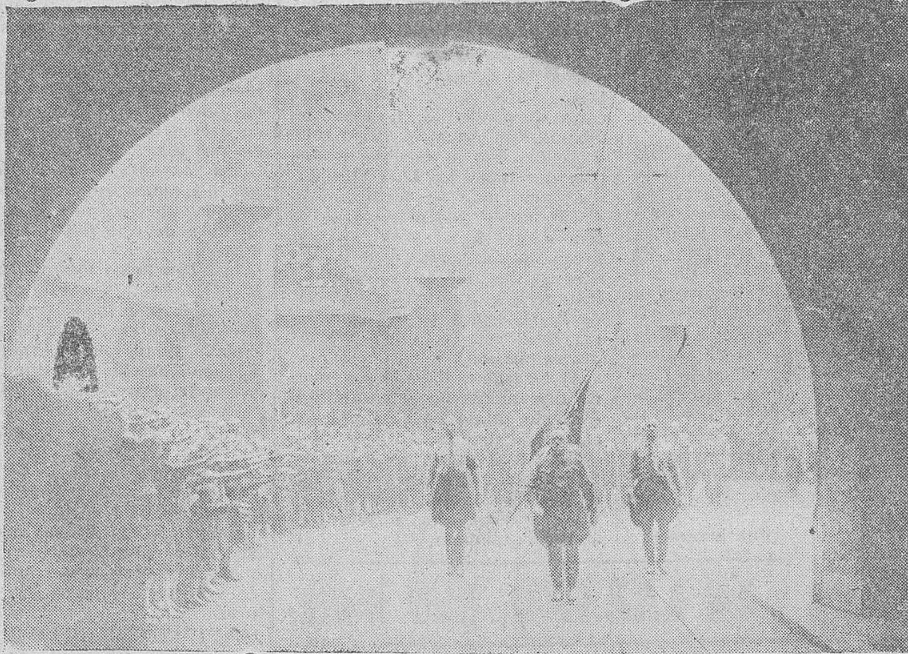
En conmemoración de los primeros caídos por el nacionalsocialismo, delante de la «Friedherrnhalle», en Munich, se celebra solemnemente una ceremonia en su recuerdo el día 9 de Noviembre de cada año. La foto muestra la marcha de los antiguos militantes por las calles de la capital del Movimiento

para honrar a los primeros caídos del Partido