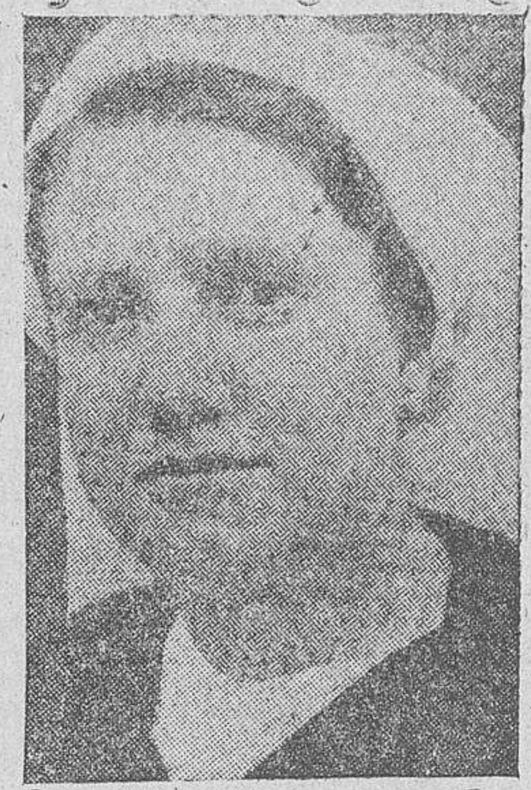
S. A. la Infanta doña María de las Mercedes, que acaba de obtener el título de Dama enfermera de la Cruz Roja

Maria y de su Hijo, con hermosas y valiosísimas coronas de oro. Se formó una Archicofradía, bajo la protección de la Santísima Virgen, "Salud de los Enfermos", San José y San Camilo, padre de los enfermos y mo-