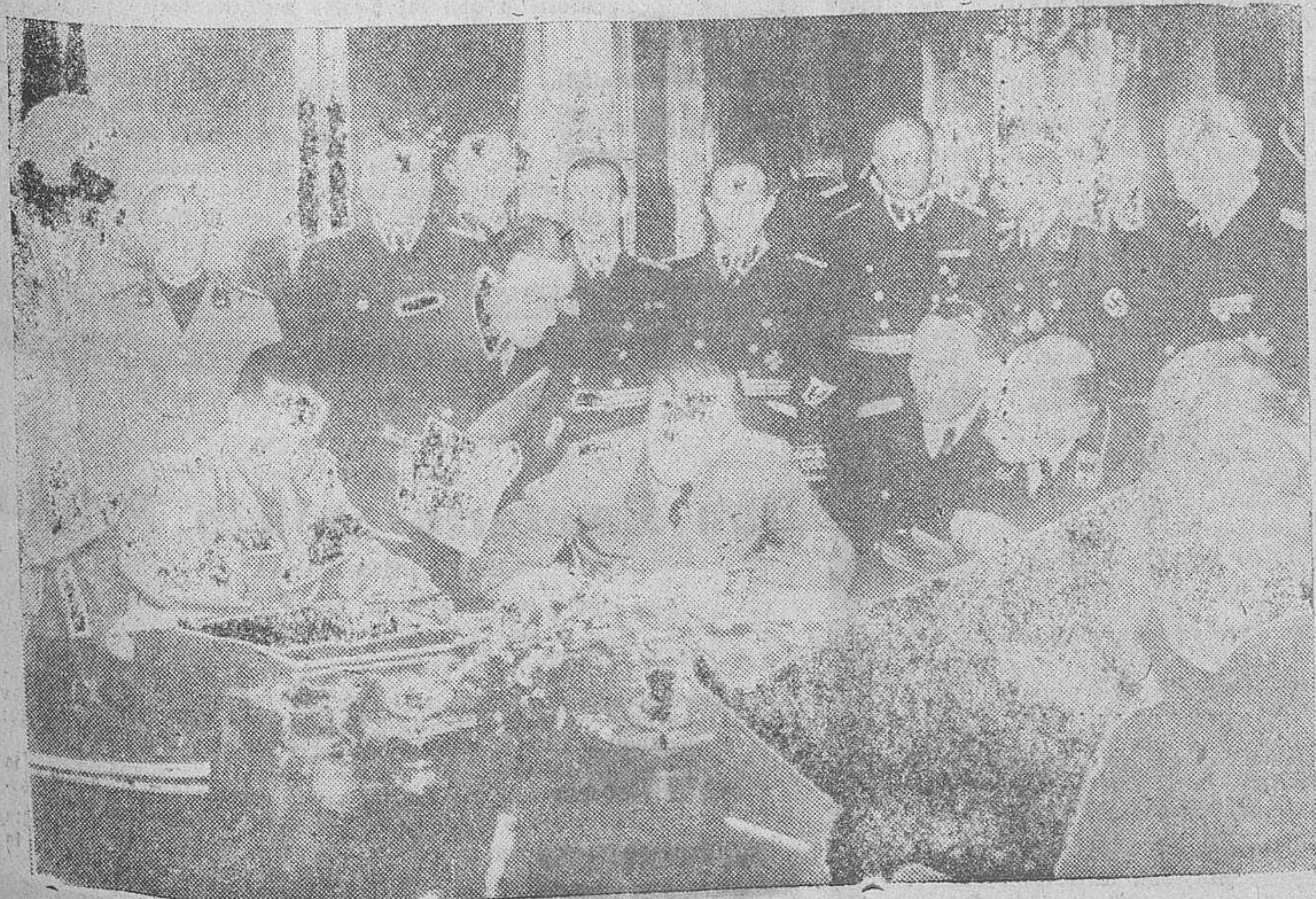
Los ministros de Asuntos Exteriores von Ribbentrop y el conde Ciano firmando en Viena el acuerdo referente a las nuevas fronteras entre Checoslovaquia y Hungría

Mediante esta sentencia, se incorporan a Hungría unos 12.400 kilómetros cuadrados, con un millón de habitantes