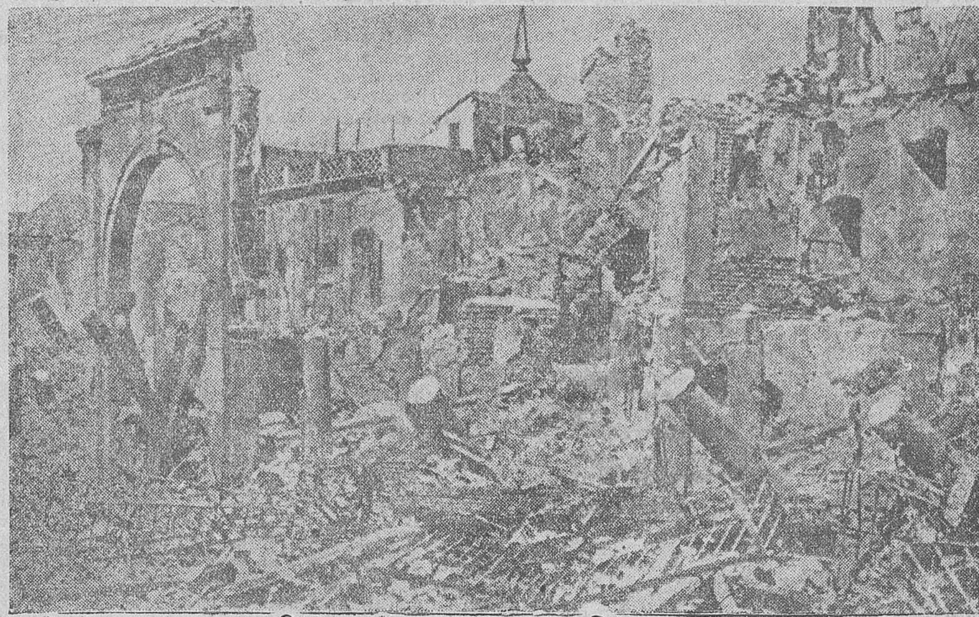
El furor marxista redujo a escombros uno de los santuarios de nuestra Historia: el Alcázar de Toledo. Estas gloriosas ruinas son también un grito—el mismo que lanza hoy España entera—contra la maniobra de mediación

Con la mediación quedaría menguado o escardecido y «en