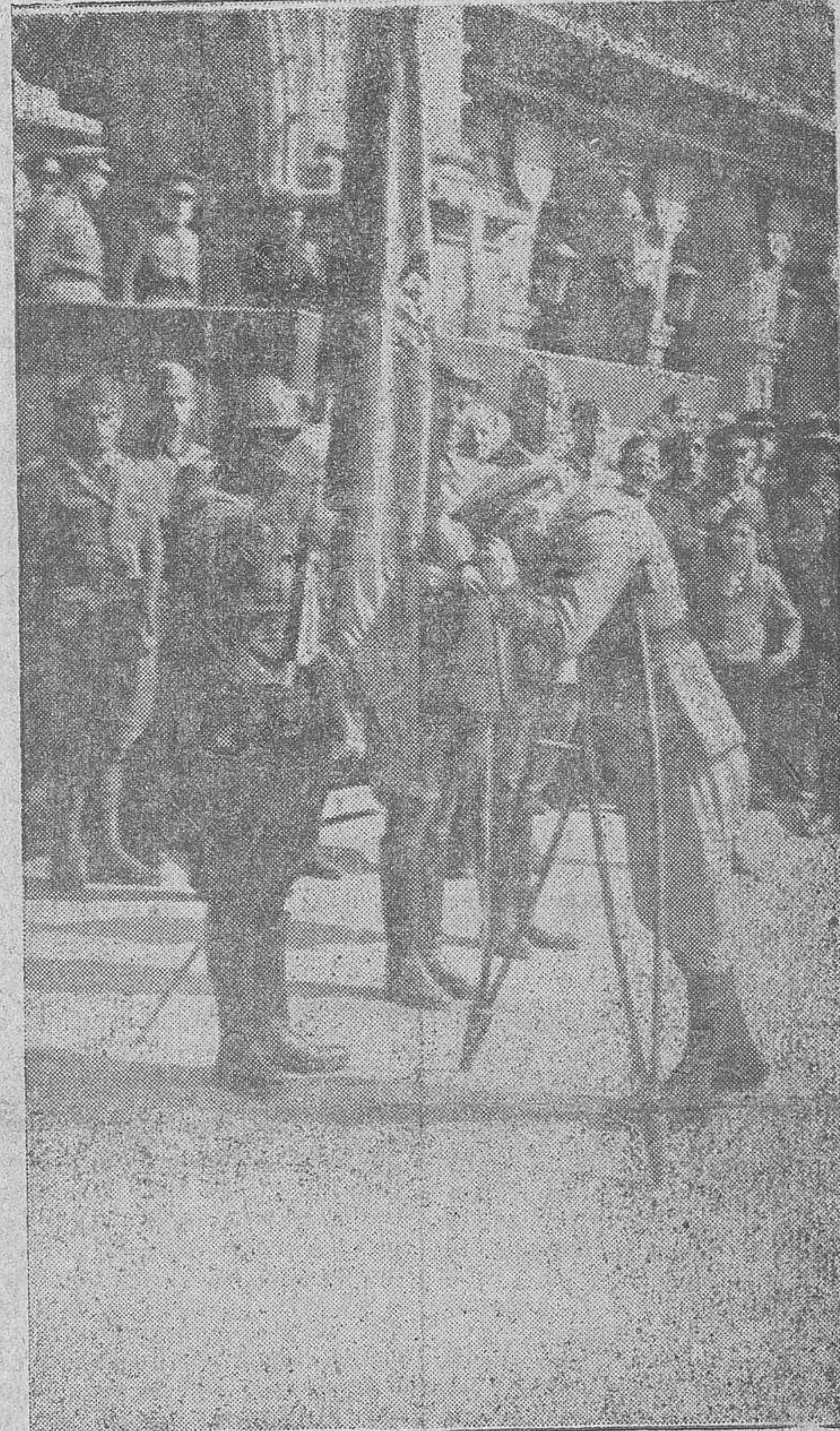
Y el heroico herido, capitán de Regulares, apoyado en sus muletas, deposita también sobre la Sagrada Bandera su beso emocionado...

Entraron cantando los Himnos Nacionales y sus cantos resucian en todo el ámbito de la Pla-