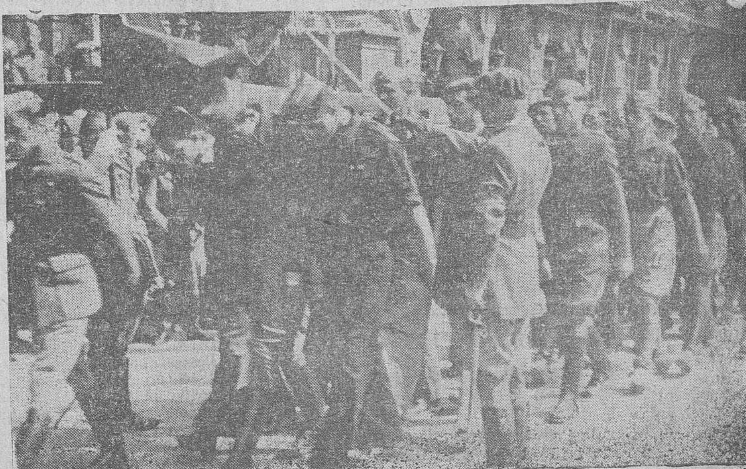
Los Caballeros alféreces, pasan bajo el arco que forman los pliegues de la Bandera Nacional y la espada del coronel-jefe de la Academia de Avila.

Parte oficial de guerra del Cuartel General del Generalísimo, correspondiente a día de hoy: En el frente de Aragón se ha llevado a cabo hoy un reconocimiento, habiéndose cogido un depósito de municiones, con tres millones y medio de cartuchos de fusil. Sin más novedades dignas de mención. Salamanca, 18 de Marzo de 1938. II Año Triunfal.