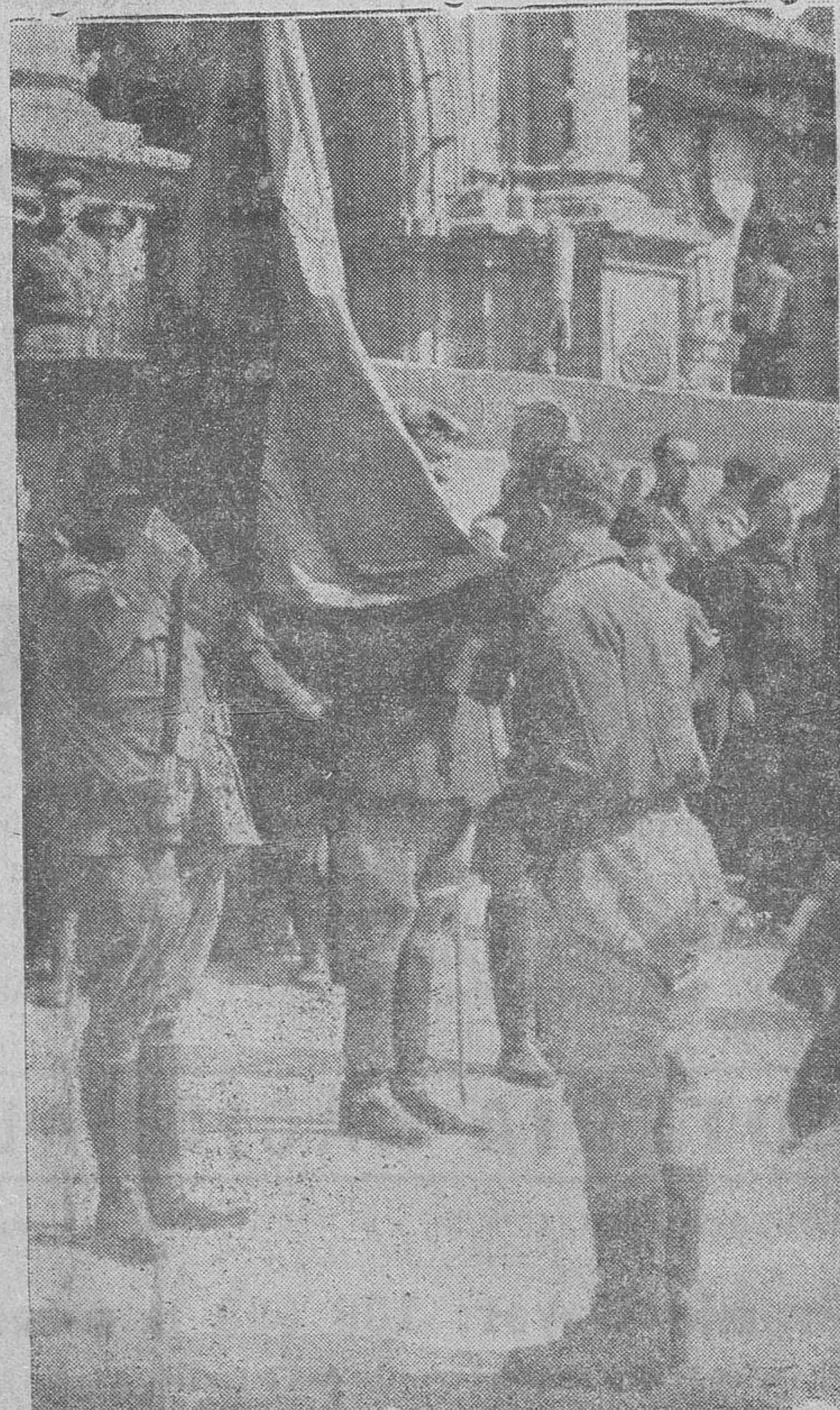
Después de haber prestado el juramento, los nuevos alféreces desan, con la mayor unción, la gloriosa Enseña de la Patria.