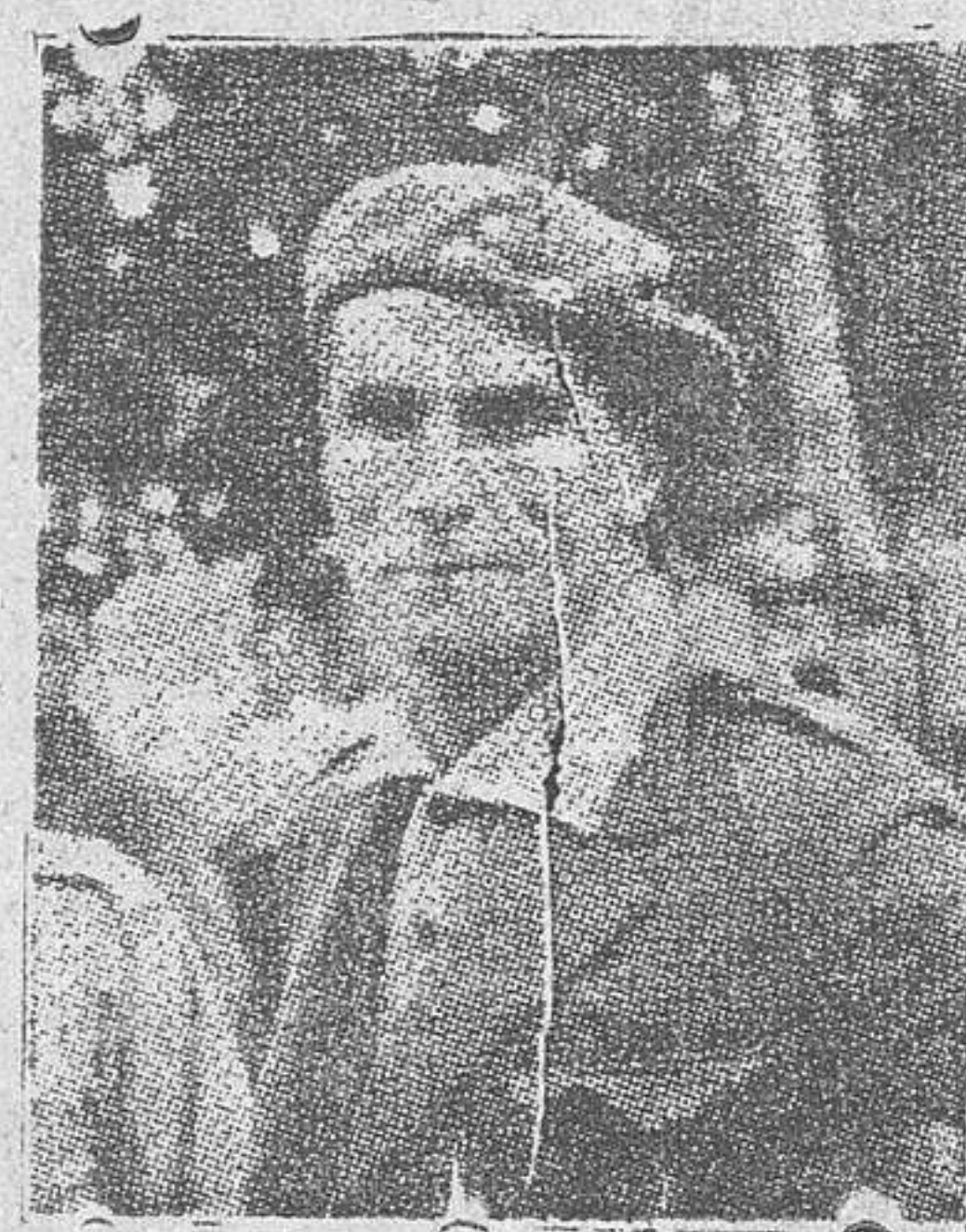
El coronel don Rafael Latorre