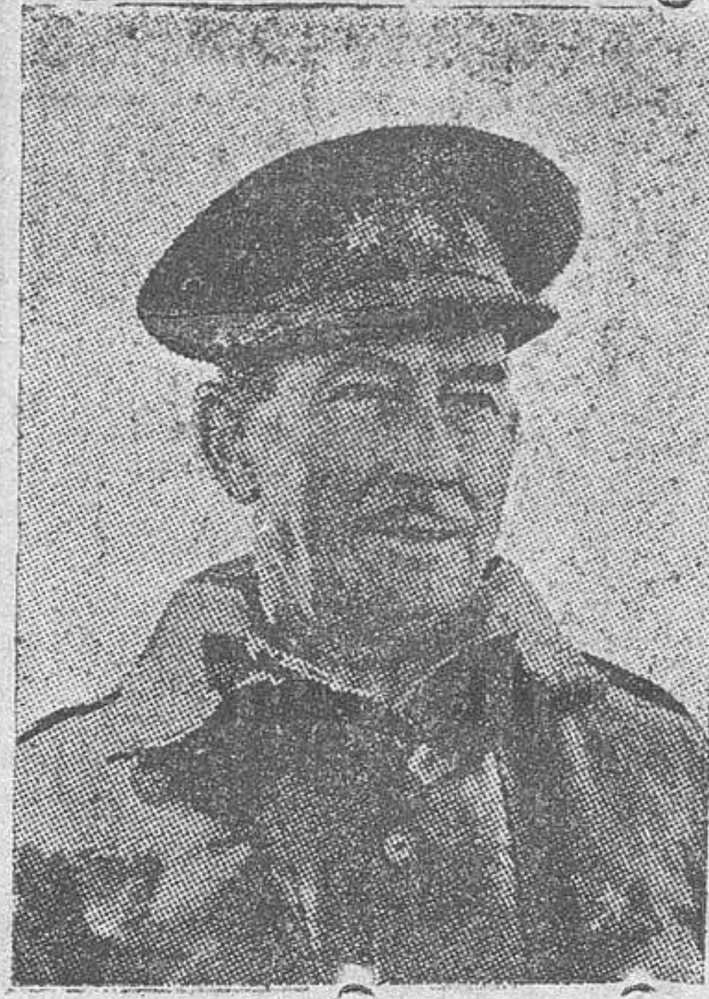
El general don Salvador Múgica