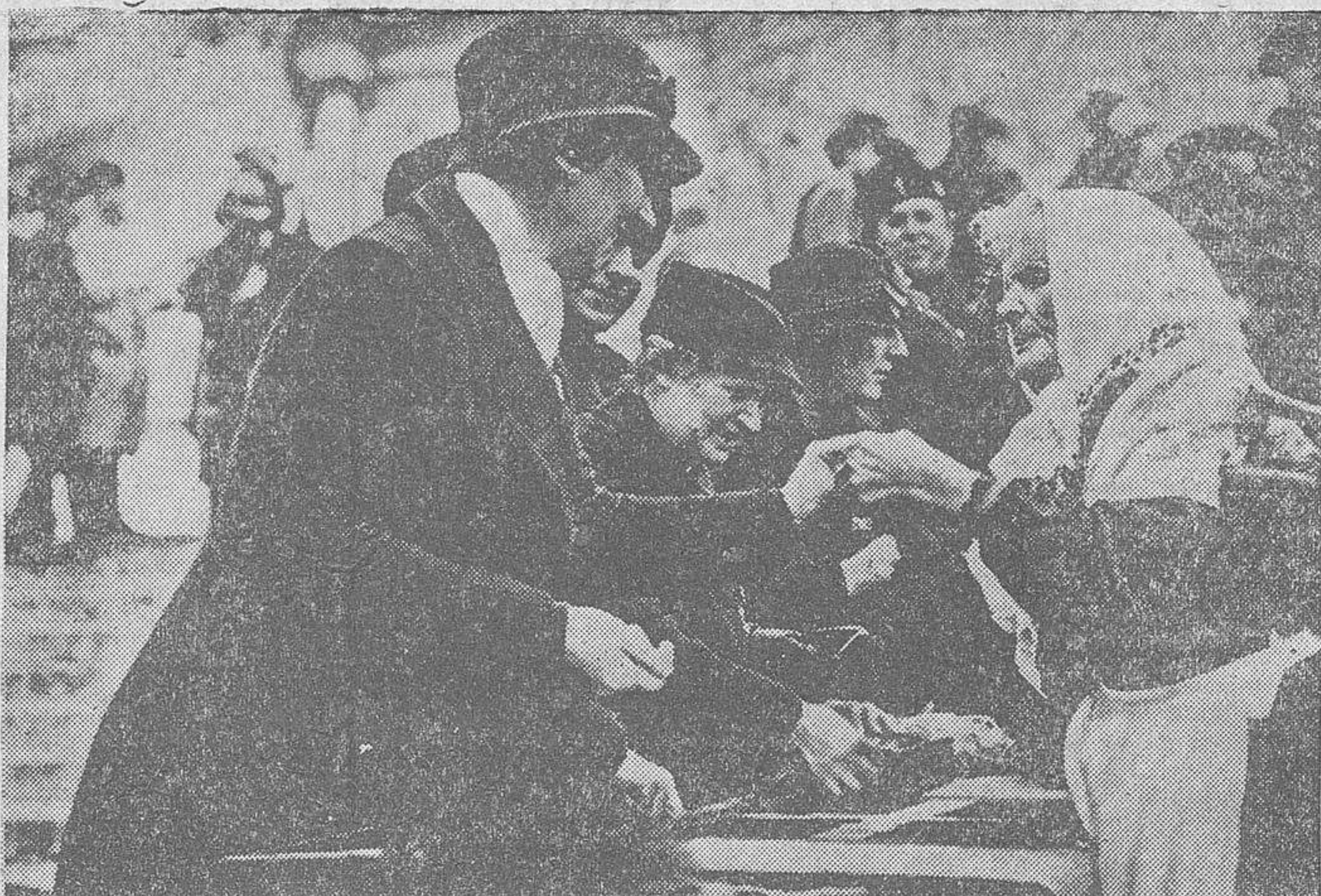
El 2 Diciembre 1935, las mujeres italianas, sin distinción de clases, entregaban sus anillos nupciales a la Patria

Por su parte, las Jóvenes Fascistas han prodigado sus esfuerzos en la obra que el Fascismo realiza en las Colonias Climastráficas de mar y de montaña, que en 1935 albergaron en 1.781 colonias, a más de 400.000 niños: en el día de la batalla Cruz (campaña contra la tu-