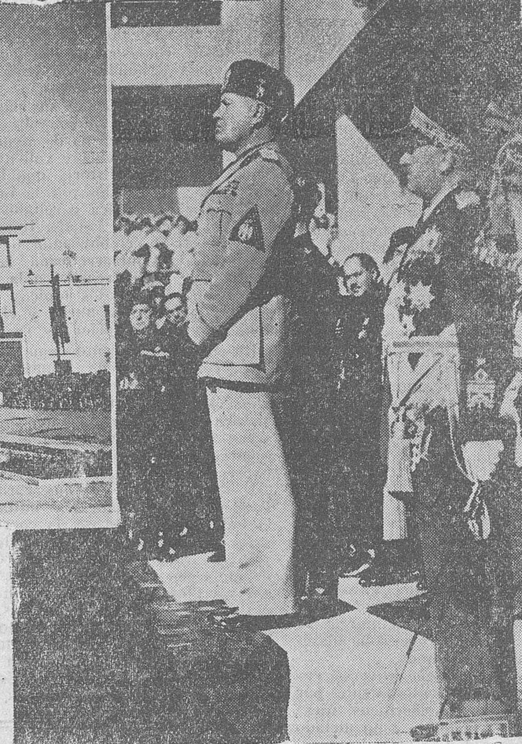
Con motivo del décimo quinto aniversario de la marcha sobre Roma, el Duce inauguró la "ciudad del aire": Guidonia. El acto revistió una extraordinaria brillantez, como prueba de la adhesión fervorosa del pueblo italiano al hombre genial que ha sabido conducirle por las rutas imperiales de los Césares. He aquí varios momentos de la ceremonia inaugural