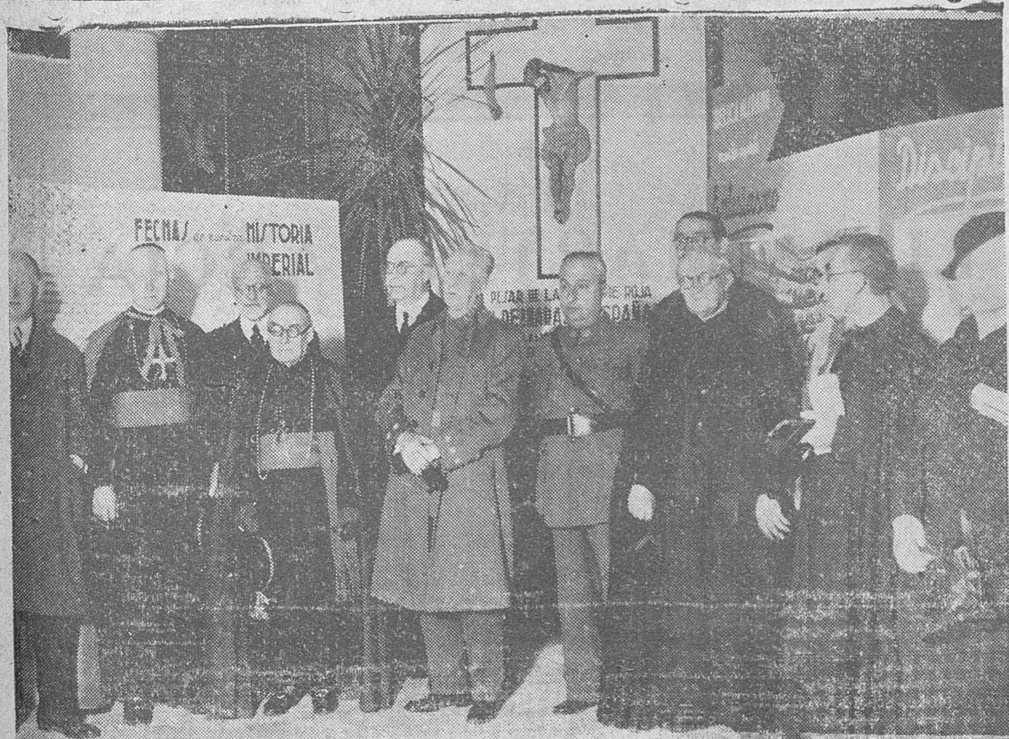
Las autoridades salmantinas en la inauguración de la Exposición organizada por la Delegación del Estado para Prensa y Propaganda

El enemigo ha infiltrado traidores en la retaguardia con disfraz de murmuradores. Si eres buen español, hazlos callar en seco y entrégales a la justicia del Caudillo.