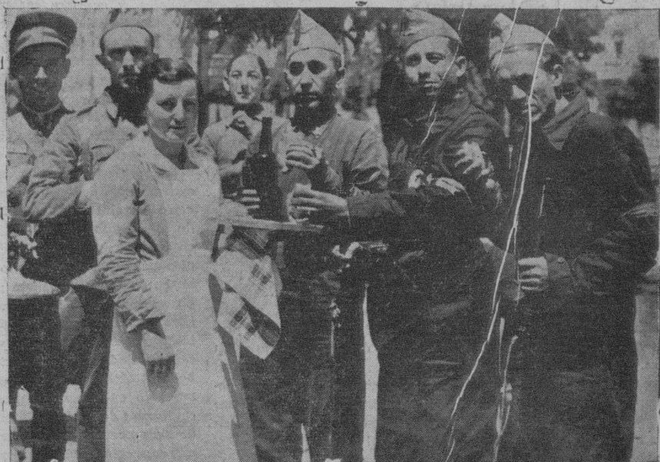
Los voluntarios que prestan servicio de vigilancia son obsequiados con bocadillos por una simpática doncella.