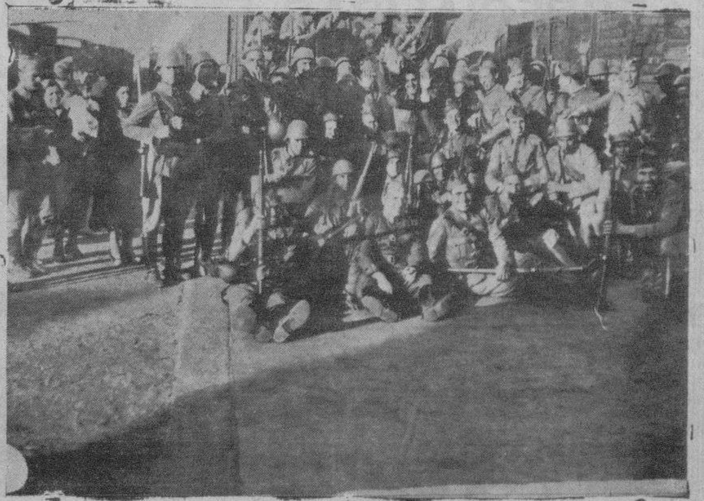
Grupo de soldados del Regimiento de Caballería de Calatrava, que salieron ayer en tren para el frente