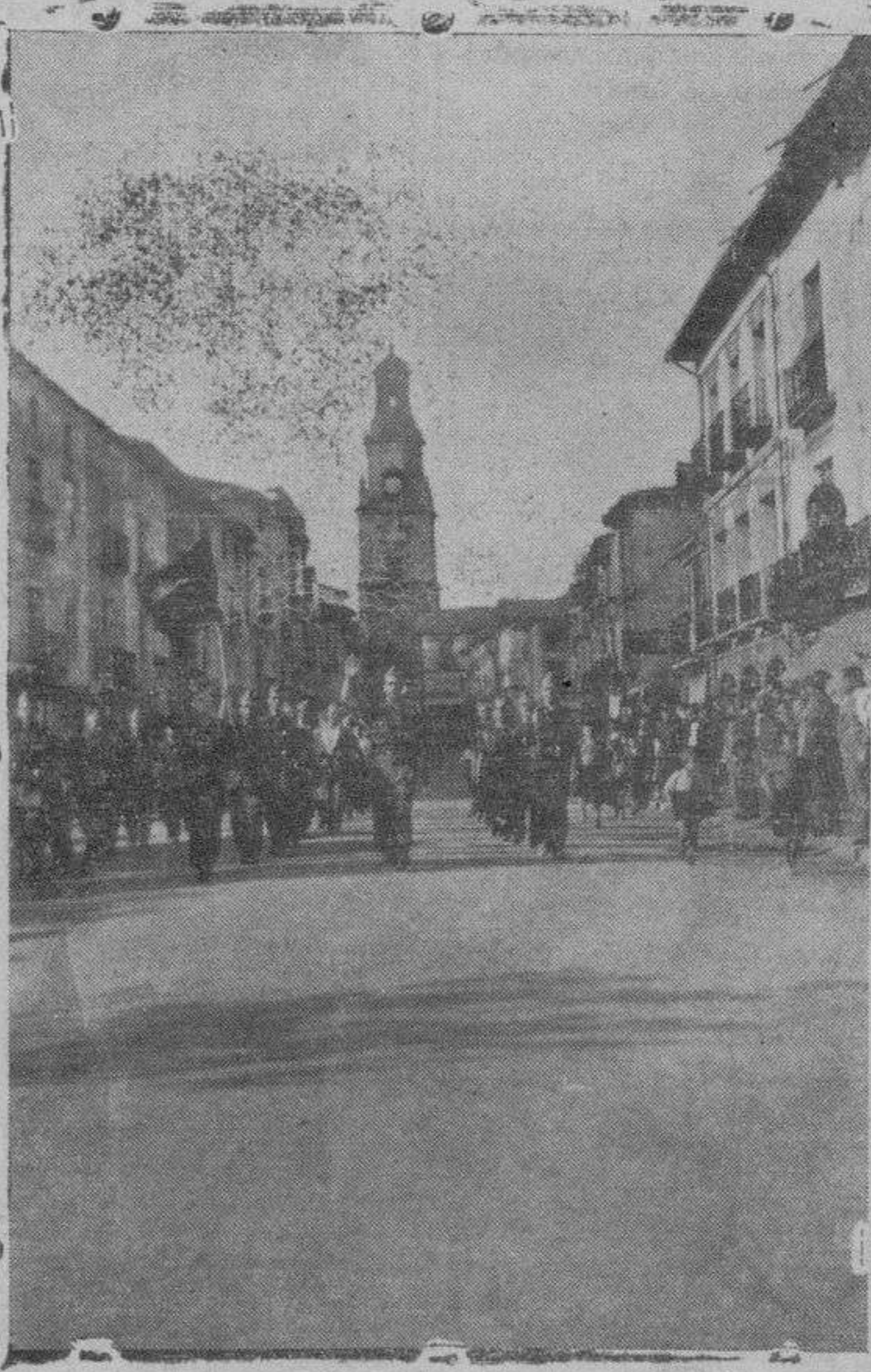
Desfile de Falange Española por las calles toresanas