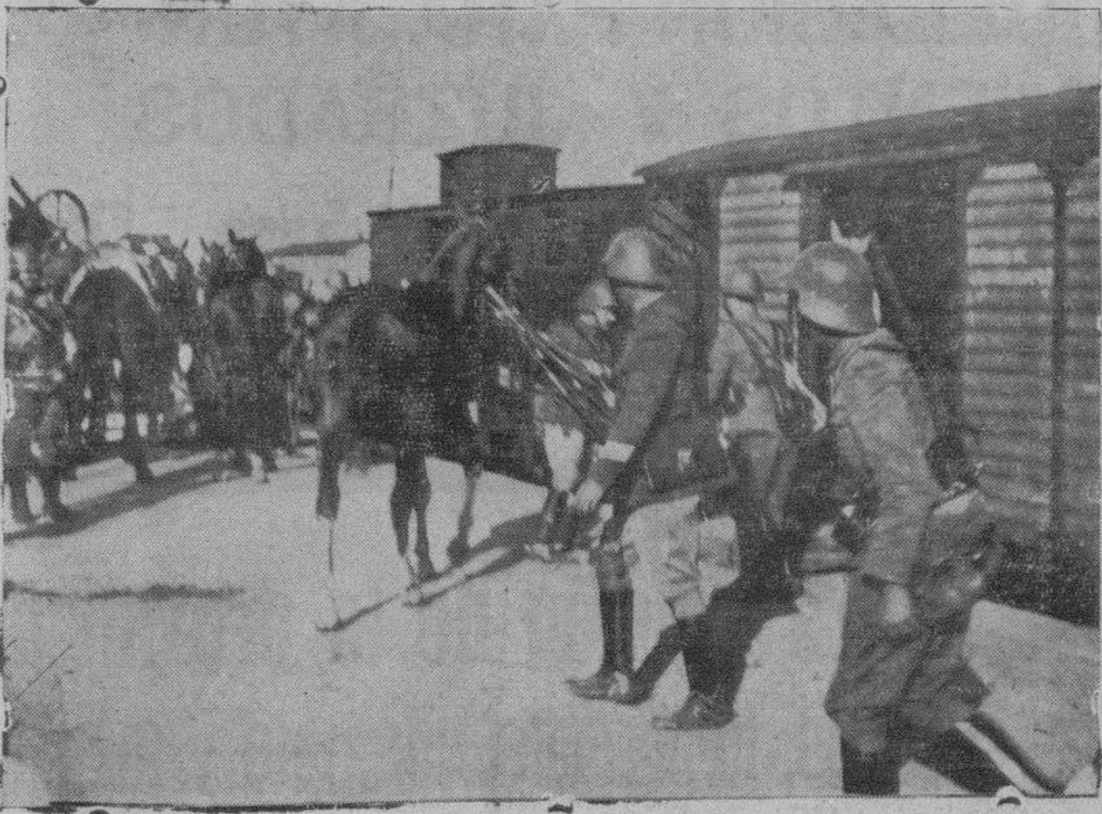
Soldados del Regimiento de Calatrava, efectuando el embarque de los caballos para marchar al frente