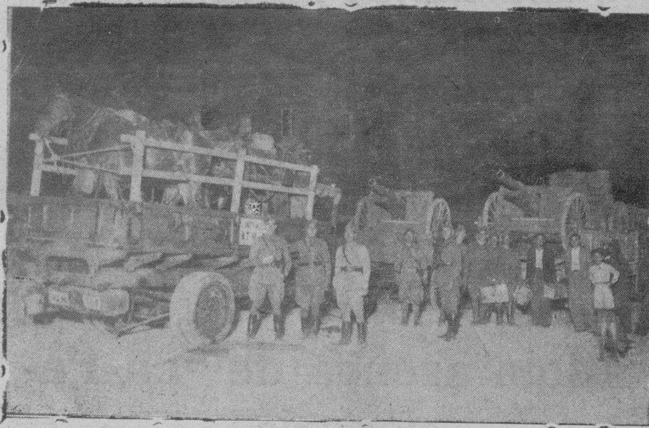
VALLADOLID.-Baterías del 14º Liger que han sostenido, con muy certera puntería, los combates en el Alto de León

Me entretuve un buen rato curioseando por aquí y por allí, suponiendo a las dos celebridades enfrascadas en una conversación profesional, cuando de repente me pareció oír en un piano, unas notas muy semejantes a las que yo tarareaba unos momentos antes.