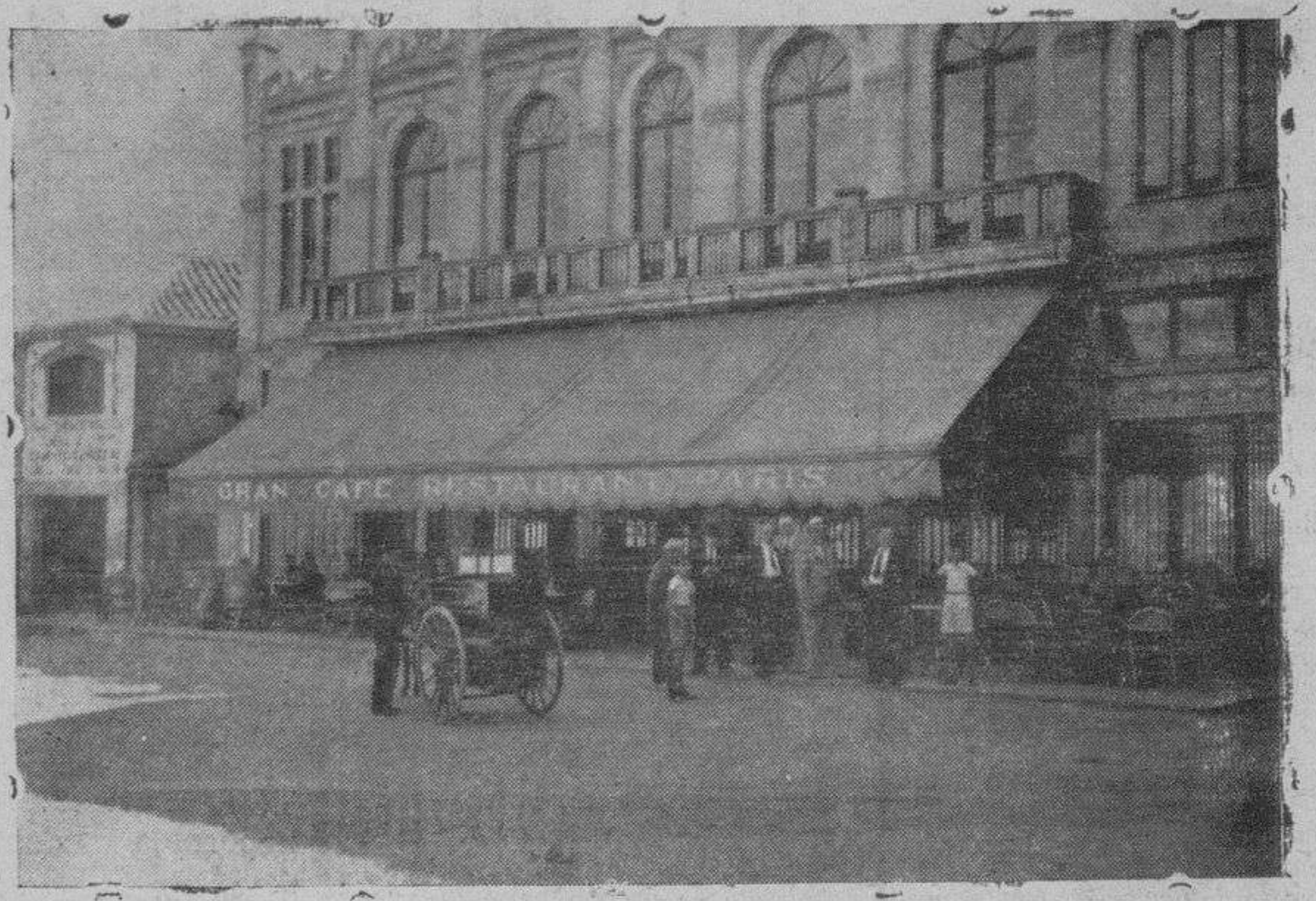
A la sombra de los fusiles, ningún día hemos dejado de tomar café