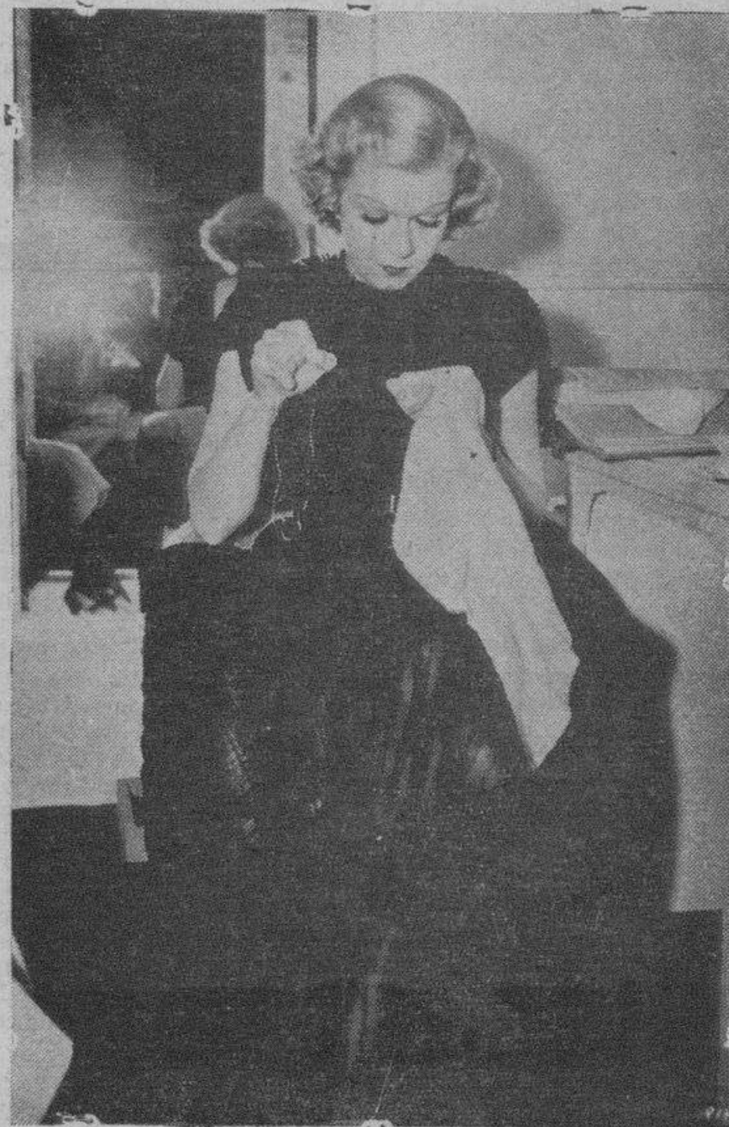
Joan Harlow, dedicada al bordado durante los intervalos de descanso en la filmación de su nueva película

bida predilecta... la gallina, su plato favorito... el blanco, su color preferido... el clavel, la flor que más le retraxa... la esencia de rosas, su perfume dilecto.