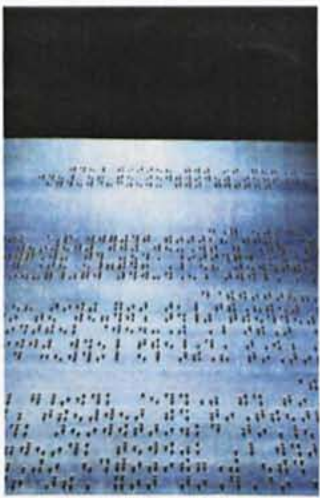
Viaje a Semiópolis

SUBDIRECCIÓN GENERAL DE PROMOCIÓN DE LAS BELLAS ARTES