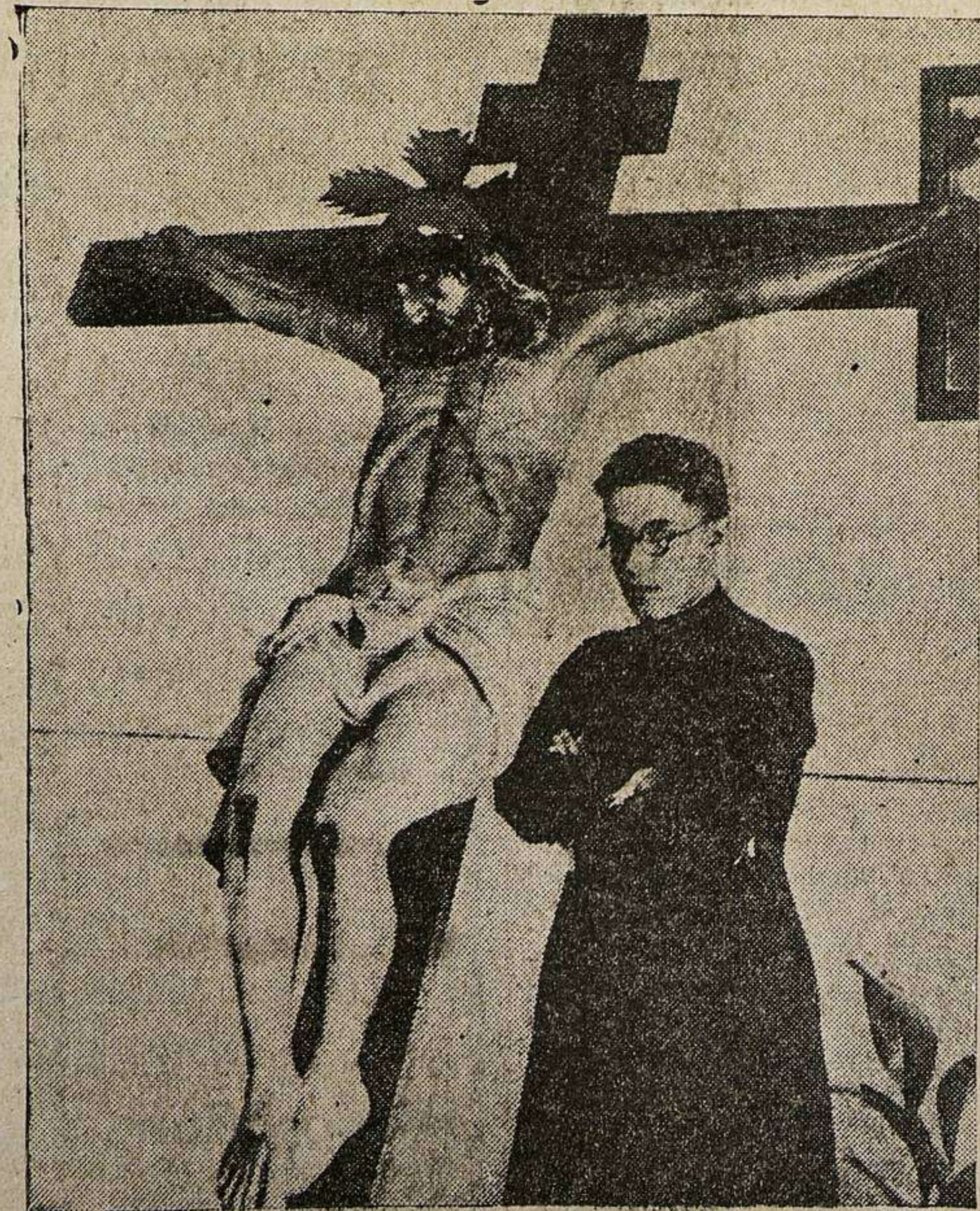
En la ermita de Santa Lucía, en Sanfuentes (Vizcaya), unos desconocidos produjeron un incendio que destruyó todo el templo, quedando en pie sólo las paredes, después de haber cometido el robo de los vasos Sagrados. De todos los ornamentos e imágenes, sólo se salvó la imagen del Crucificado, que fué hallada sin el menor deterioro, a pesar de ser de madera. La imagen fué después trasladada al domicilio del párroco

"EL ADELANTO" ES EL PERIODICO DE MAYOR CIRCULACION DE LA PROVINCIA