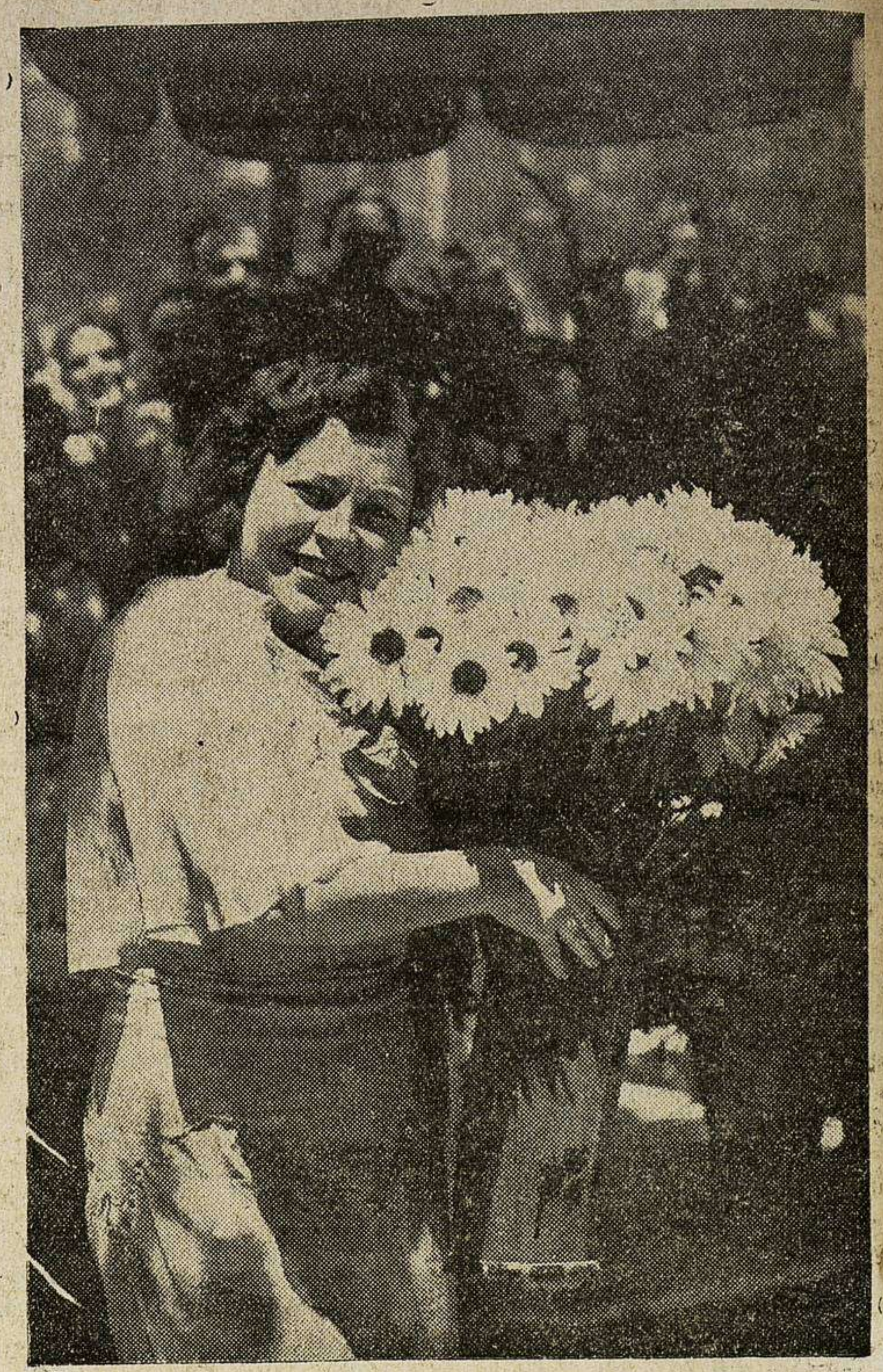
Inauguración del nuevo mercado de flores. - Una bella vendedora ofrece sus margaritas (Fotos Rico).