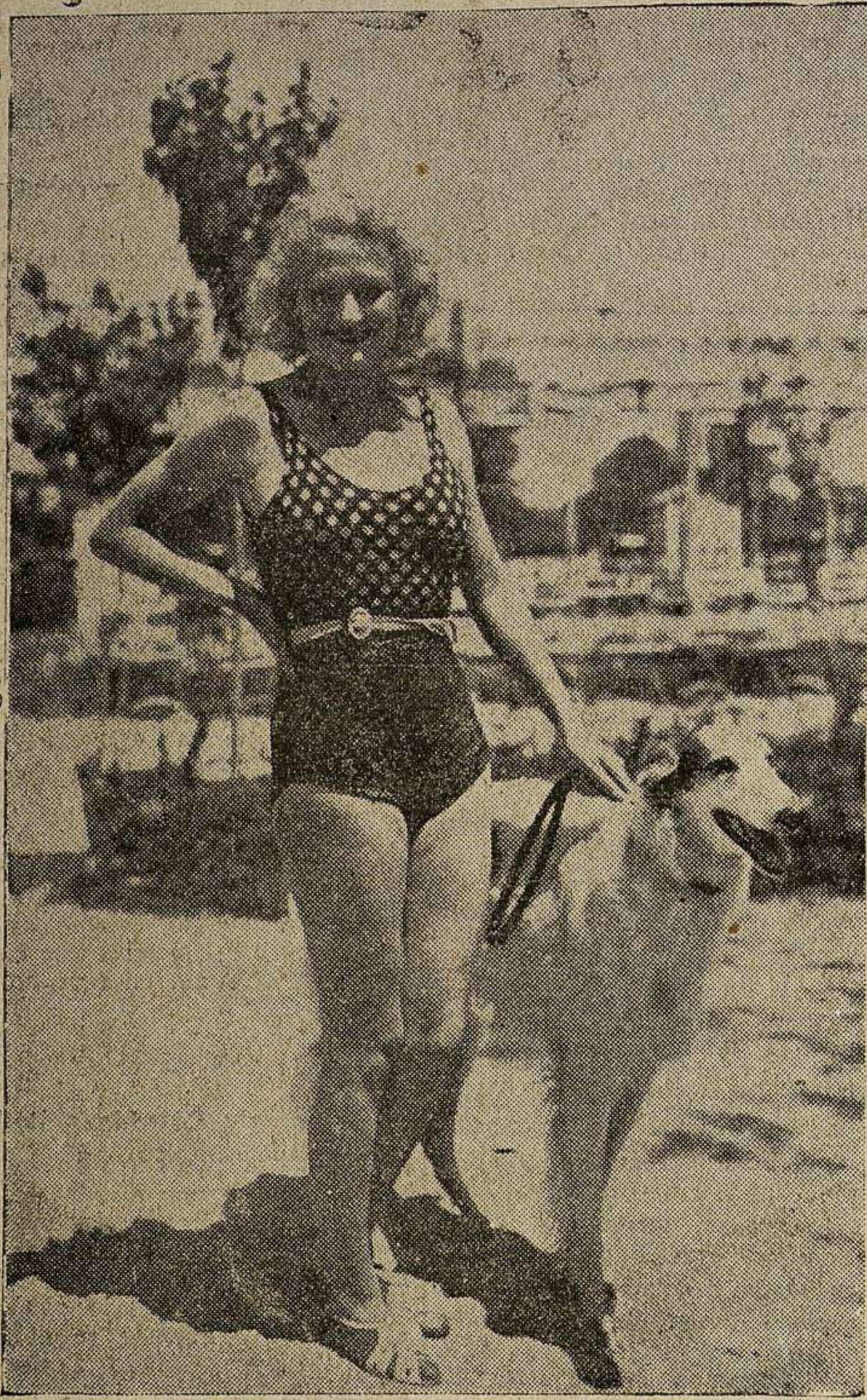
Una bella bañista se acompaña por la playa de su hermoso perro.