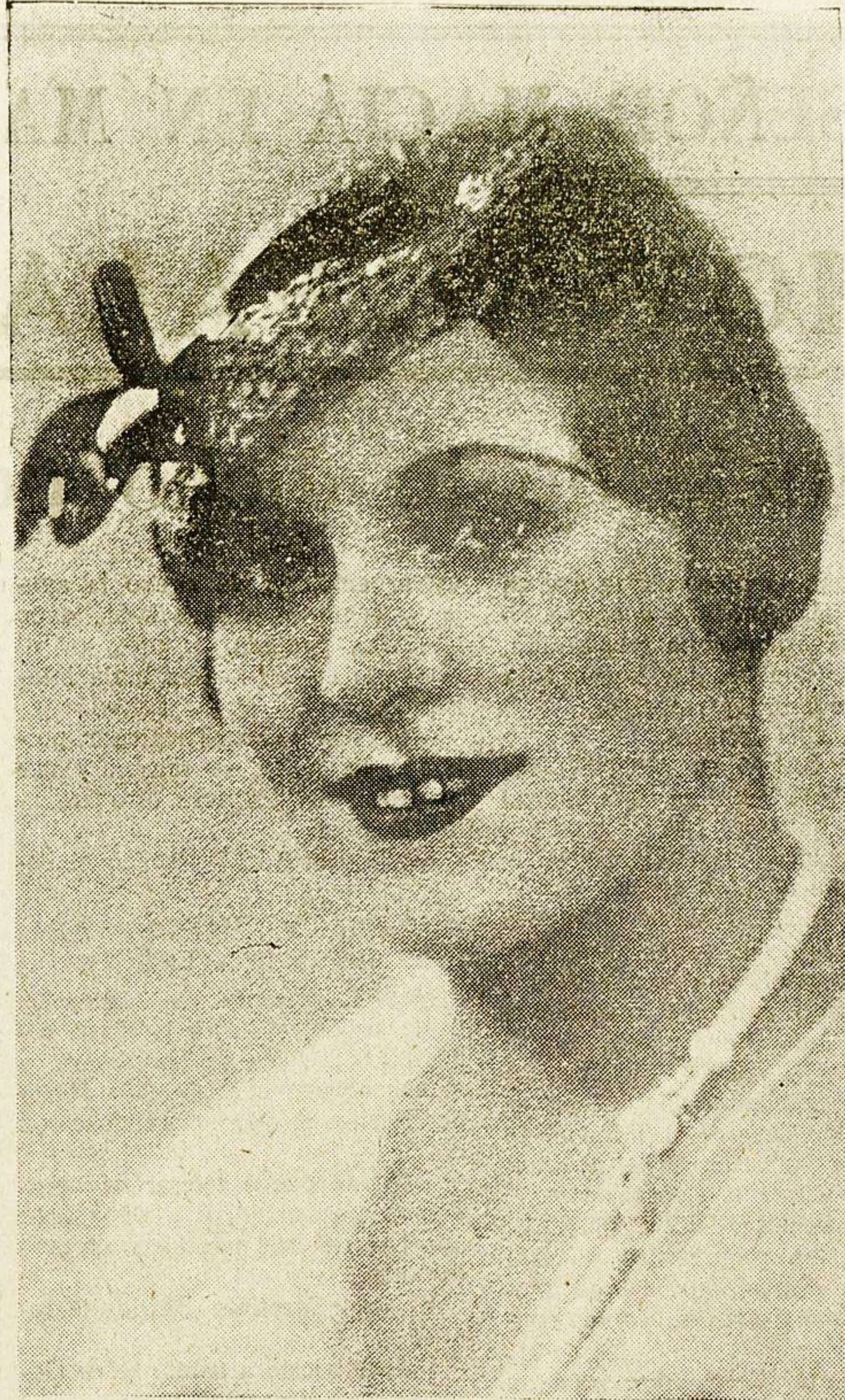
El modelo es una graciosa y originalísima toquilla, hecha en "paillason" de seda, con adorno de cinta "cirée"