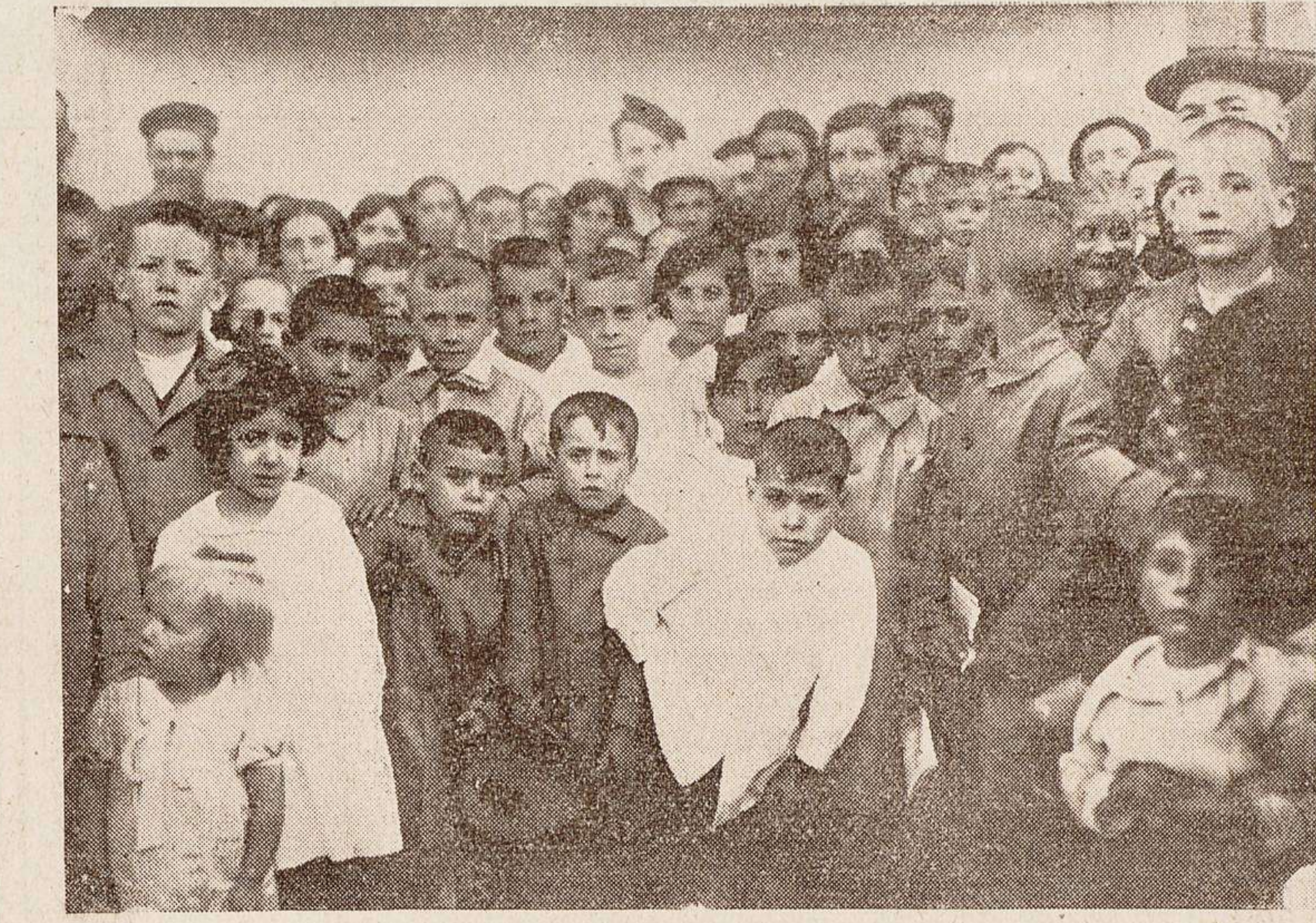
La primera colonia de niños y niñas que han salido para el Sanatorio de La Pedrosa

Hoy la civilización está en la cooperación. Nuevos conocimientos nos han permitido amoldar las materias primas a usos hasta desconocidos, transportar estas materias desde lugares más distantes y redistribuir los productos por todos los rincones del mundo. Podemos hacerlo a un costo tan reducido que a las pasadas generaciones les pareciera imposible. Pero esta riqueza sólo puede pro-