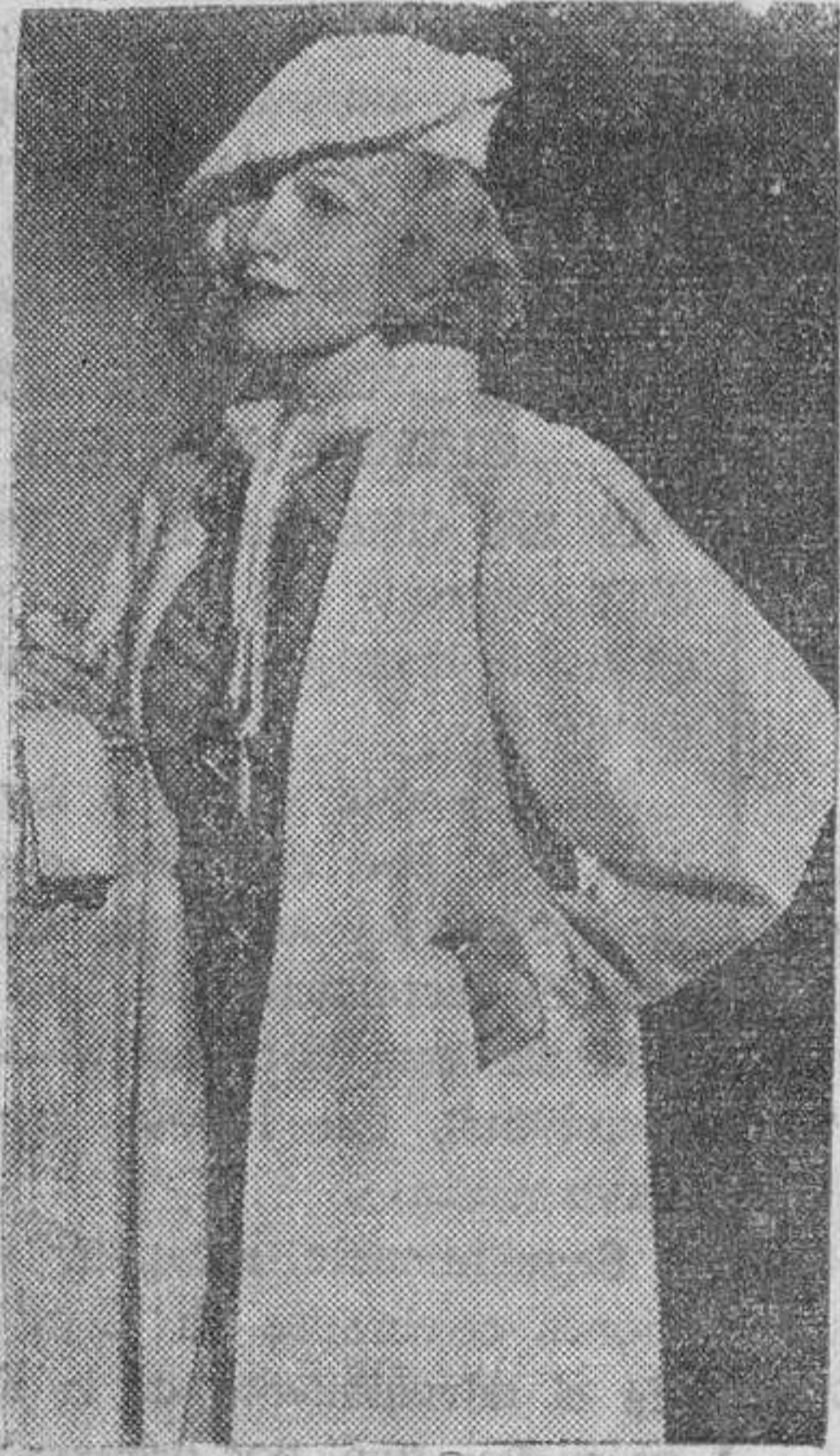
Eléante traje confeccionado en el nuevo material denominado "crepón-pingüino" (1), adornado con falsas lazadas de cordoncillo blanco sobre el fondo azul. El abrigo es blanco, con dos grandes "lágrimas" de oro en los cabos de la "corbata".

Los abrigos de tipo deportivo son casi todos de los llamados "tres cuartos", aludiendo a su largura, reducida en esta proporción. Son amplios y están