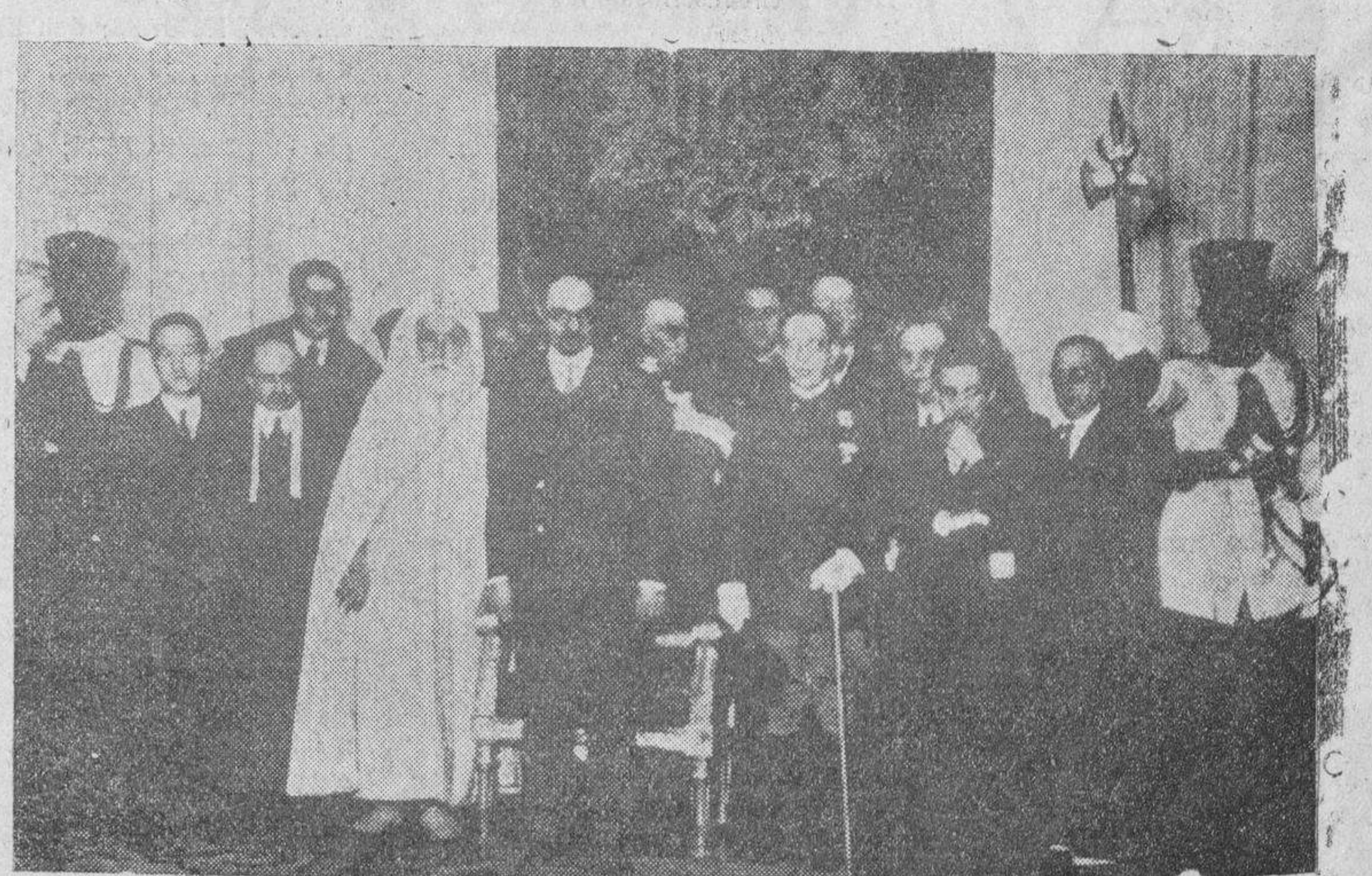
El nuevo Alto Comisario de España en Marruecos, don Juan Moles, en el momento de tomar posesión de su cargo, acompañado del Gran Visir y otras autoridades tetuaníes