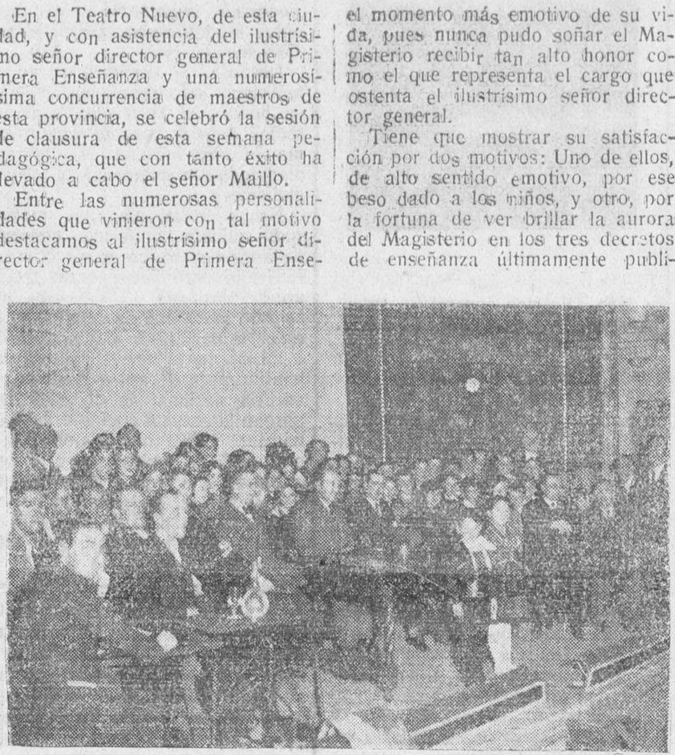
La presidencia de la sesión de clausura de la Semana Pedagógica que tan brillantemente se ha verificado en Ciudad Rodrigo