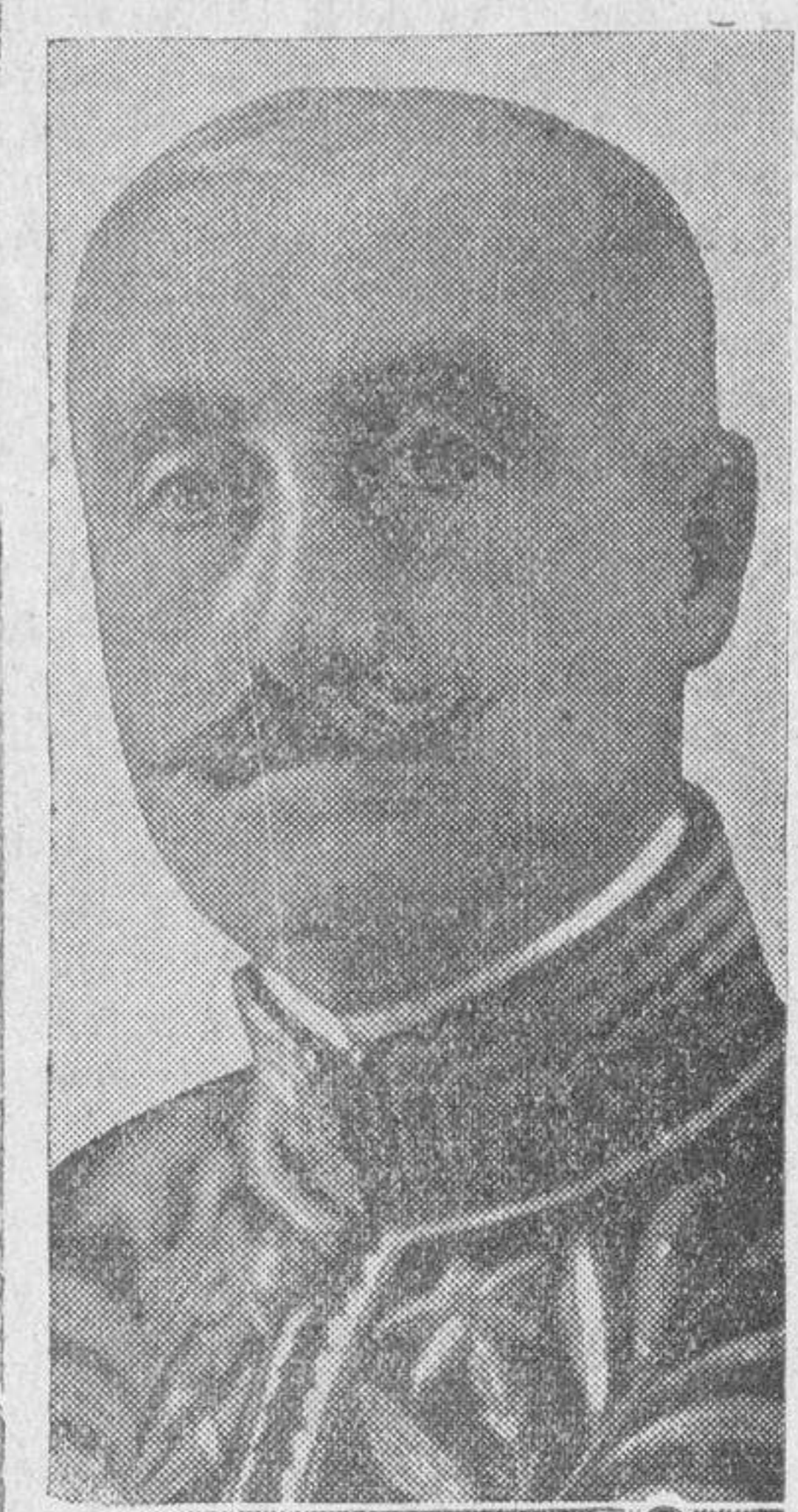
Don José Baret, quien, al dimitir el señor Mendieta, ha ocupado la presidencia de la República de Cuba