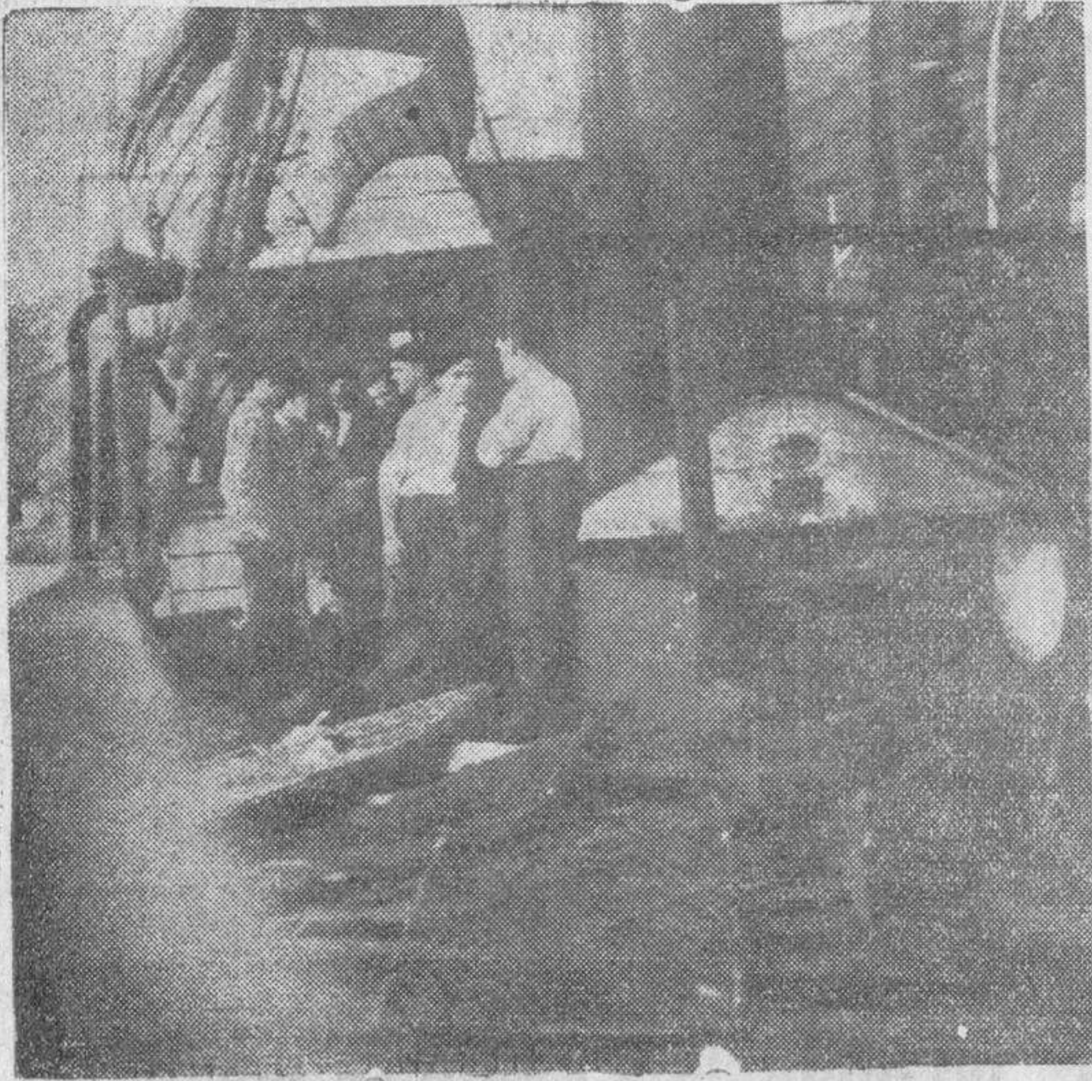
Estado en que quedó la cubierta del vapor «Magdalena», después de la explosión ocurrida en el puerto de Avilés