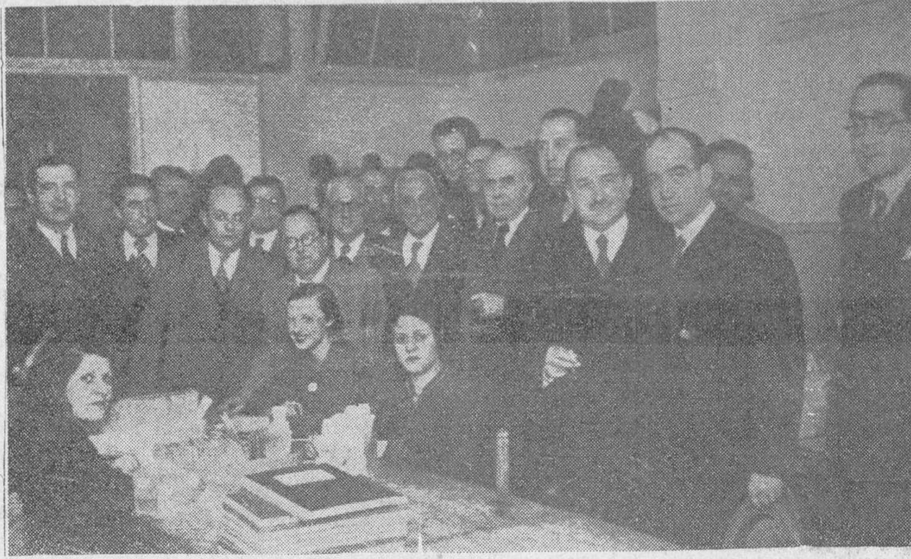
El gobernador general de Cataluña, señor Vilalonga, visitando las oficinas del carnet electoral, en Barcelona